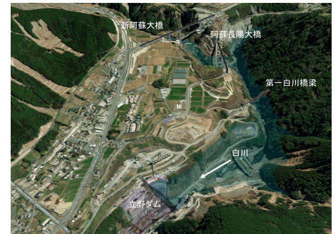
湛水範囲イメージ図