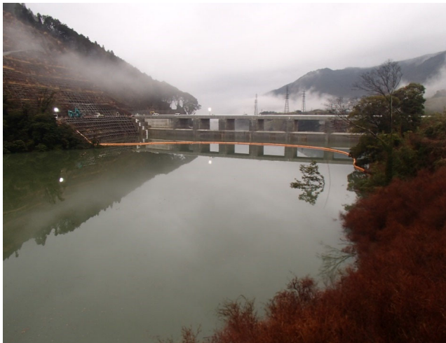
右岸からダム上流面を望む