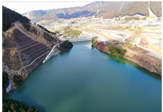
立野ダムの状況（R6. 1. 30 撮影）