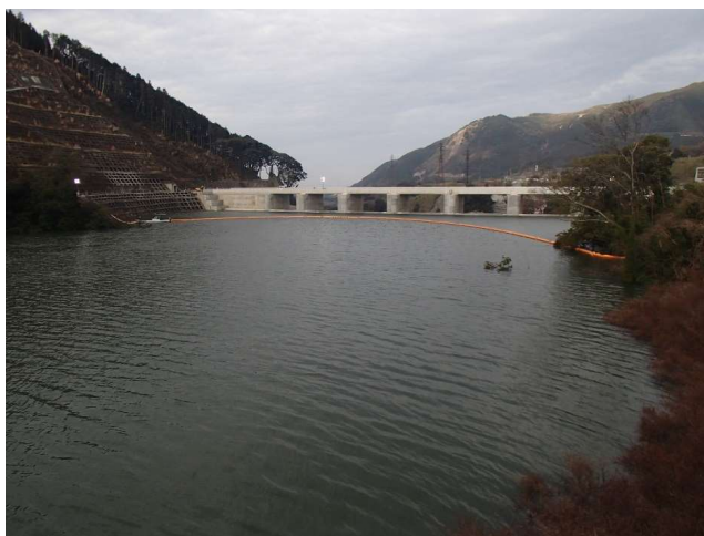
右岸からダム上流面を望む