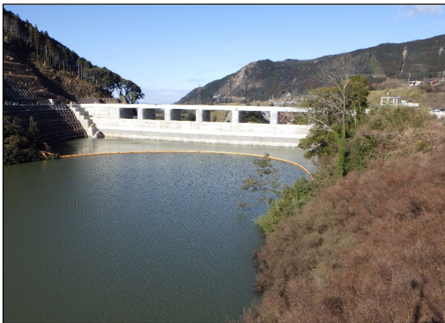
右岸からダム上流面を望む