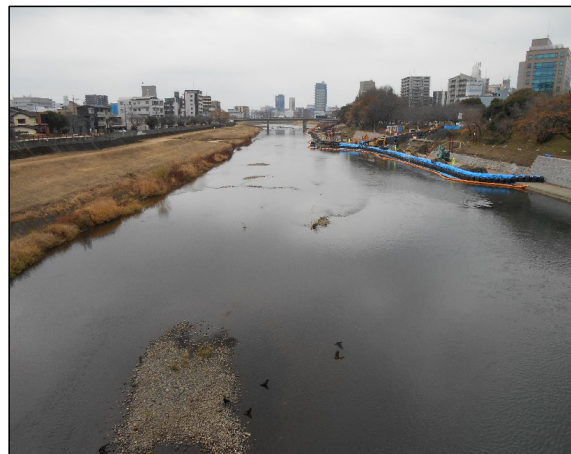
平常時の代継橋地点の状況(1/12)