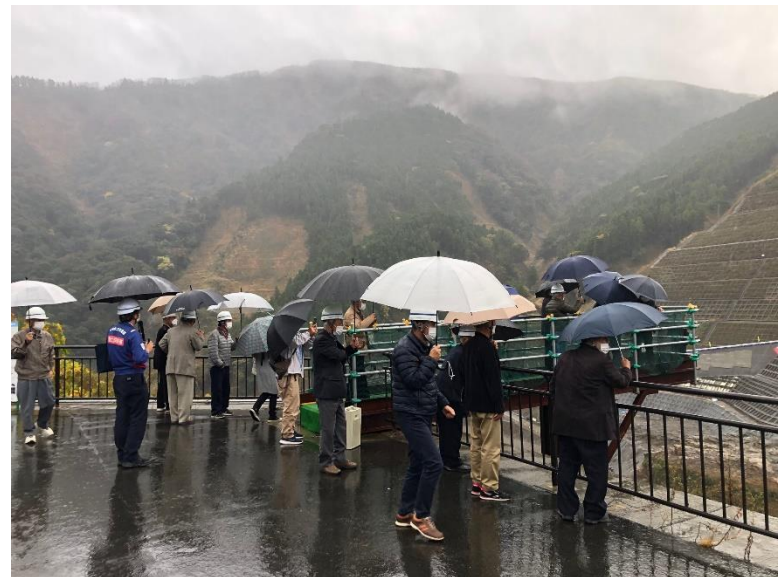
R4.11 熊本市住民現地説明【22名】