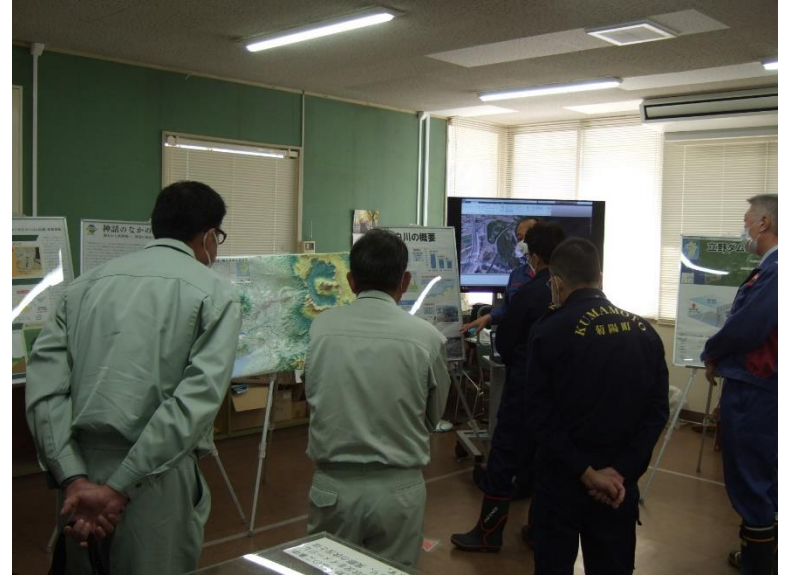
R4.11 菊陽町長・職員現地説明【4名】