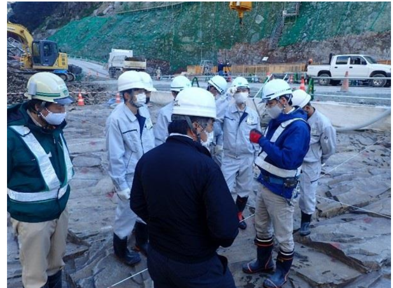
R2.12 高校生現地説明【6名】