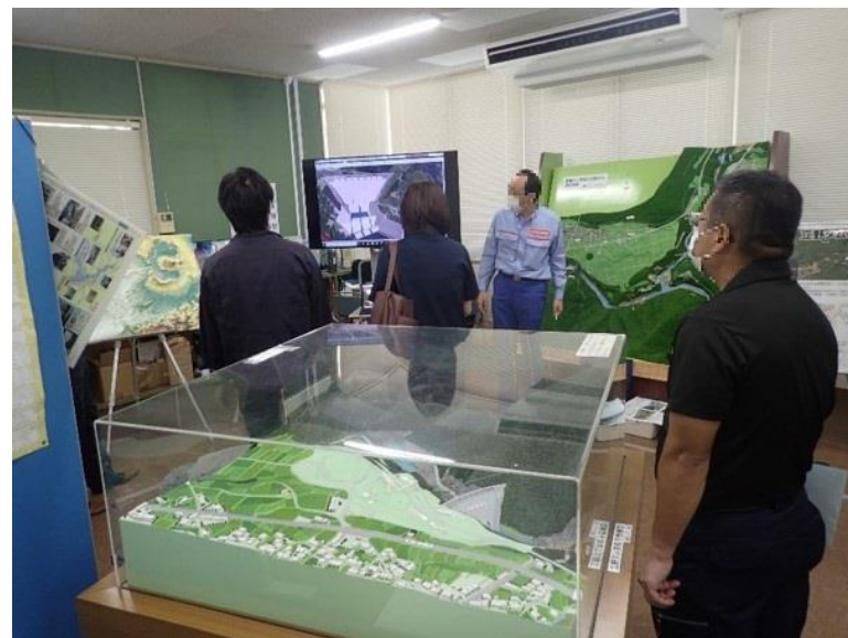
R3.7 行政機関現地説明【12名】