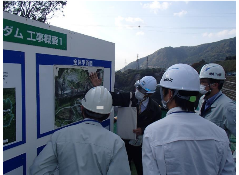
R3.11 菊陽町職員現地説明【4名】