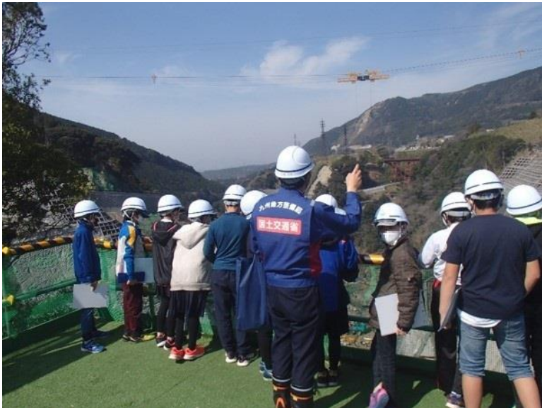
R3.3 小学生現地説明【10名】