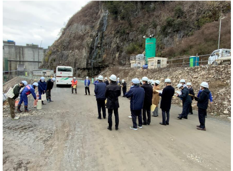
R5.2 大津町議会議員現地説明 【32名】