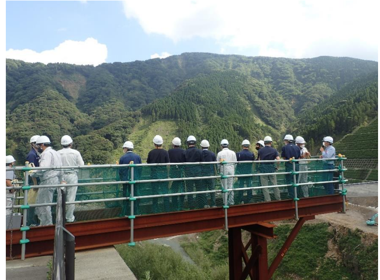
R4.7 熊本県職員現地説明【28名】