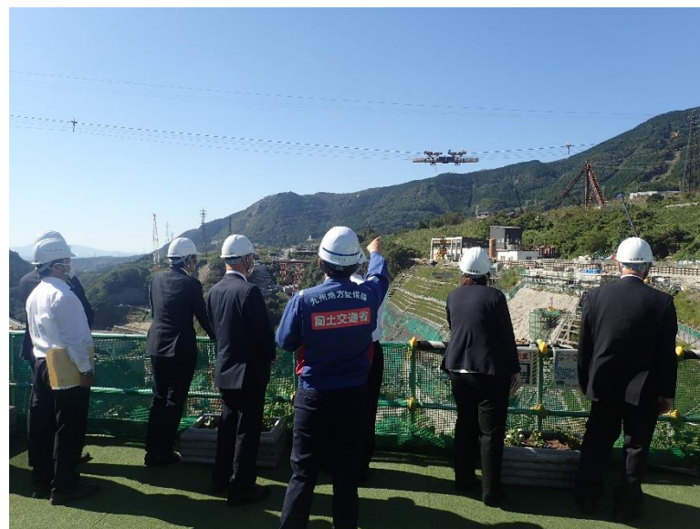
R4.10 流域外自治体議員等現地説明【13名】