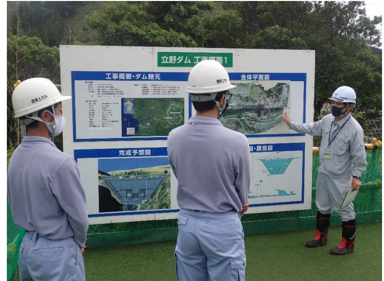
R4.7 高校生現地見学【2名】