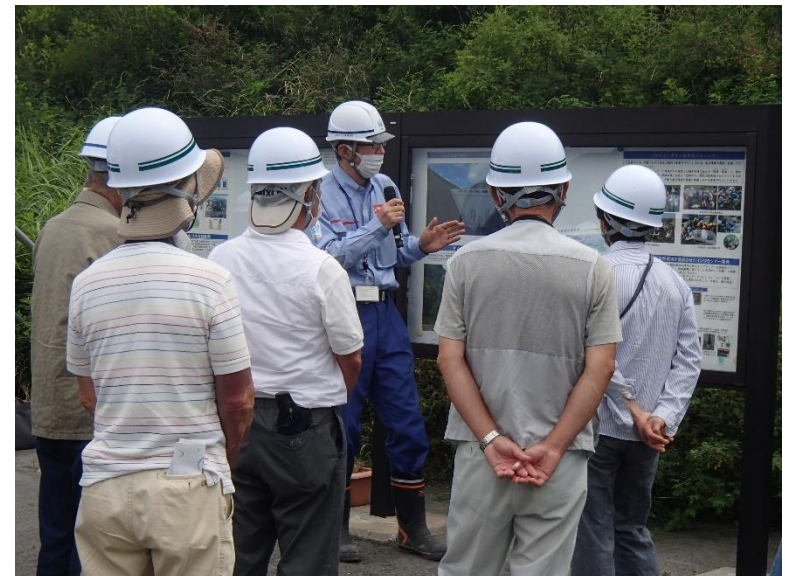
R4.6 南阿蘇村立野地区住民現地説明【95名】