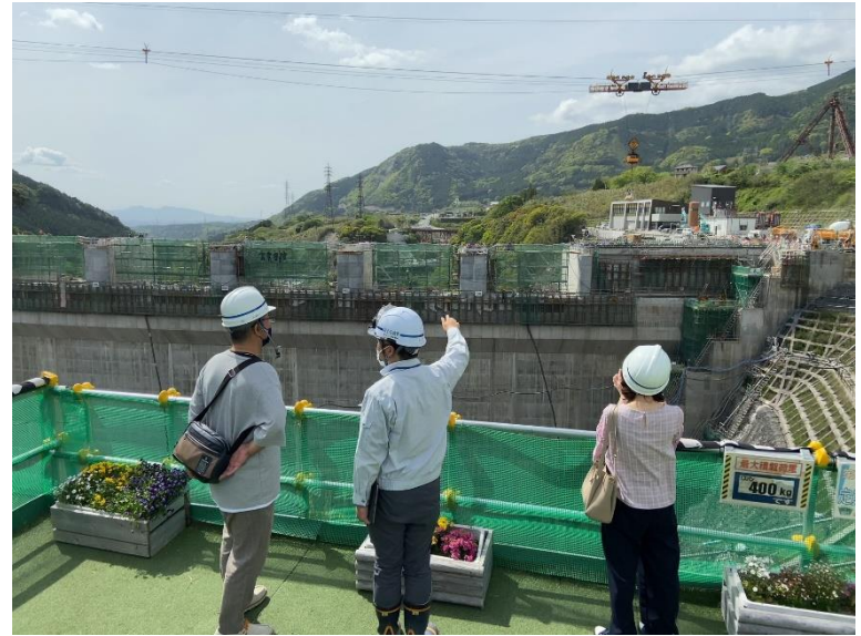
R5.4 絵本作家及び事務所職員現地説明【5名】