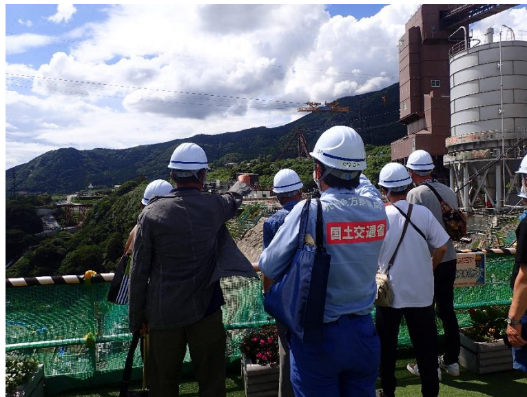
R4.6 熊本市住民現地説明【11名】