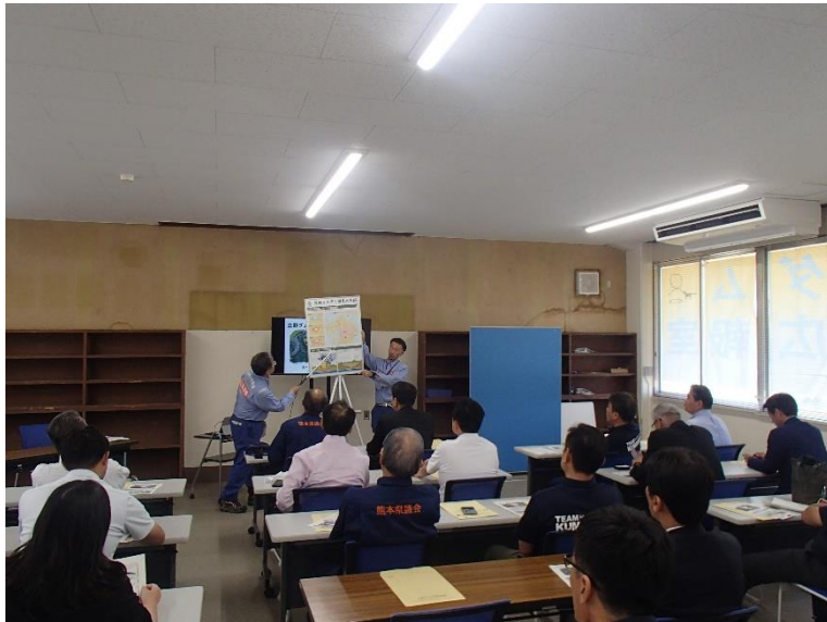
R5.6 自由民主党 熊本県議会議員団現地説明【30名】