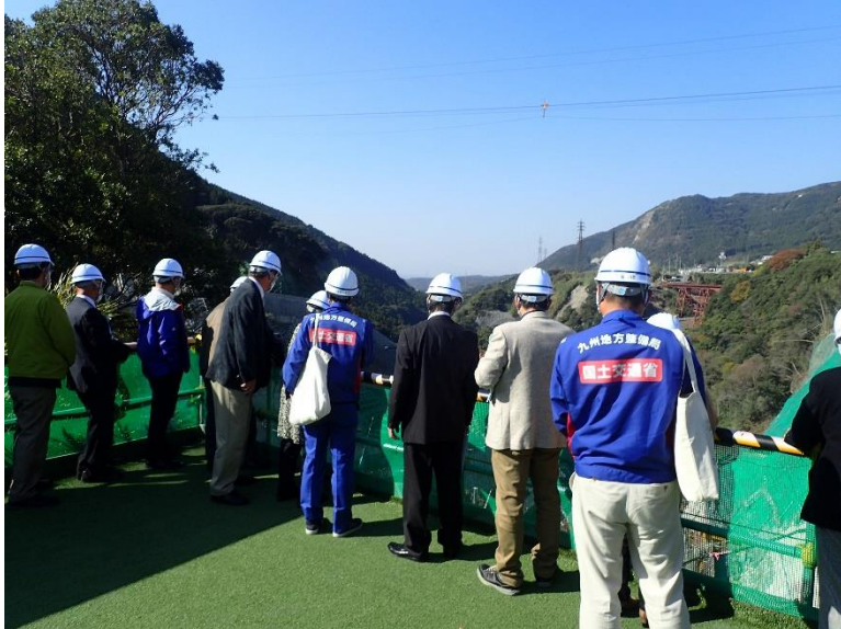
R3.11 流域外自治体議員等現地説明【12名】