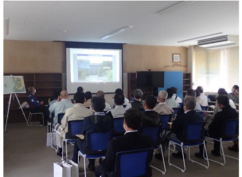
R4.11 日本建設業連合会現地説明【23名】