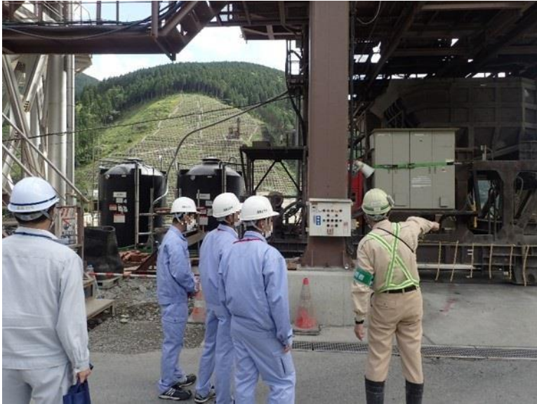
R3.7 高校生現地説明【3名】