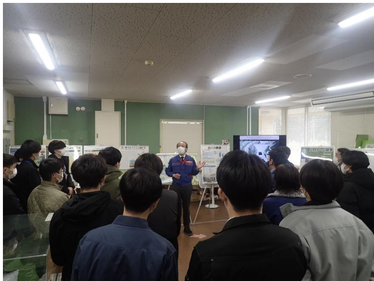
R5.2 熊本県職員現地説明 【31名】