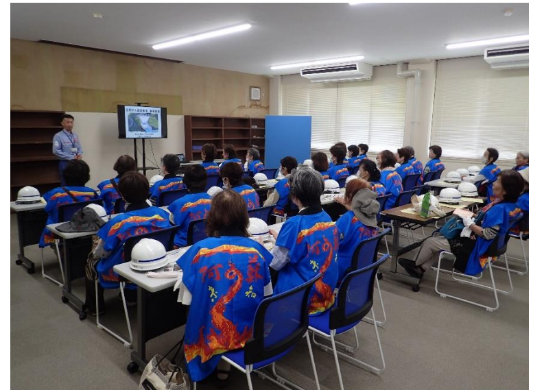
R5.8 一般市民現地説明【29名】