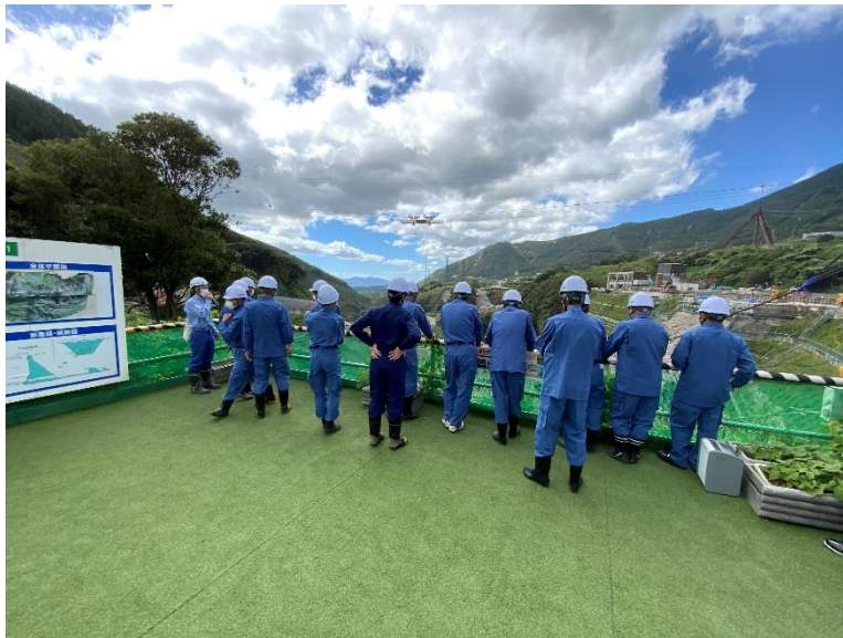
R4.9 南阿蘇村議会議員現地説明【19名】