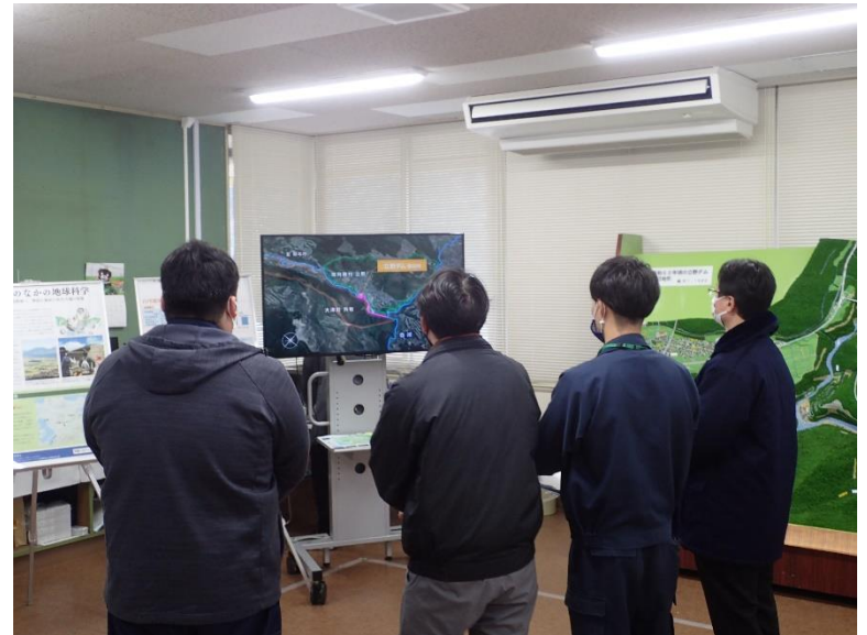
R4.3 西原村職員現地説明【4名】