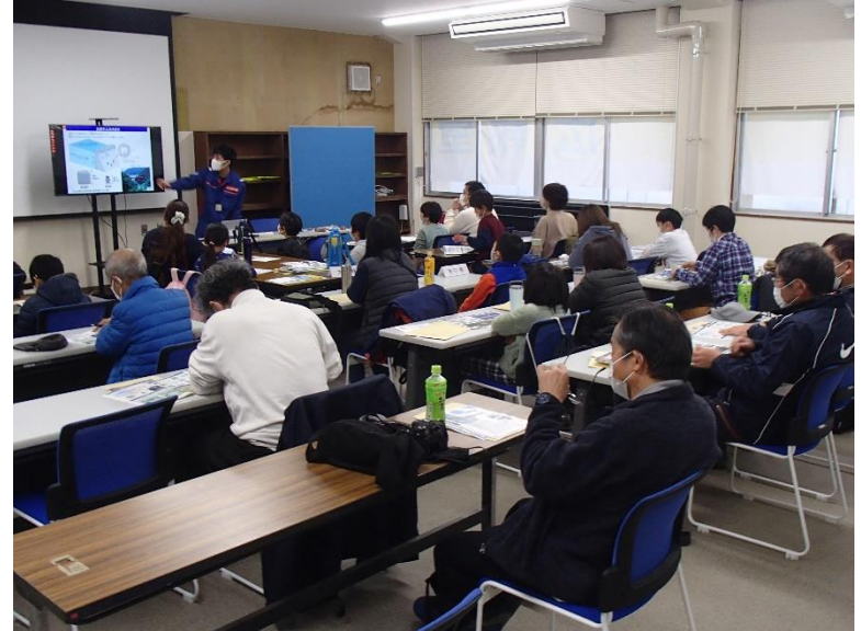
R4.11 白川上下流交流会【26名】