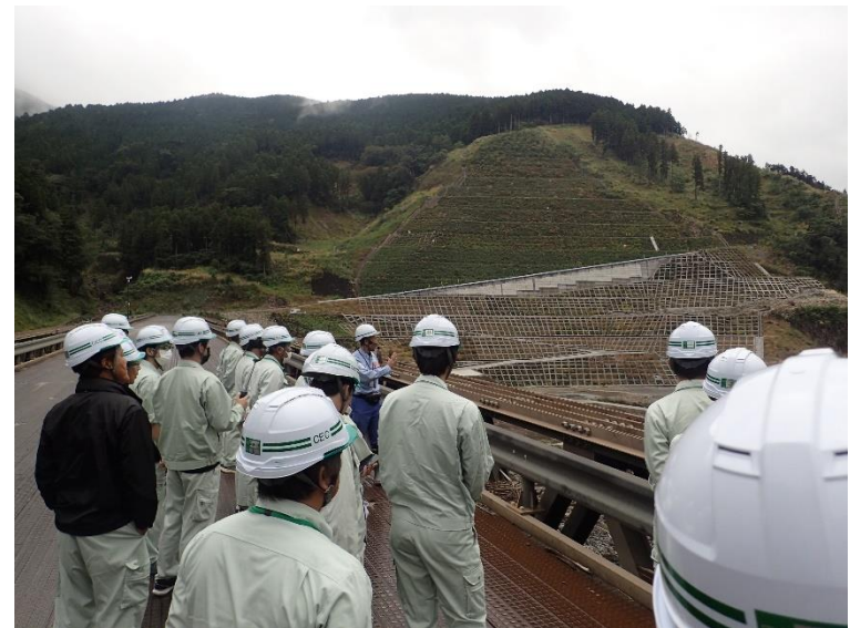
R5.10 建設コンサルタント現地説明【35名】