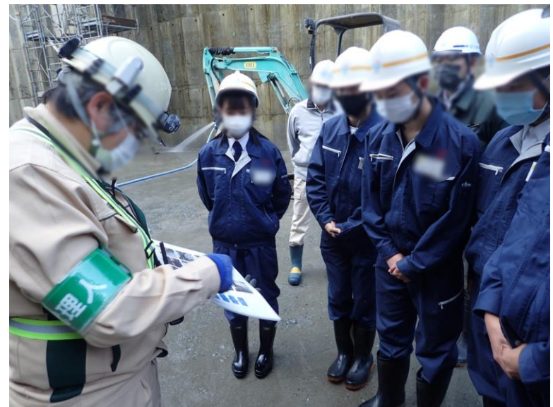
R3.12 高校生現地説明【6名】