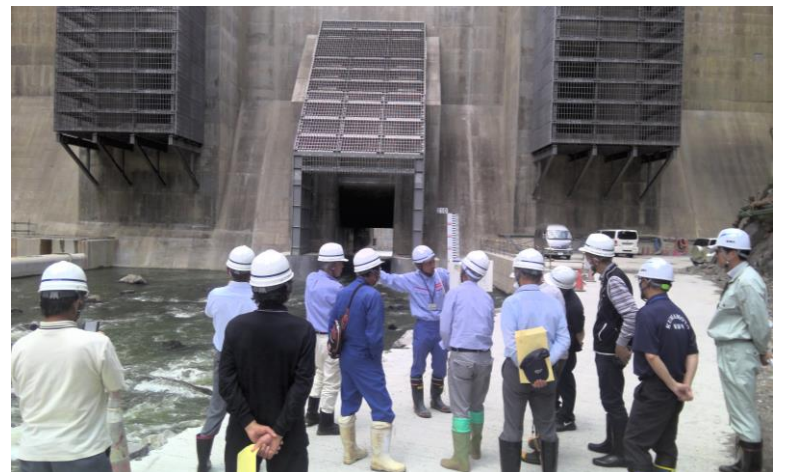
R5.5 菊陽町自治会長会現地説明【16名】