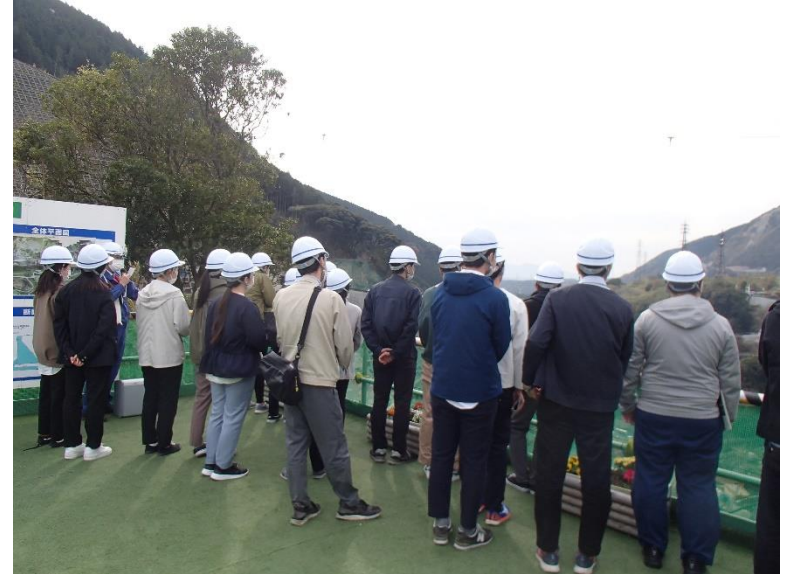
R4.4 熊本県職員現地説明【166名】