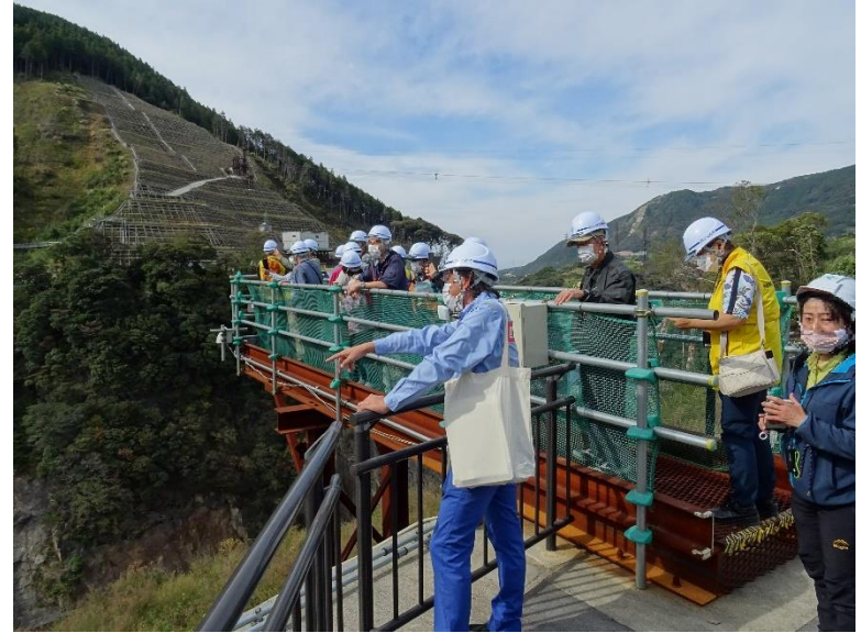
R3.10 一般住民現地説明【18名】