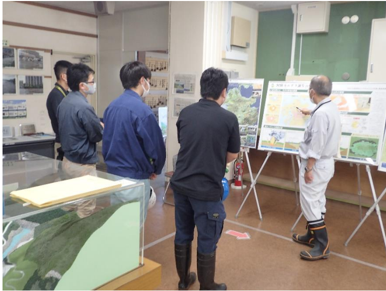
R4.8 阿蘇市議会議員・職員現地説明【16名】