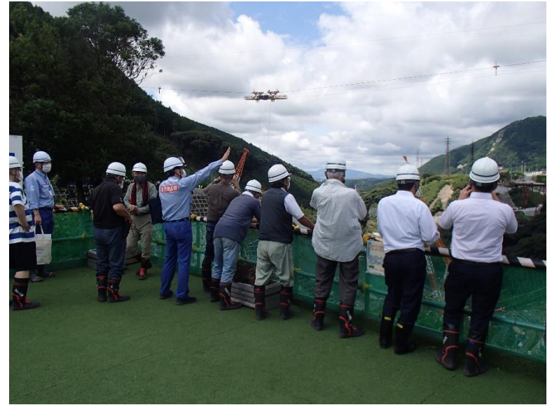
R4.8 環境文化部会現地説明【12名】