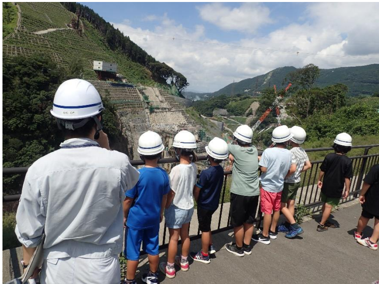
R4.8 一般住民現地説明【12名】