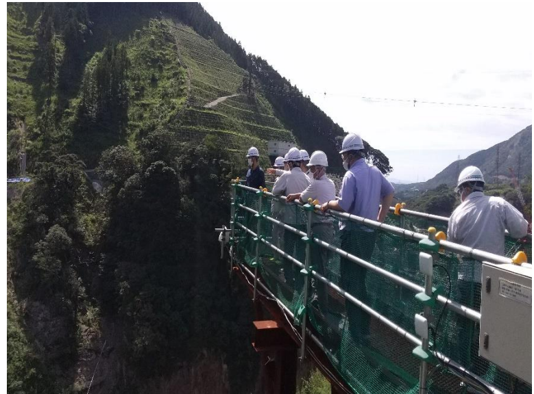
R4.9 大学生現地説明【3名】