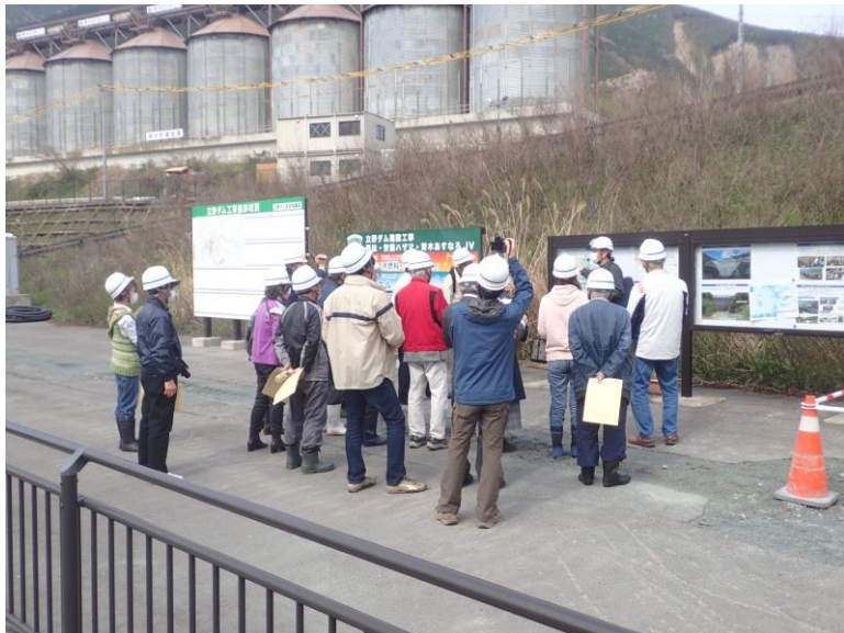
R5.3 阿蘇学会現地説明【23名】