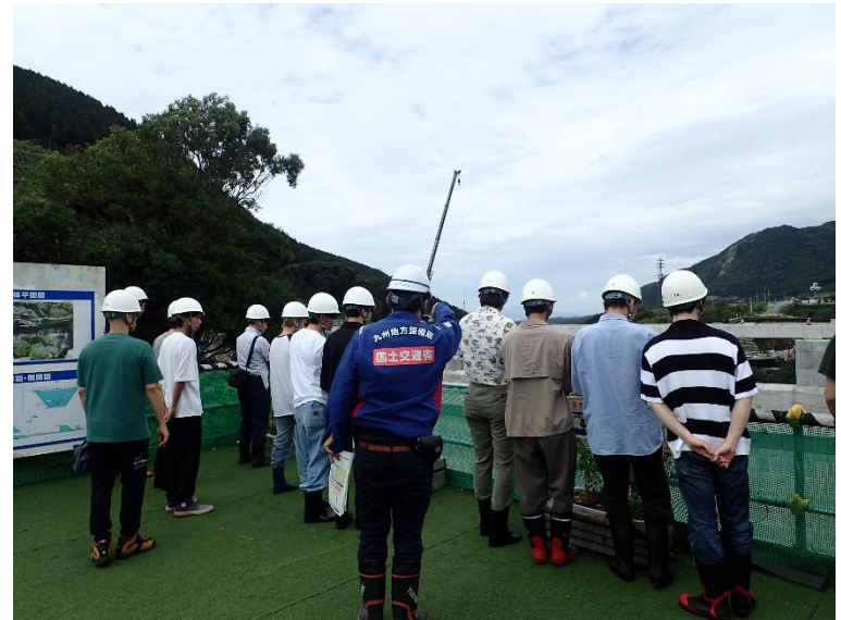
R5.9 大学生現地説明【70名】