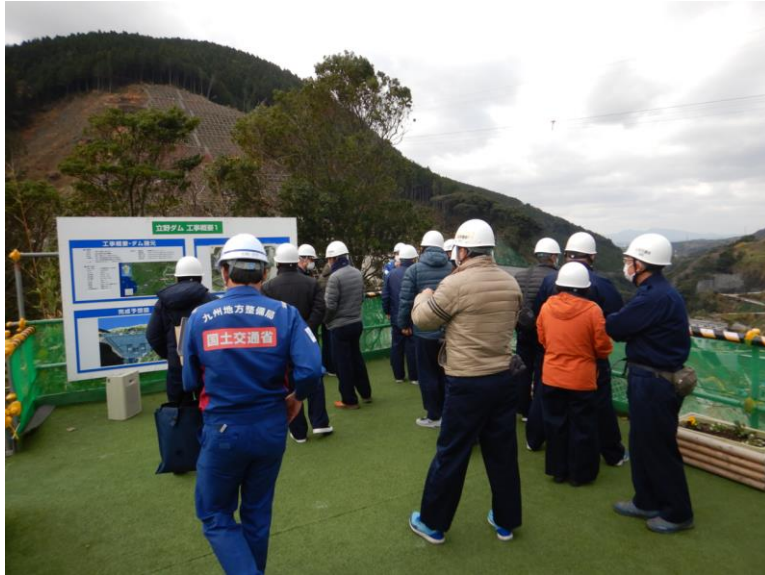
R3.12 流域外自治体議員等現地説明【35名】