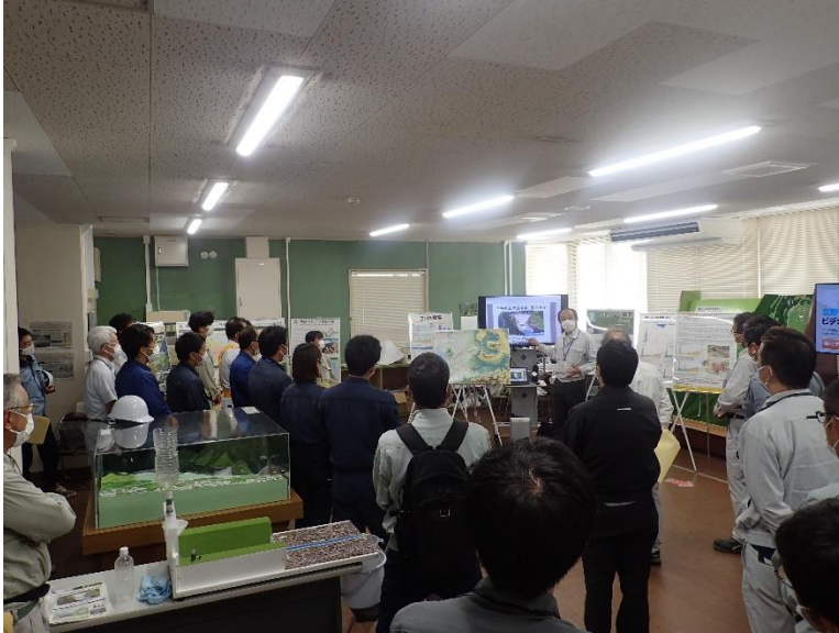
R4.9 熊本県コンクリート診断士会現地説明【35名】