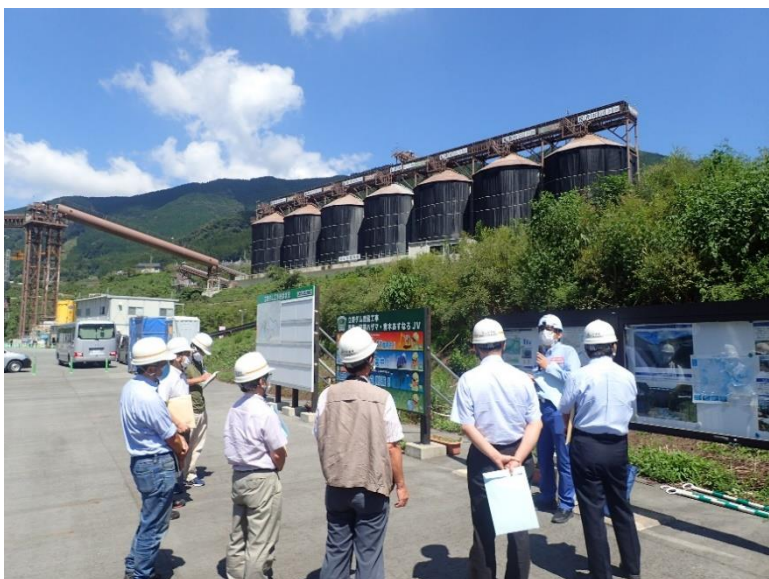
R3.9 大学関係者現地説明【10名】