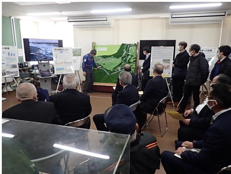
R5.2 流域外自治体議会議員現地説明 【19名】