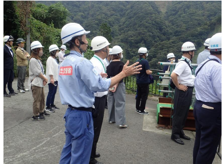
R5.9 熊本県防災協会【45名】