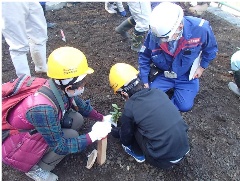
R3.11 デミーとマツの土木体験イベント【5名】