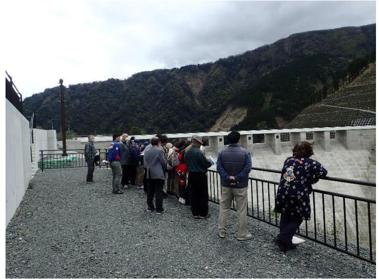
R6.4 一般住民現地説明【24名】