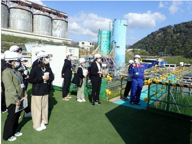
R3.4 熊本県職員現地説明【169名】