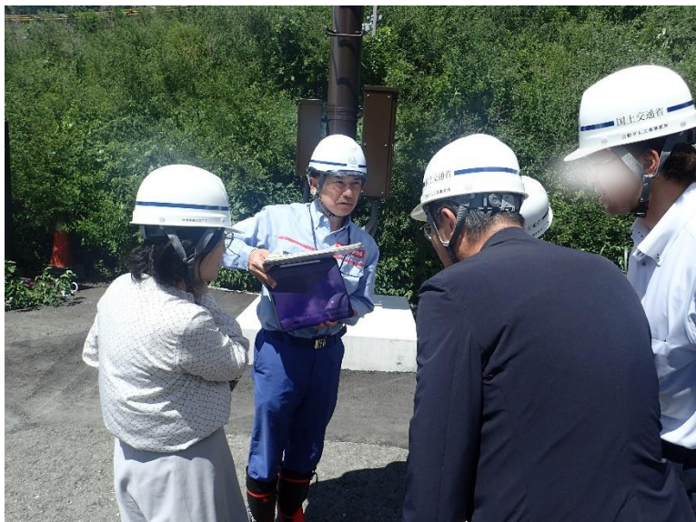
R5.7 熊本県職員現地説明【5名】