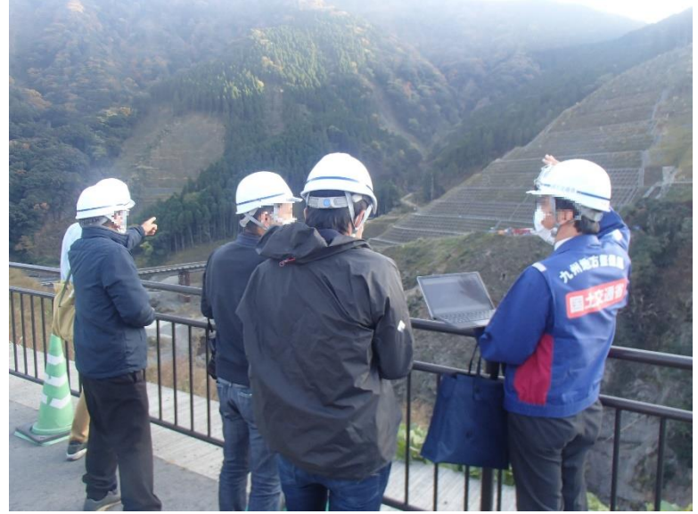
R3.11 一般住民現地説明【5名】