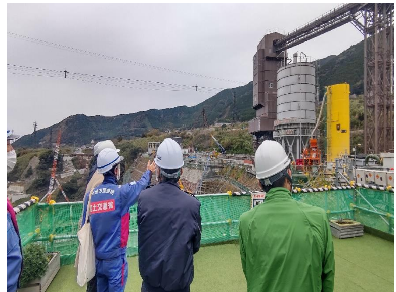
R4. 12 熊本県副知事等現地説明【4名】