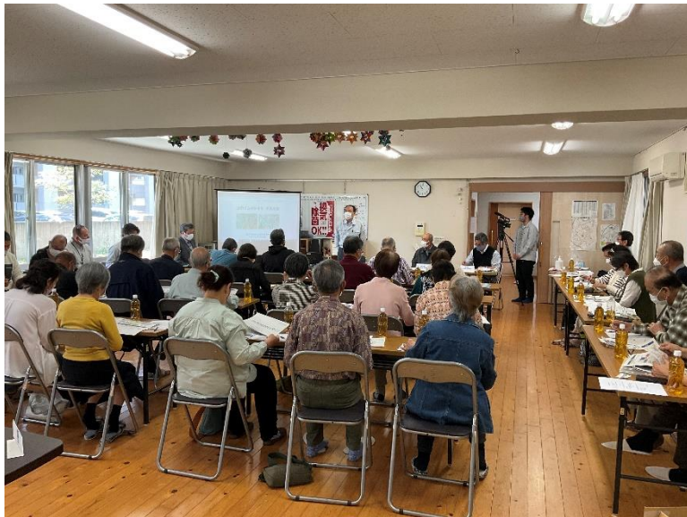
R4.4 熊本市大江校区住民事業説明【25名】