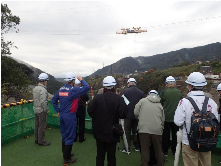
R3.11 一般住民現地説明【13名】