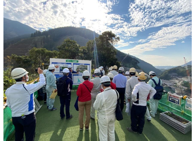
R4.11 日本応用地質学会現地視察【44名】