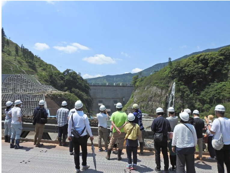
R5.5 立野ダム本体打設完了式見学会【110名】