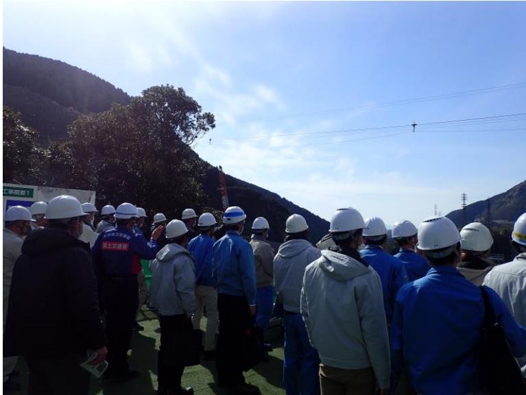
R5.3 熊本市震災対策課現地説明【30名】