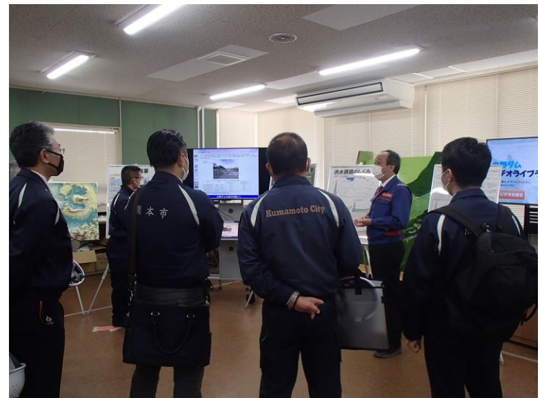
R5.3 熊本市危機管理防災総室現地説明【7名】