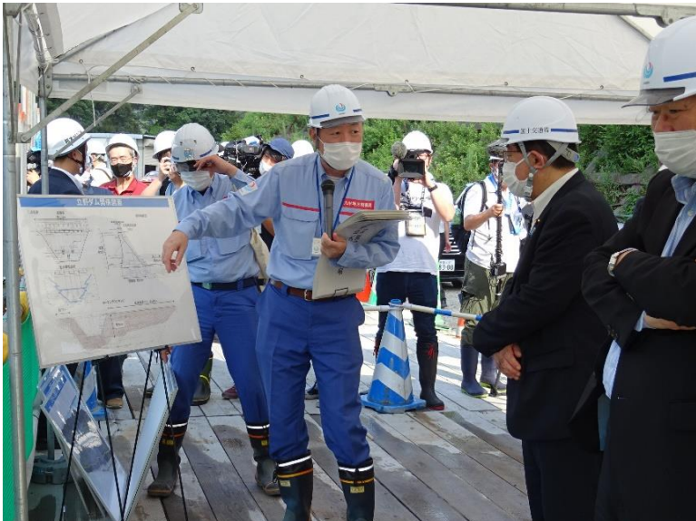
R4.7 総務大臣等現地説明【10名】