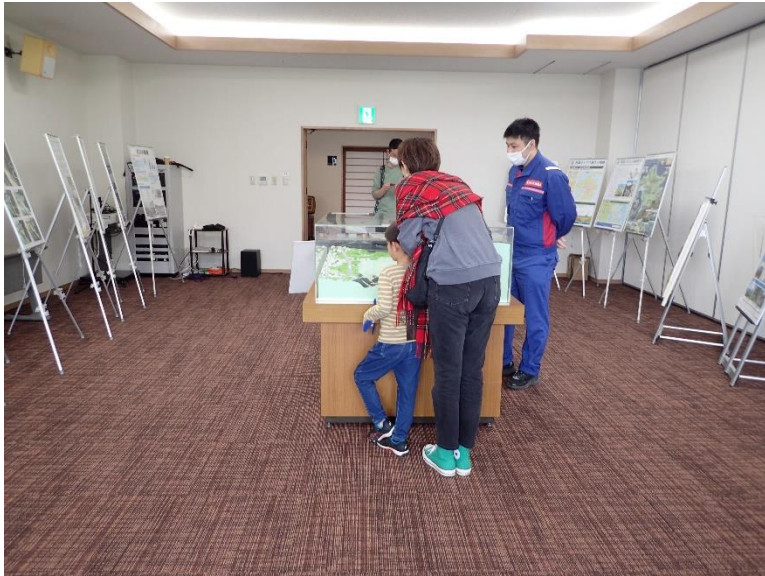
R5.4 第4回 阿蘇東急でアソぼうパネル展示【20名】