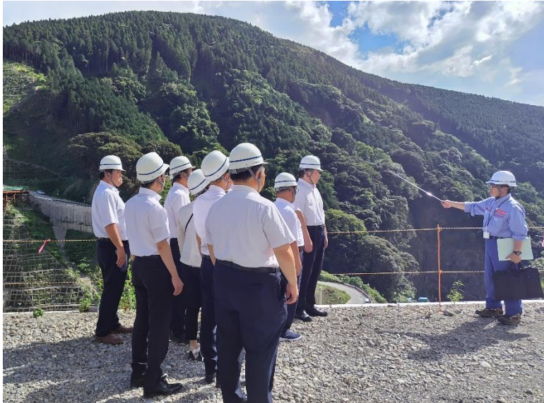
R5.8 熊本県議会議員、市議会議員【11名】