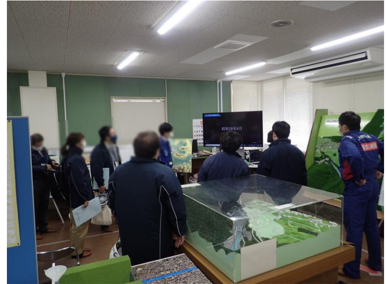
R3. 12 大津町職員現地説明【12名】