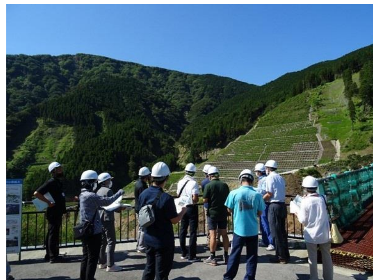
R3.7 南阿蘇村民現地説明【15名】