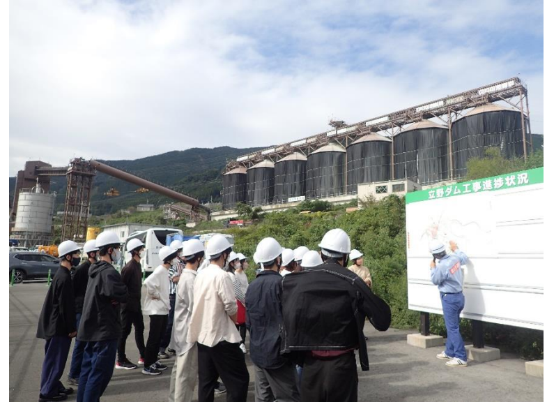
R4.9 大学生現地説明【49名】