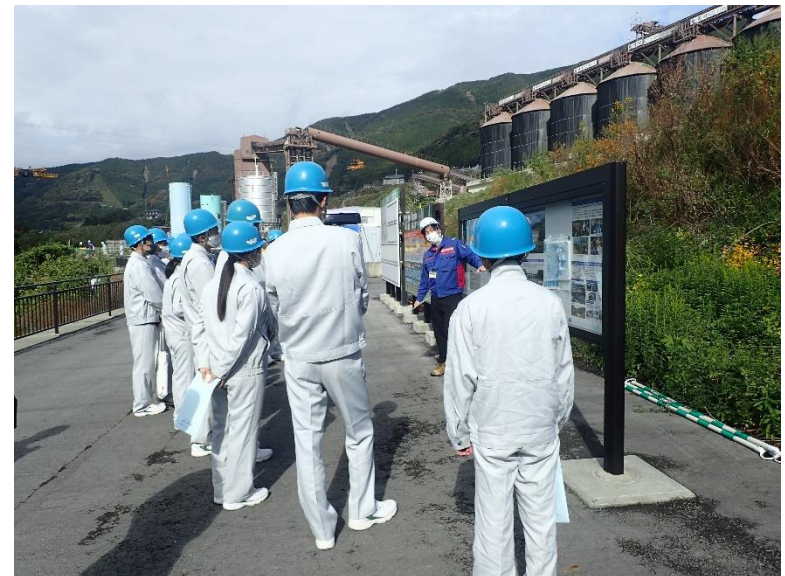
R3.11 高校生現地説明【81名】