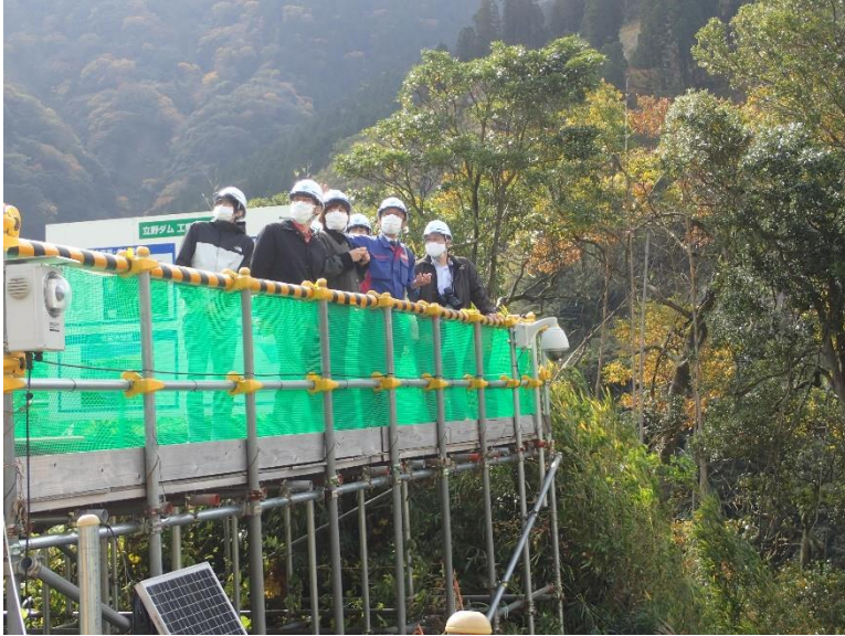
R3.11 大学関係者現地説明【6名】