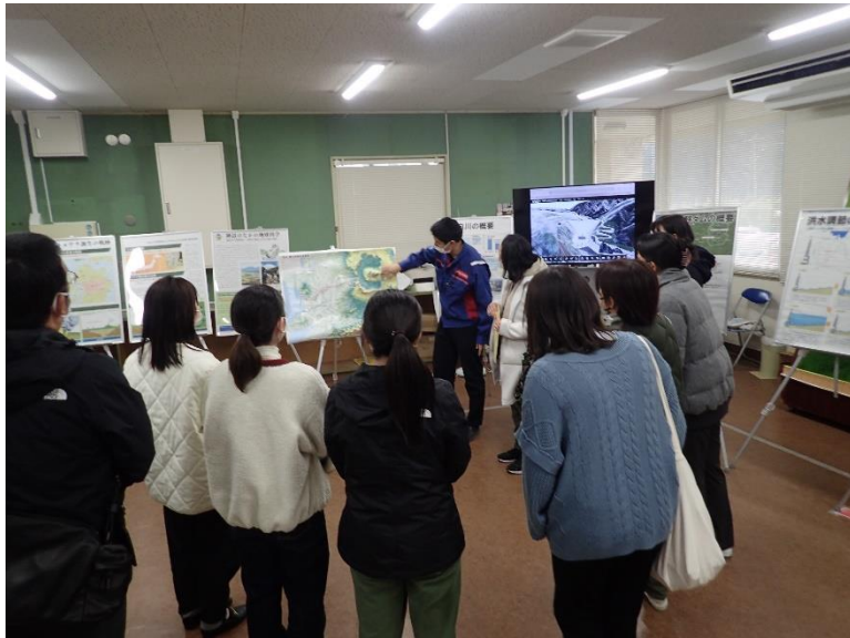
R5.2 一般住民現地説明 【12名】