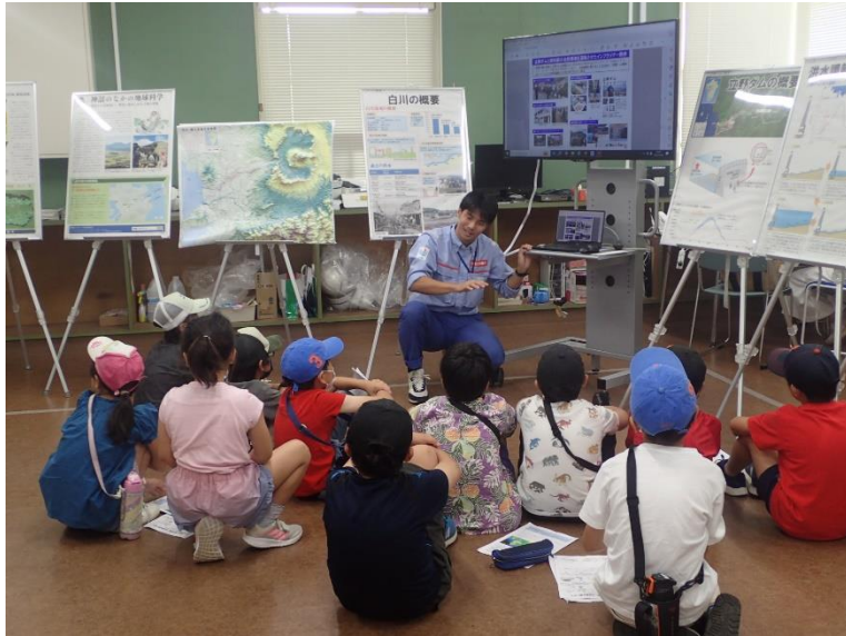
R5.7 一般市民現地説明【15名】