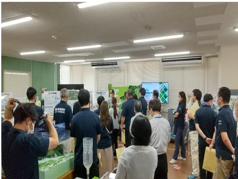
R4.8 高森町役場職員現地説明【70名】