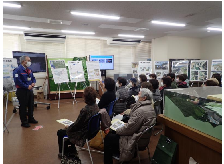
R5.3 大津町住民現地説明【23名】