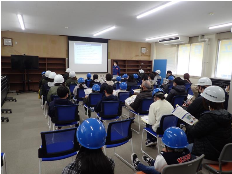
R5.3 大規模工事現場親子見学会【39名】