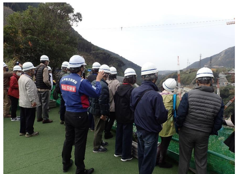
R4.11 熊本市住民現地説明【21名】