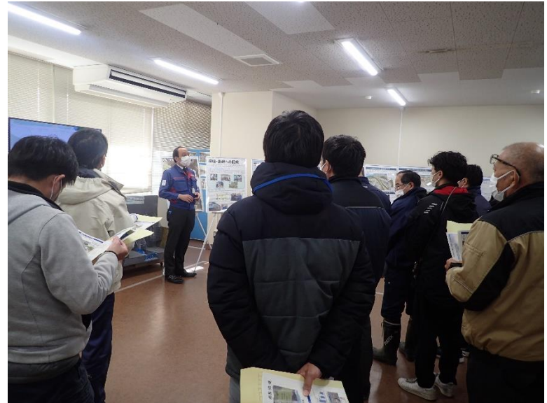
R4.12 熊本県職員現地説明【18名】