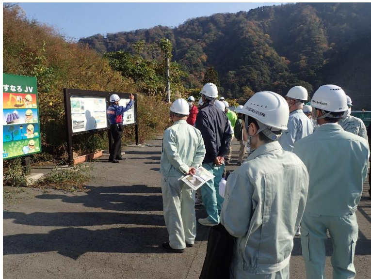
R4.11 行政機関現地説明【57名】