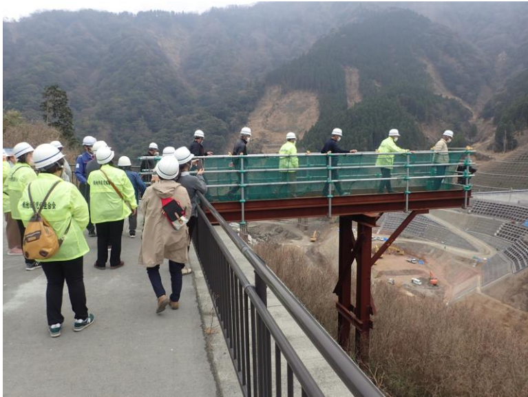
R5.3 菊池市民生委員連合会現地説明【17名】