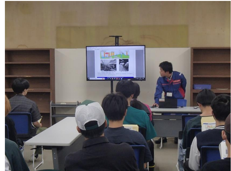
R6.3 大学生現地説明【9名】