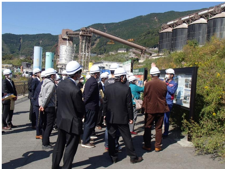
R4.10 九州圏内道路関係者現地説明【78名】