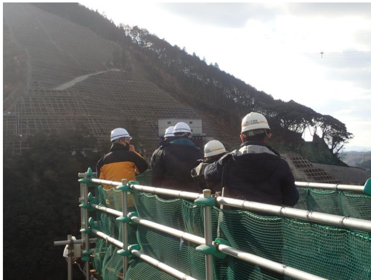
R3. 12 小学校教員現地説明【2名】