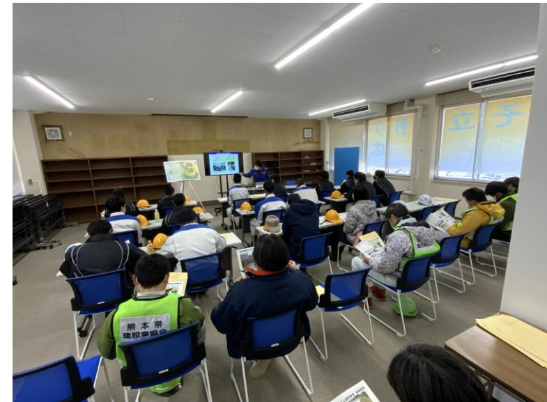
R5.3 高校生現地説明【23名】