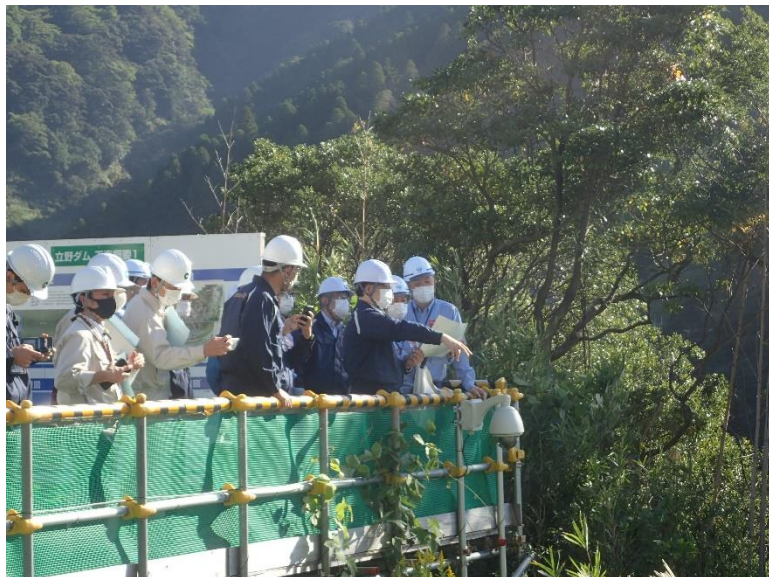
R3.10 熊本市首長・職員現地説明【14名】