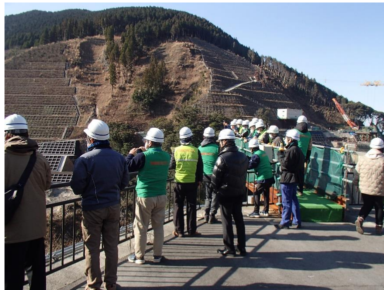
R5.1 菊陽町防災士現地説明【24名】