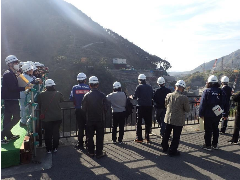
R4.11 流域外自治体区長等現地説明【23名】