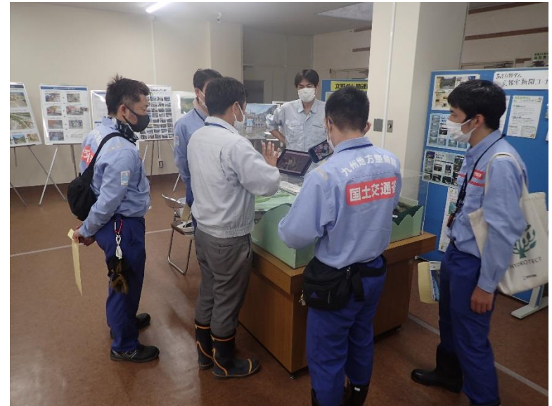
R4.9 大学生現地説明【1名】