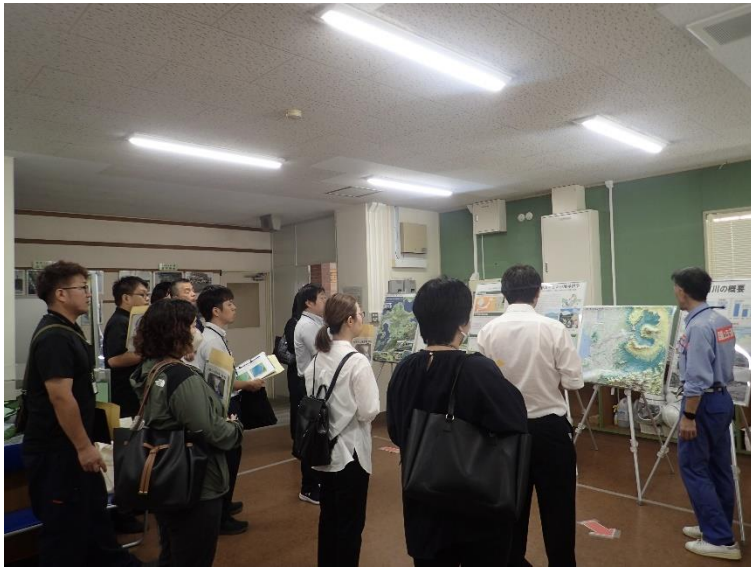
R5.9 流域外自治体職員【13名】