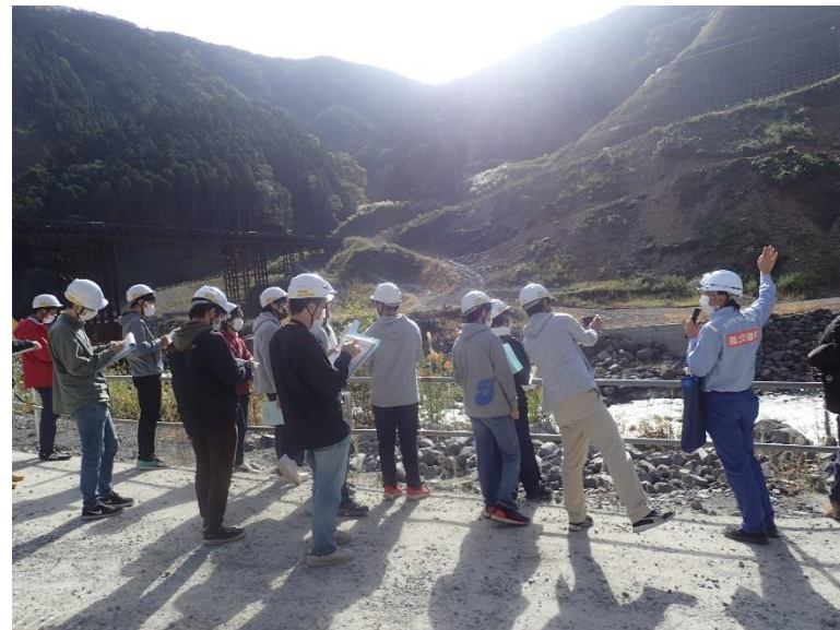
R3.10 大学関係者現地説明【18名】