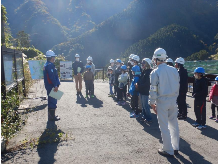
R4.11 土木の日バスツアー【64名】