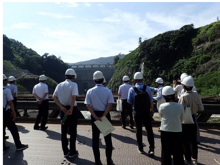
R5.7 熊本県職員現地説明【20名】