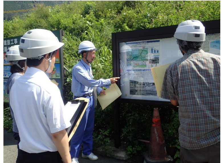
R5.7 南阿蘇村新任教員現地説明【5名】