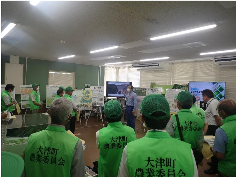
R4.7 大津町農業委員会現地説明【26名】