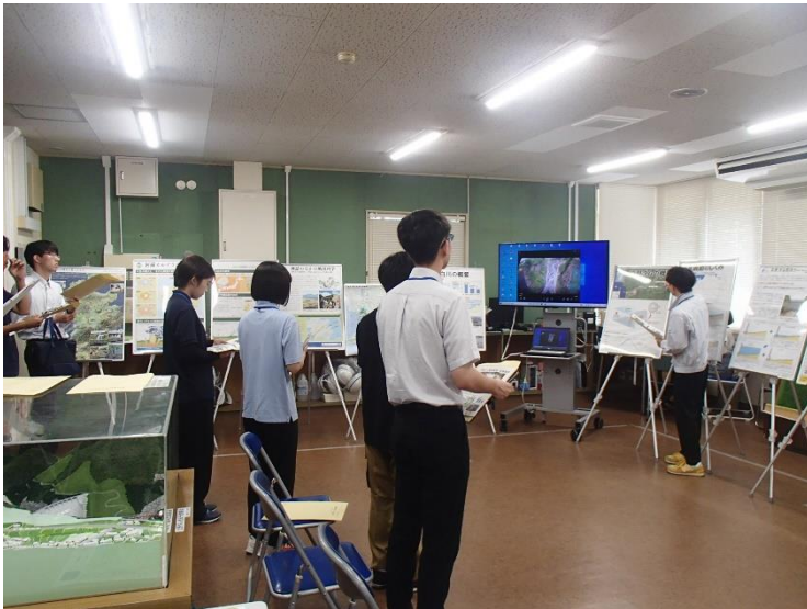
R6.3 大学生現地見学【10名】