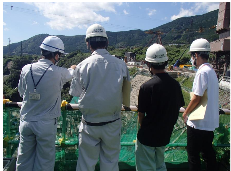
R4.8 大学生現地説明【3名】