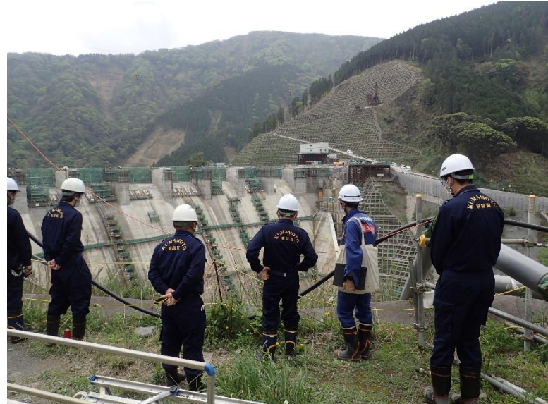
R5.4 菊陽町副町長・職員現地説明【7名】