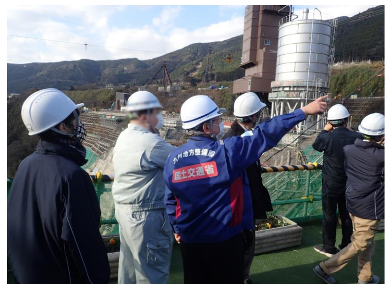
R3. 12 大津町職員現地説明【5名】