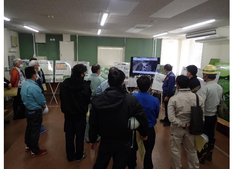
R4.11 熊本県土木施工管理技士会現地説明【16名】