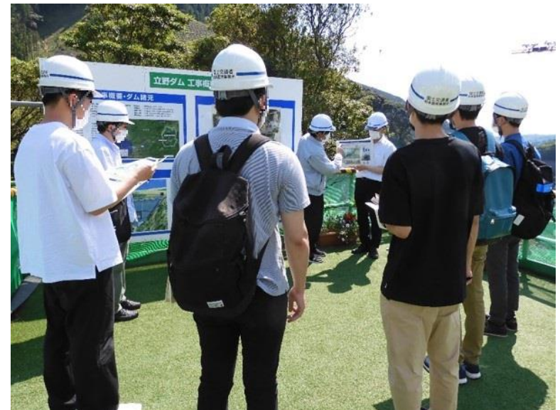
R3.6 大学生現地説明【7名】