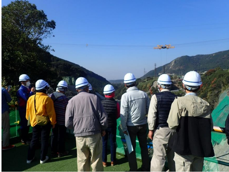
R3.11 一般住民現地説明【17名】