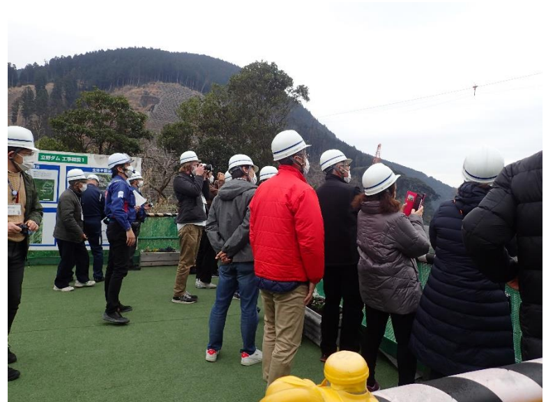
R5.2 NPO団体现地説明 【25名】