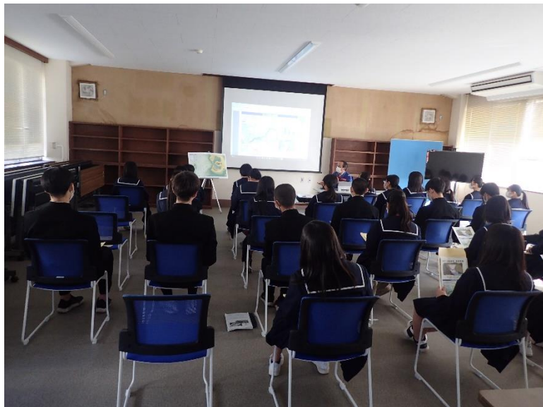
R4.10 高校生現地説明【32名】