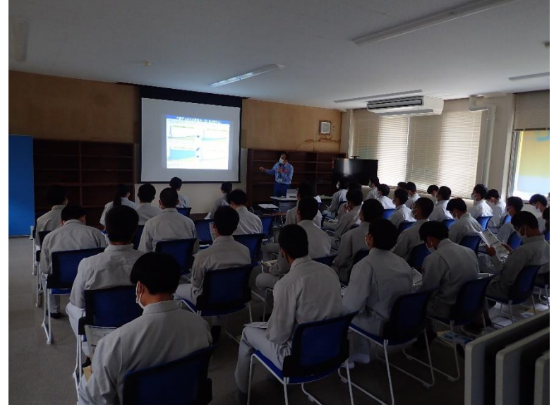
R4.5 高校生現地説明【42名】