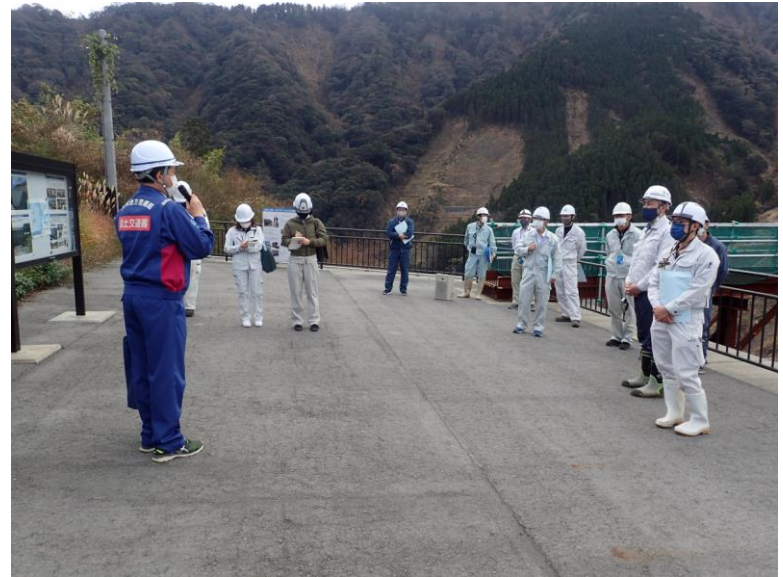
R3.12 熊本県測量設計コンサルタンツ協会現地説明【26名】