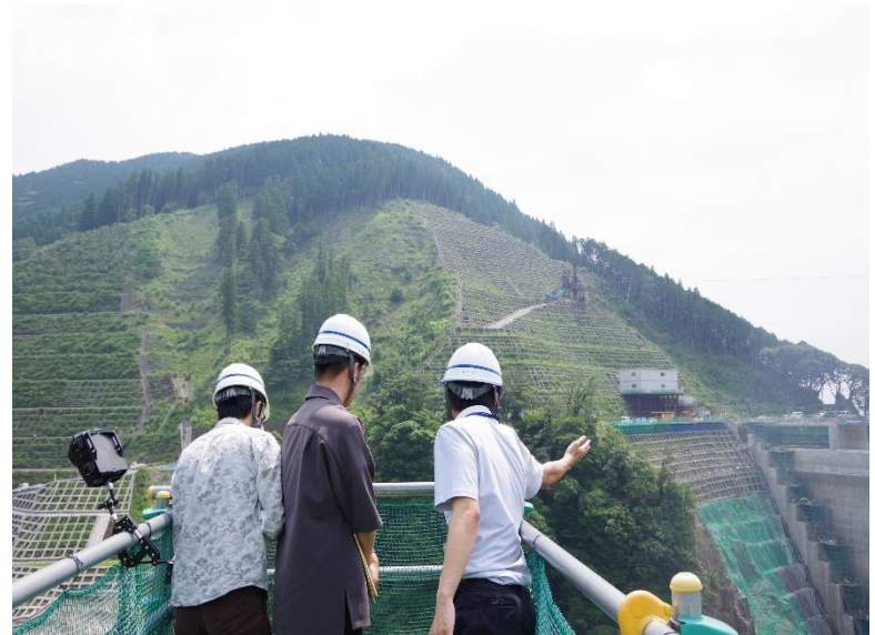
R5.6 大学生現地説明【2名】