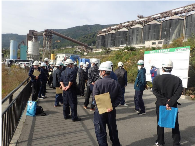
R4.11 九州農政局現地視察【32名】