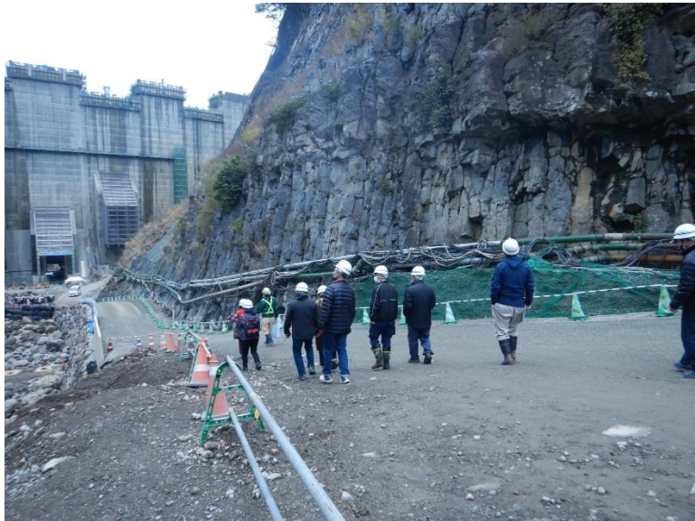
R5.1 立野地区住民 放流孔ウォークイベント 【61名】