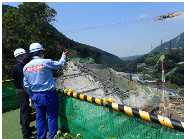
R3.7 大津町職員現地説明【3名】