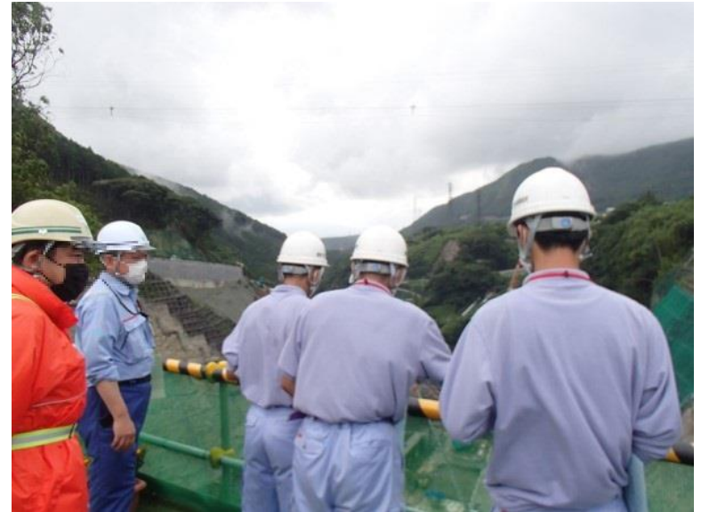
R3.7 高校生現地説明【5名】