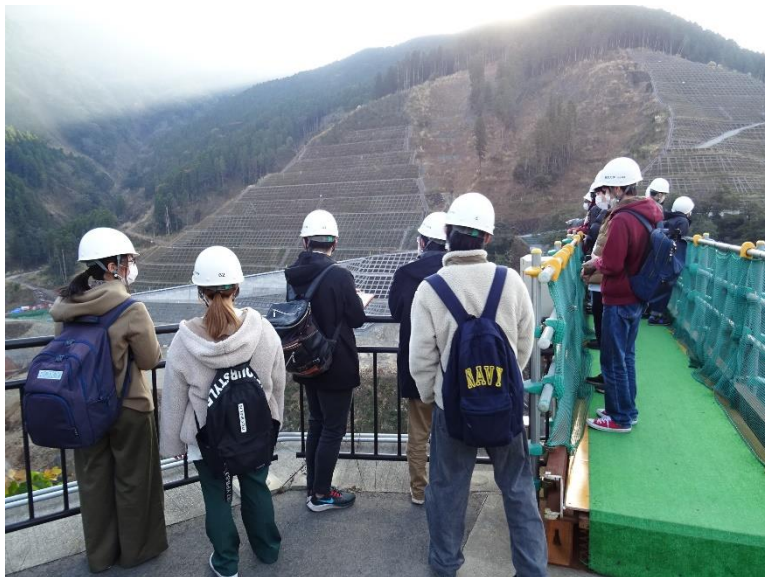
R4. 12 大学生現地説明【84名】