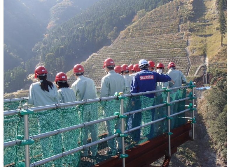
R3.11 高校生現地説明【30名】