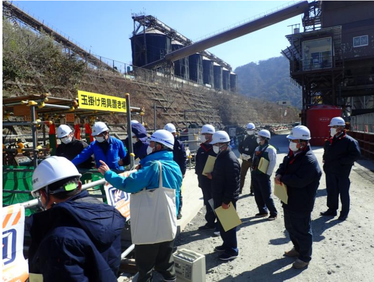
R4. 2 南阿蘇村議会議員等現地説明【11名】