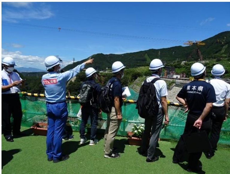
R3.8 行政機関現地視察【35名】