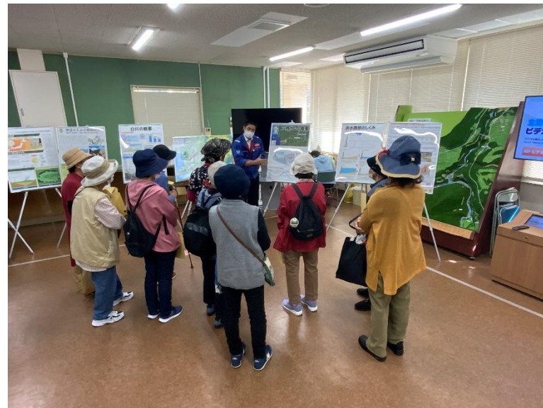
R4.10 熊本市力合地区住民現地説明【12名】