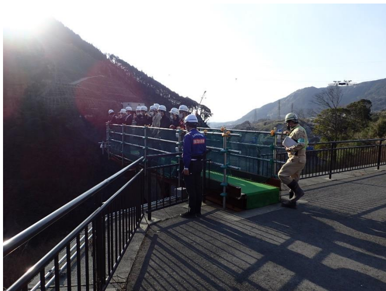
R5.2 日本建設業連合会災害対策部会現地説明【10名】