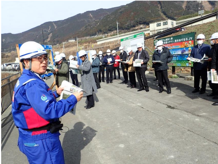
R6.1 南阿蘇村議会現地説明【20名】