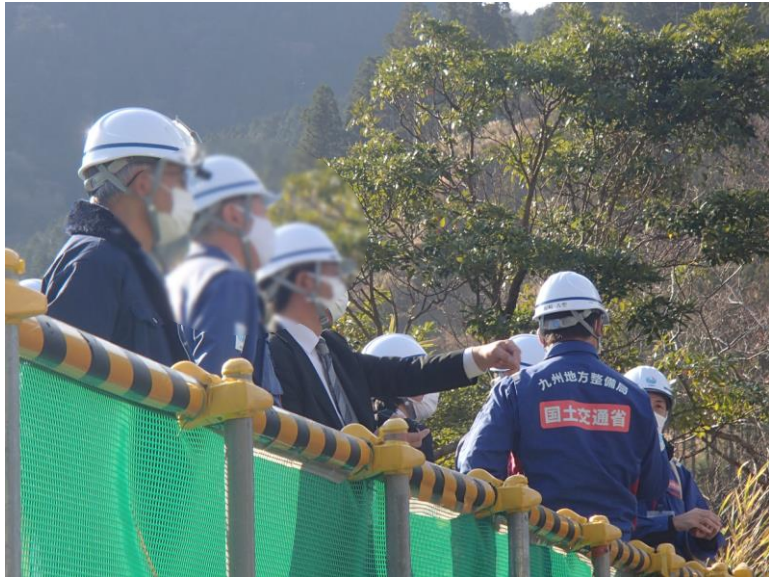
R3.12 流域外自治体首長等現地説明【6名】