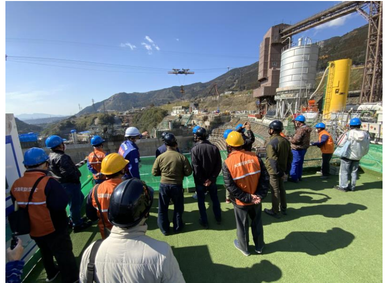
R5.3 大津町防災士現地説明【20名】