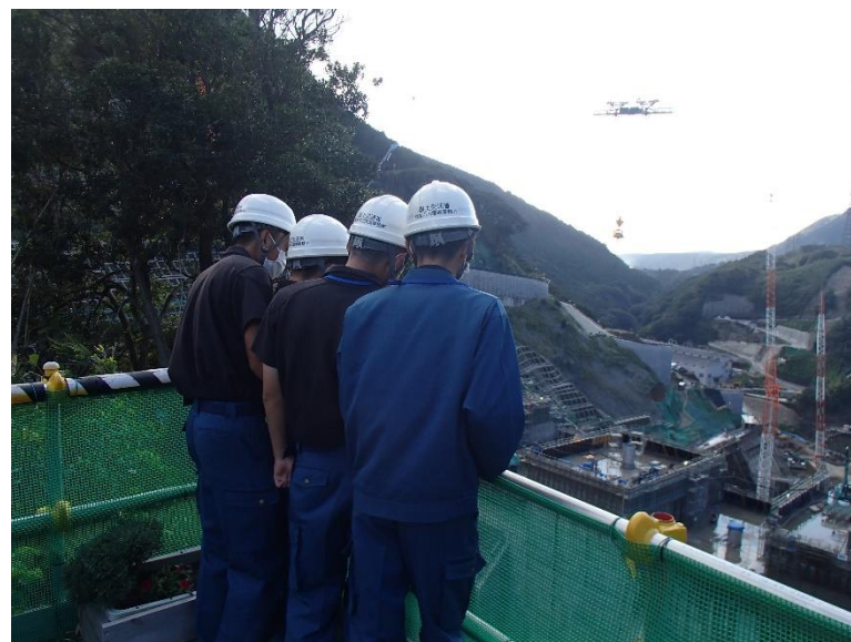
R4.10 高校生現地説明【4名】