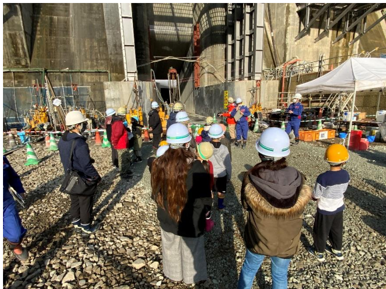
R5.1 立野地区子供会 放流孔お絵かきイベント 【22名】