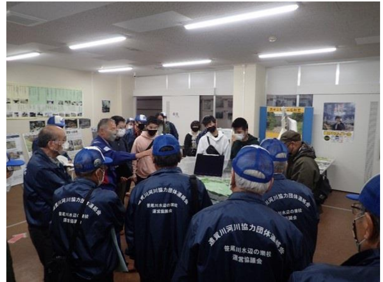
R3.3 流域外自治体住民現地説明【8名】