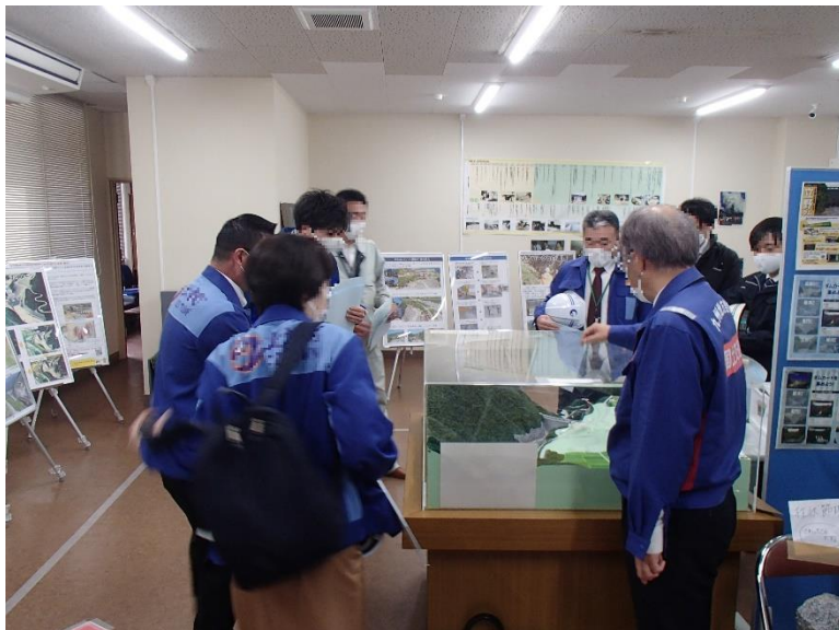
R3.11 大津町、菊陽町職員現地説明【8名】