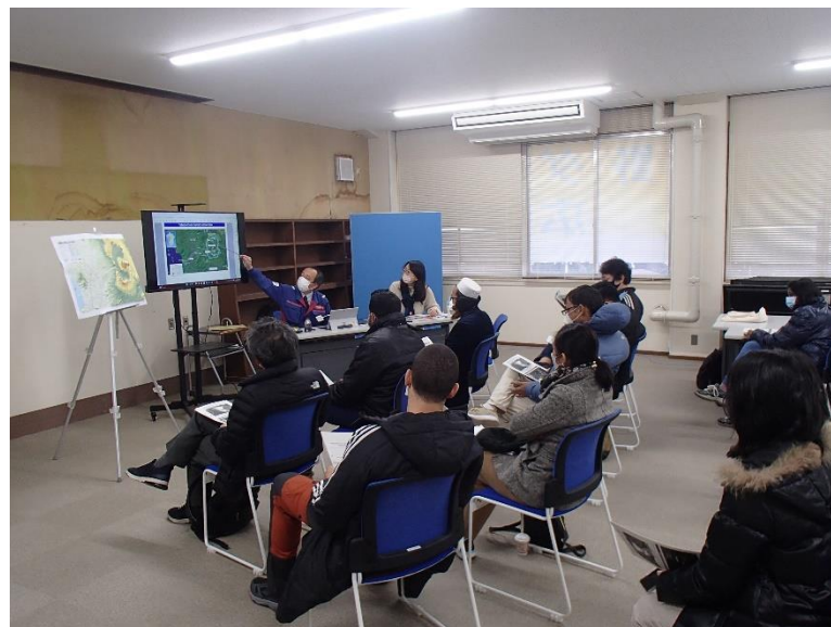
R5.2 JICA防災研修現地説明【11名】