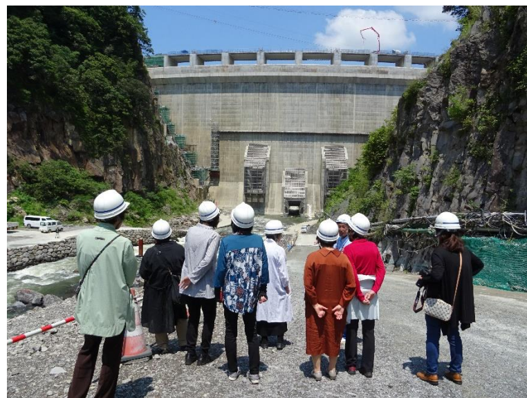
R5.6 一般住民現地説明【10名】