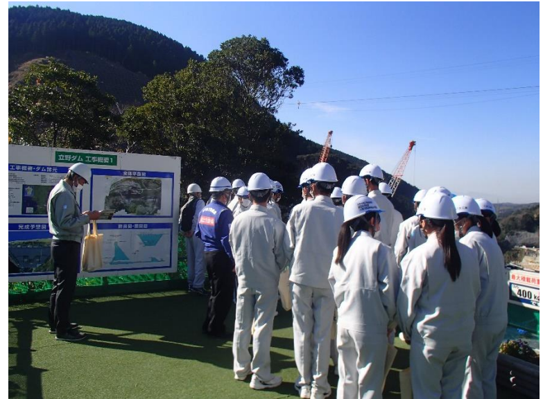
R4. 12 高校生現地説明【43名】