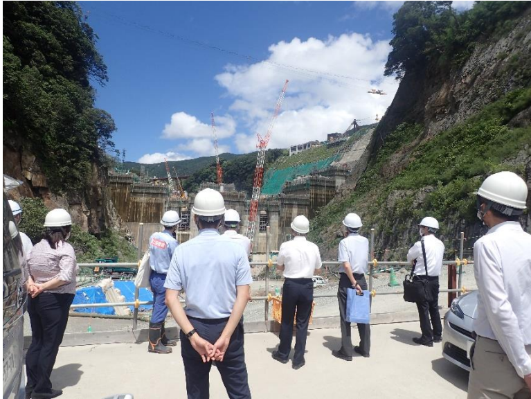
R4.7 熊本県職員現地説明【9名】