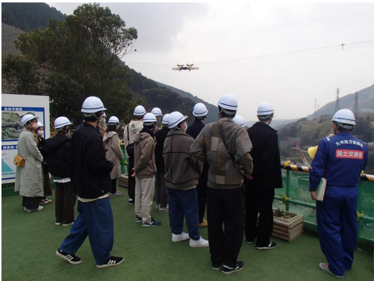
R3.12 大学生現地説明【34名】