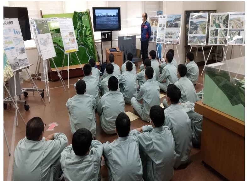
R4.11 高校生現地説明【165名】