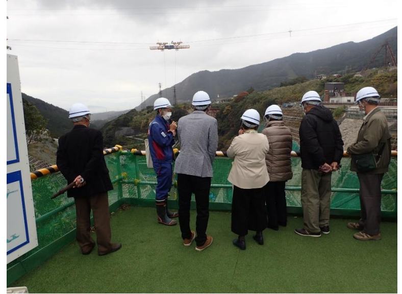
R3.11 行政機関現地説明【11名】