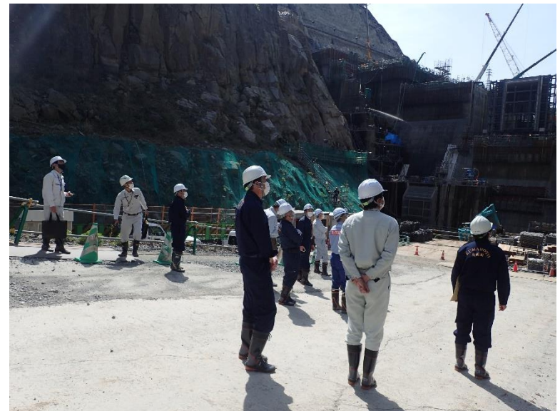
R4.4 菊陽町長、議会議員等現地説明【10名】