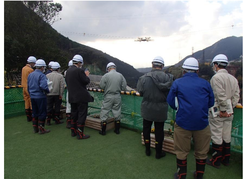
R3.11 一般住民現地説明【13名】