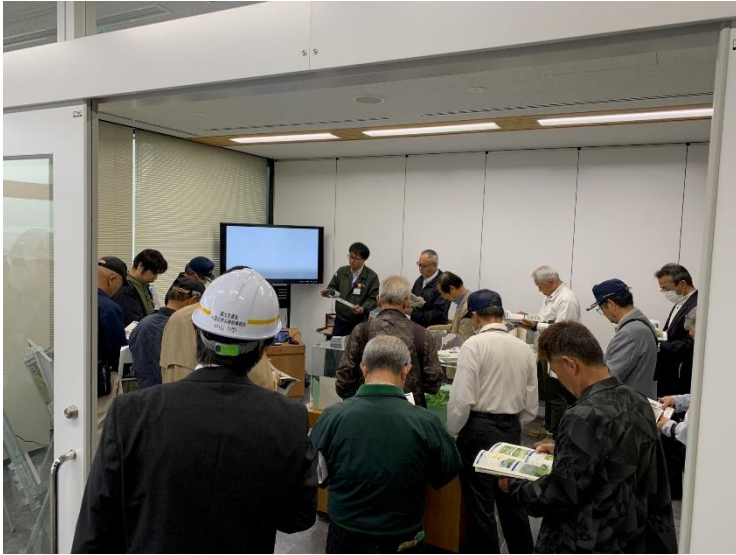
R6.4 一般住民現地説明【15名】