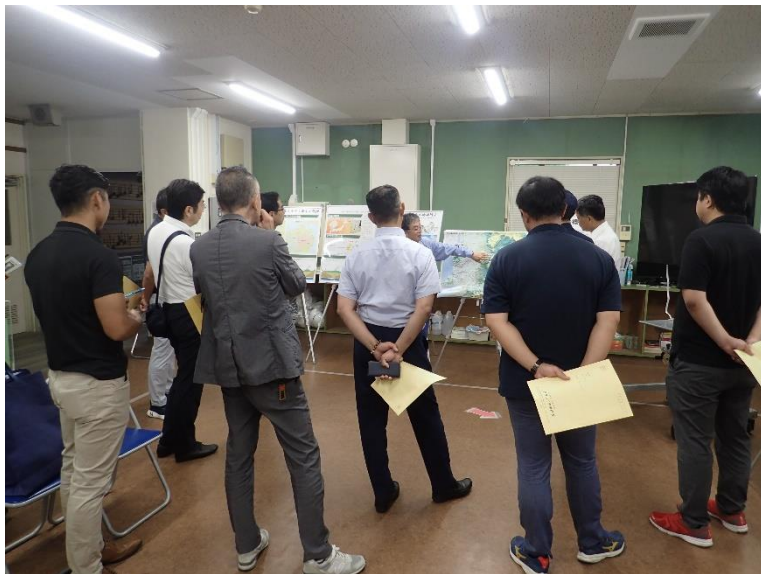
R5.7 熊本自民党市議団現地説明【20名】