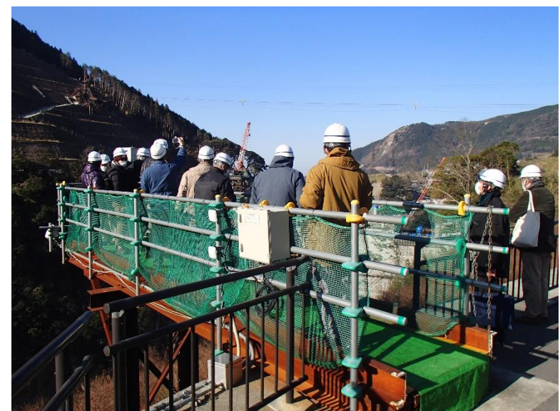
R4.12 日本地学教育学会現地説明 【12名】