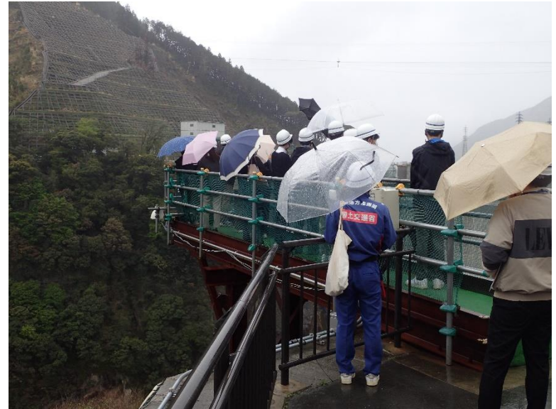
R5.4 熊本県職員現地説明【166名】