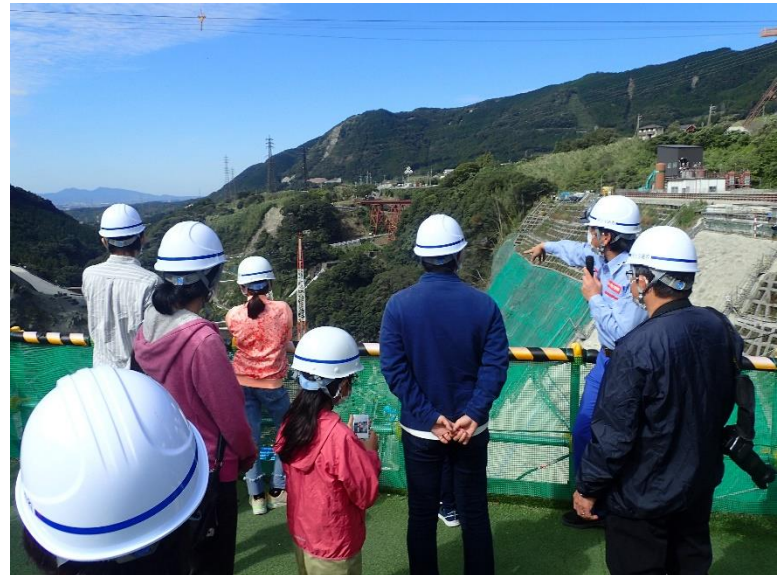
R3.10 一般住民現地説明【8名】