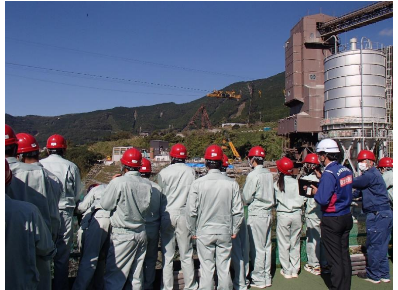
R4.10 高校生現地説明【24名】