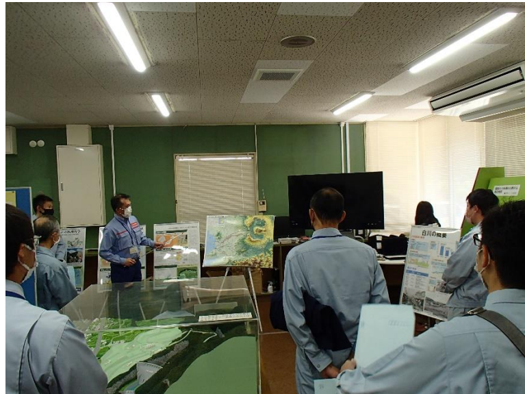
R3.10 行政機関現地説明【18名】