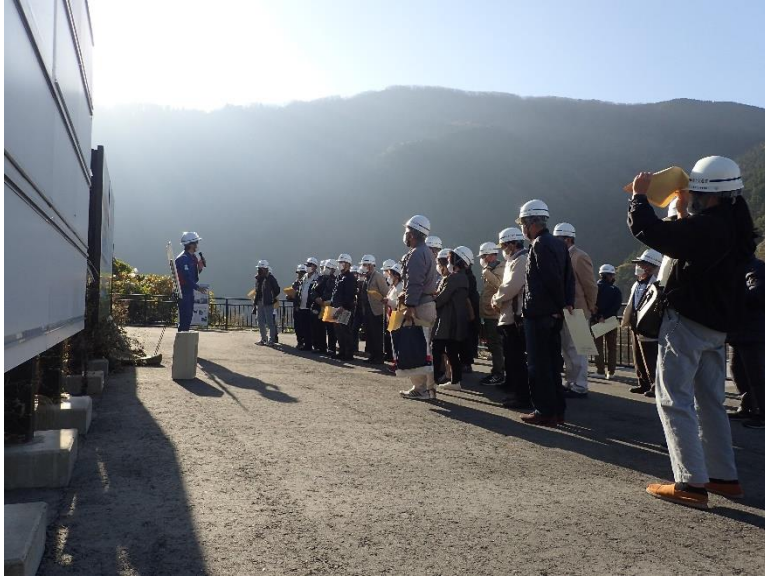
R4.11 熊本市住民現地説明【35名】