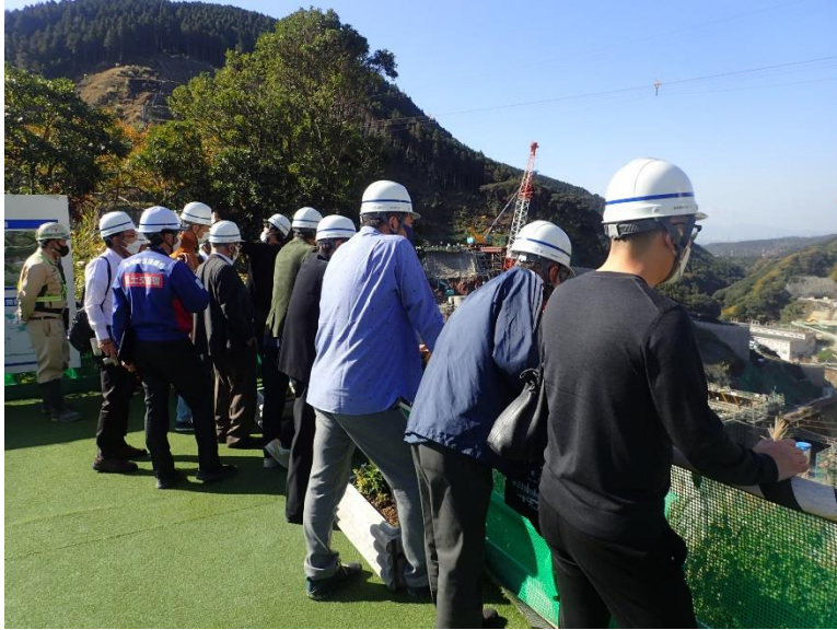
R4.11 一般住民現地説明【11名】