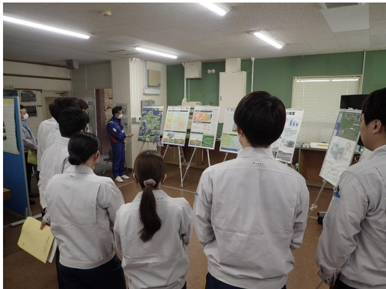
R5.4 九州建設マネジメントセンター新採研修現地説明【18名】