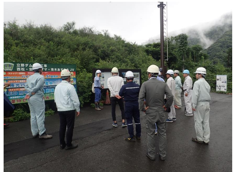
R5.7 宇土市建設業協会現地説明【20名】