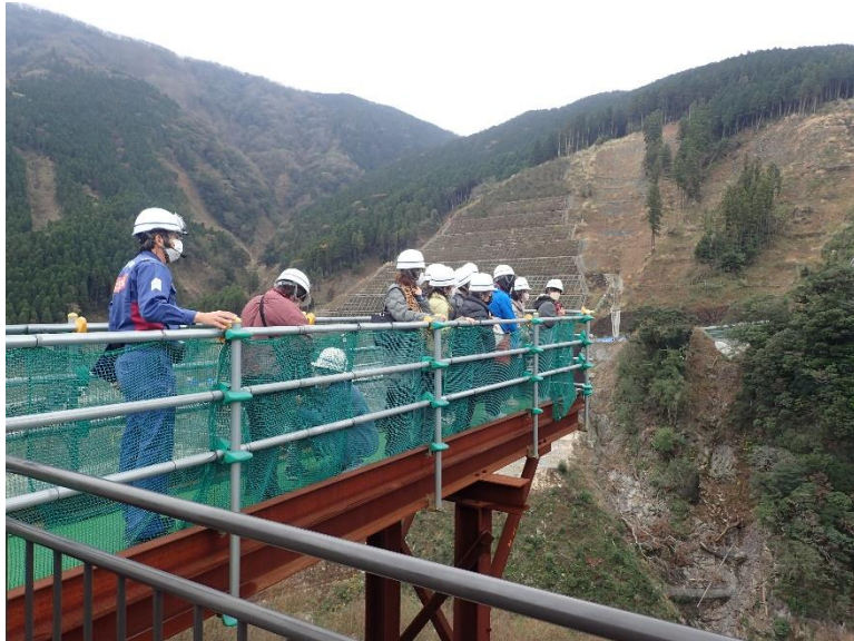
R4.12 大津町内牧地区住民現地説明【13名】