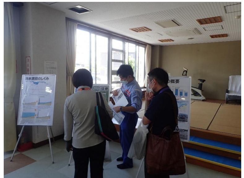
R4.8 熊本市日吉校区水防災体験学習【33名】