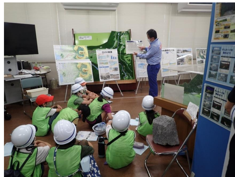
R3.8 一般住民現地説明【58名】