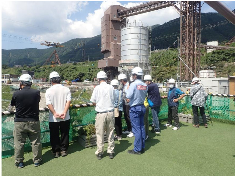
R4.9 一般住民現地説明【11名】