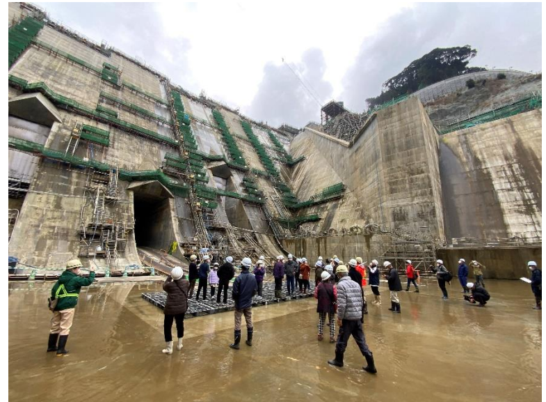
R5.1 一般募集 放流口ウォークイベント 【90名】