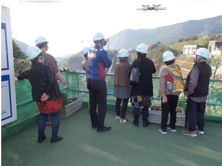
R4.11 熊本市住民現地説明【9名】