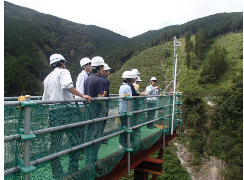
R5.8 大学生現場説明【7名】