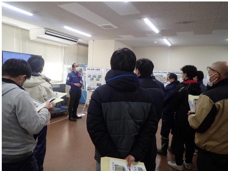
R4.12 熊本県職員現地説明【18名】