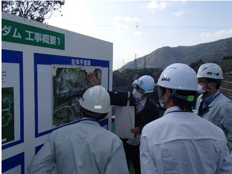
R3.11 菊陽町職員現地説明【4名】