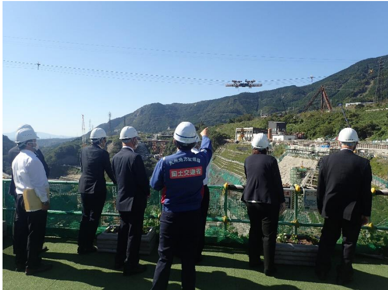
R4.10 流域外自治体議員等現地説明【13名】