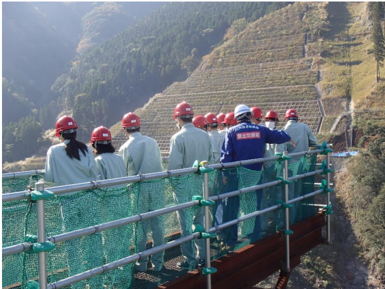
R3.11 高校生現地説明【30名】