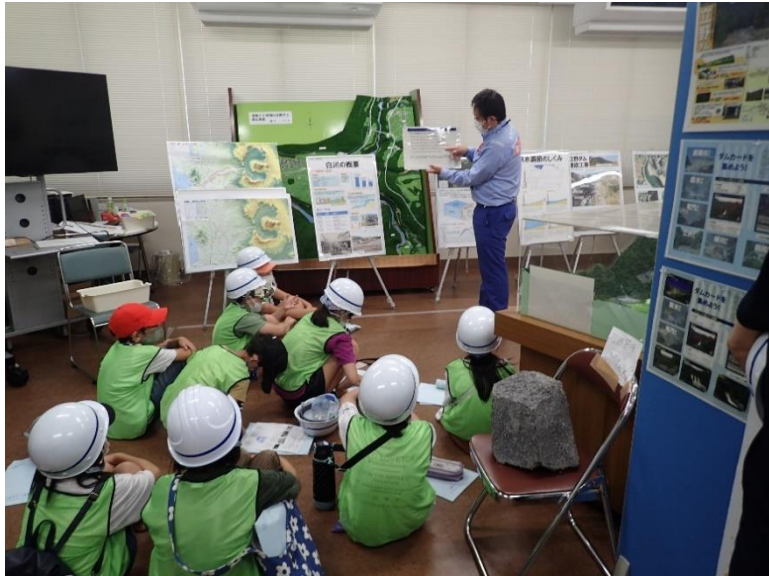
R3.8 一般住民現地説明【58名】