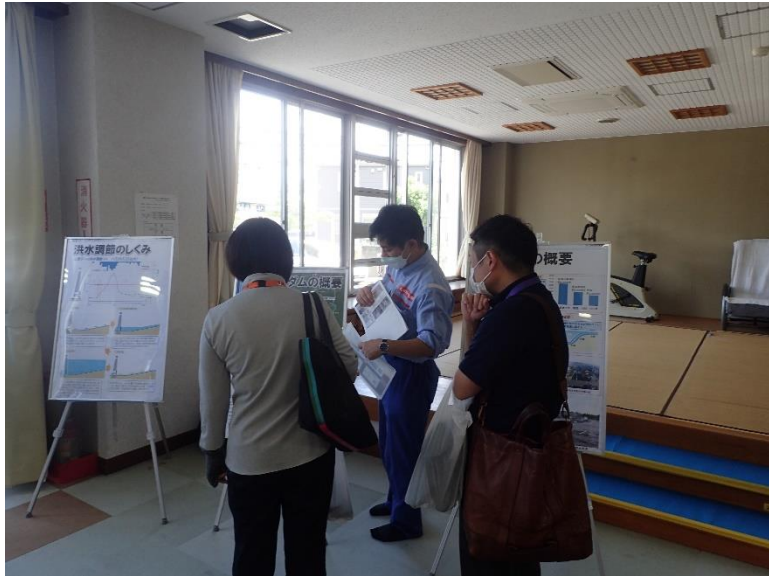
R4.8 熊本市日吉校区水防災体験学習【33名】