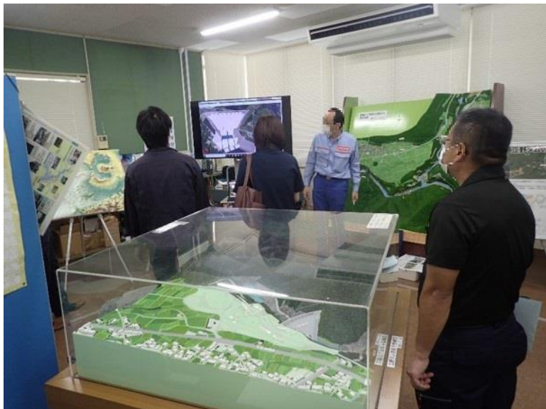
R3.7 行政機関現地説明【12名】