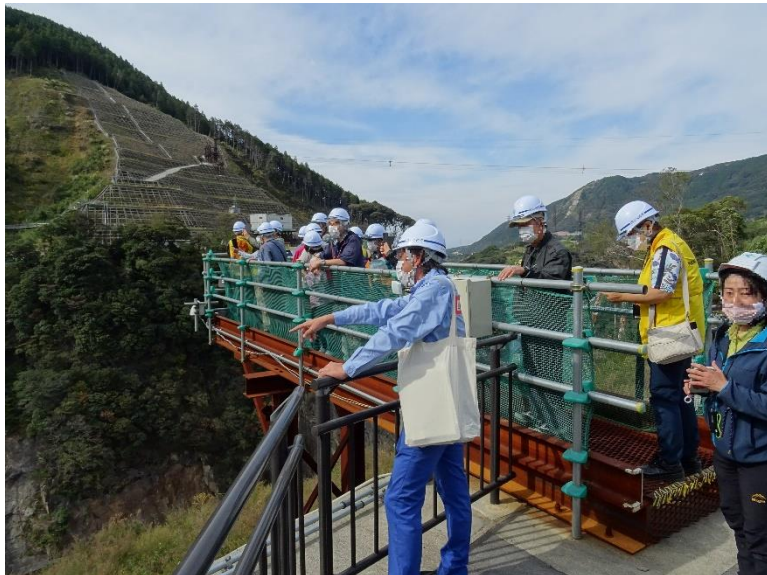
R3.10 一般住民現地説明【18名】