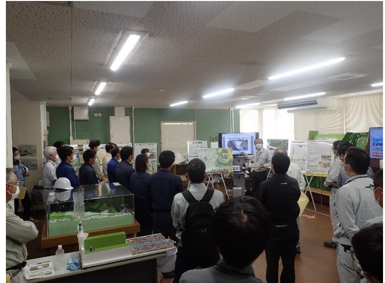
R4.9 熊本県コンクリート診断士会現地説明【35名】