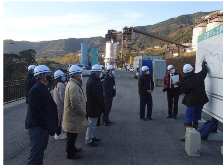
R2. 12 大津町住民現地説明【8名】