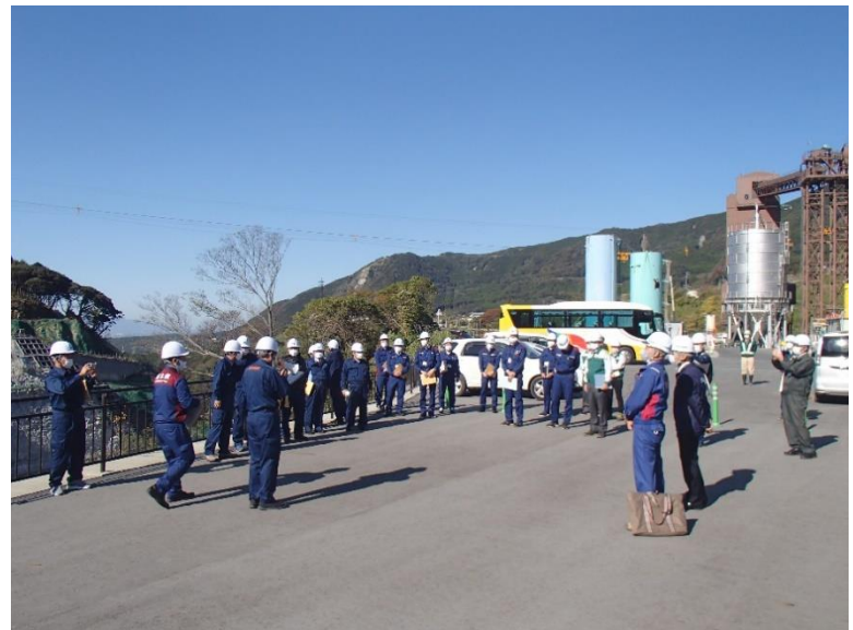
R2.11 熊本県議会議員現地説明【24名】