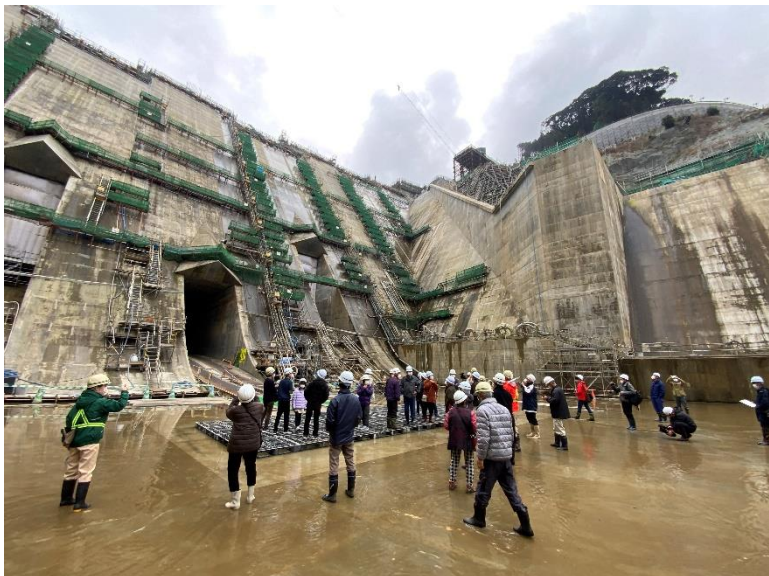
R5.1 一般募集 放流口ウォークイベント【90名】