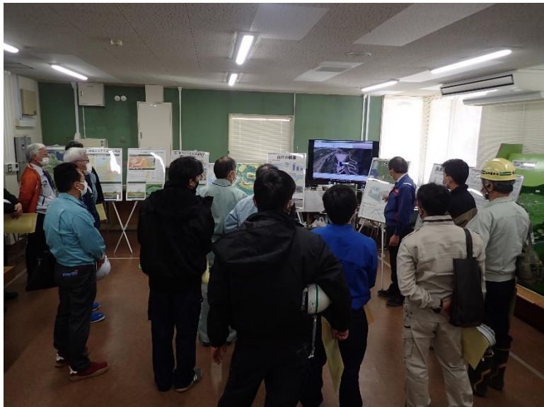
R4.11 熊本県土木施工管理技士会現地説明【16名】