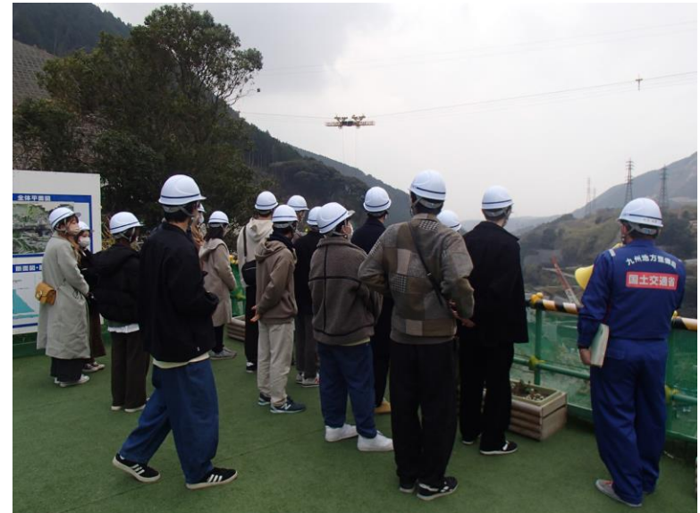
R3.12 大学生現地説明【34名】