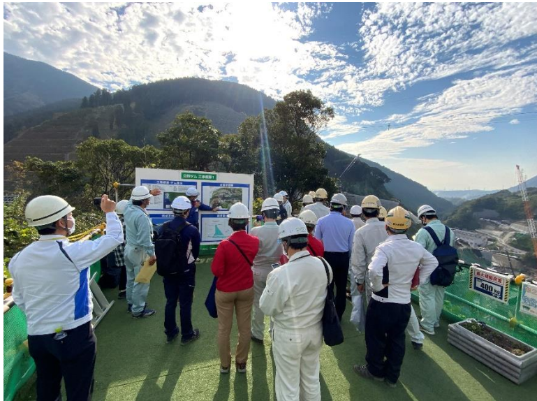
R4.11 日本応用地質学会現地視察【44名】