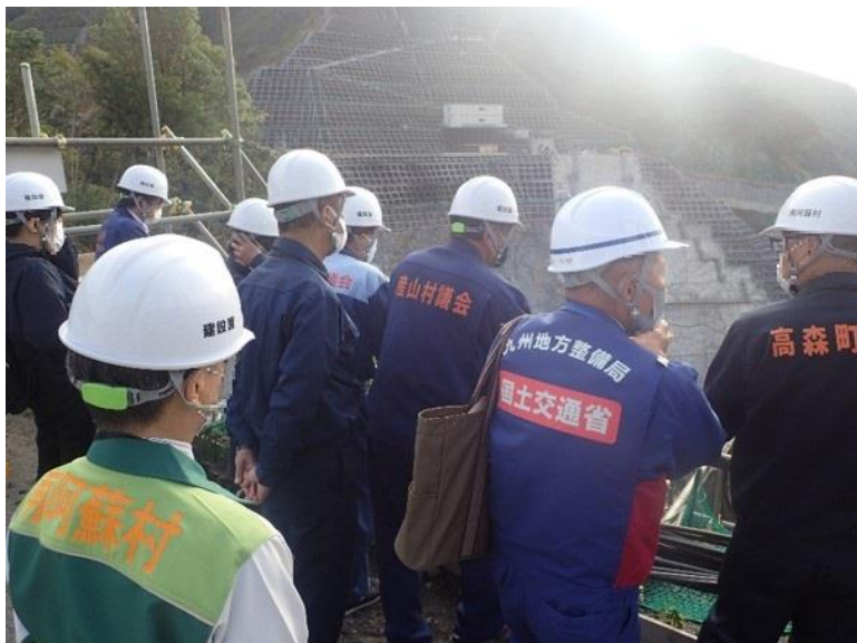
R2.11 阿蘇管内市町村議会議長現地説明【17名】