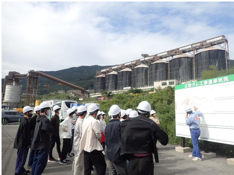
R4.9 大学生現地説明【49名】