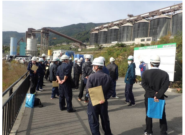
R4.11 九州農政局現地視察【32名】