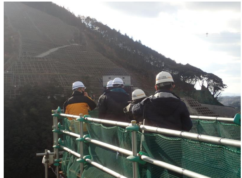
R3.12 小学校教員現地説明【2名】