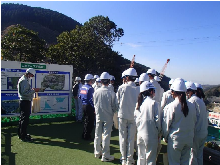
R4.12 高校生現地説明【43名】