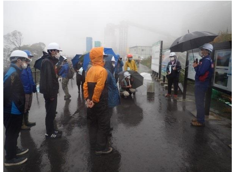
R2.11 南阿蘇村住民現地説明【18名】