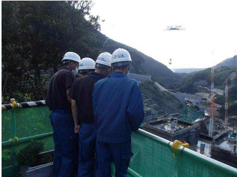
R4.10 高校生現地説明【4名】