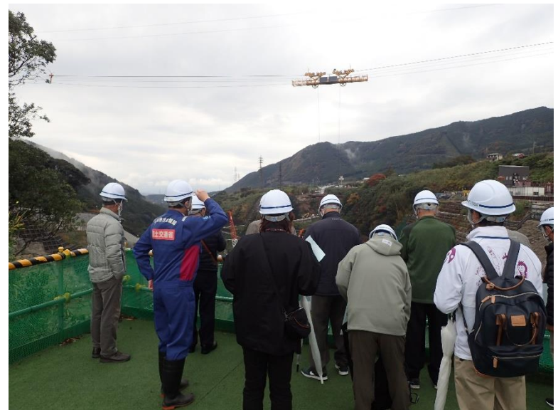
R3.11 一般住民現地説明【13名】