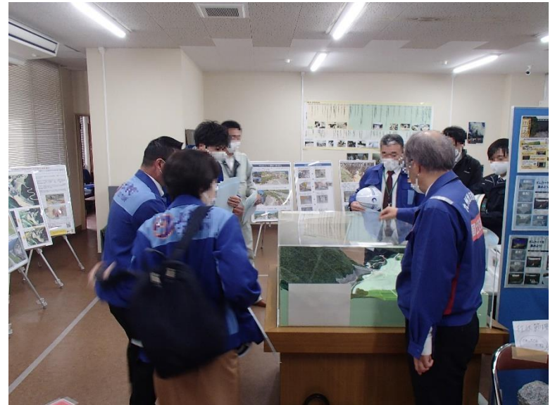
R3.11 大津町、菊陽町職員現地説明【8名】