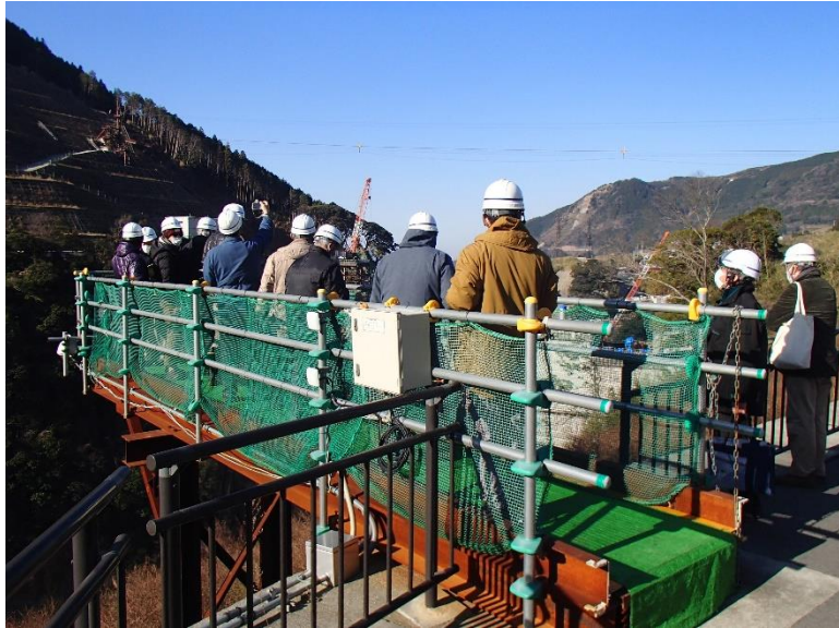
R4.12 日本地学教育学会現地説明【12名】