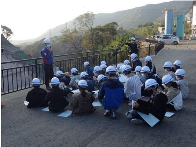
R2.10 中学生現地説明【84名】