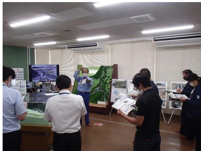
R3.6 行政機関現地説明【14名】