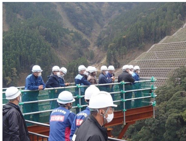
R2.11 行政機関現地説明【22名】