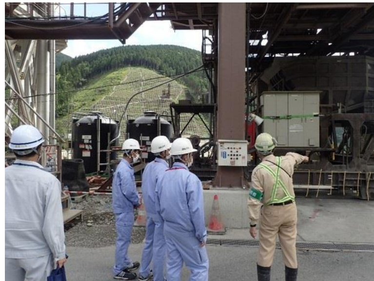
R3.7 高校生現地説明【3名】