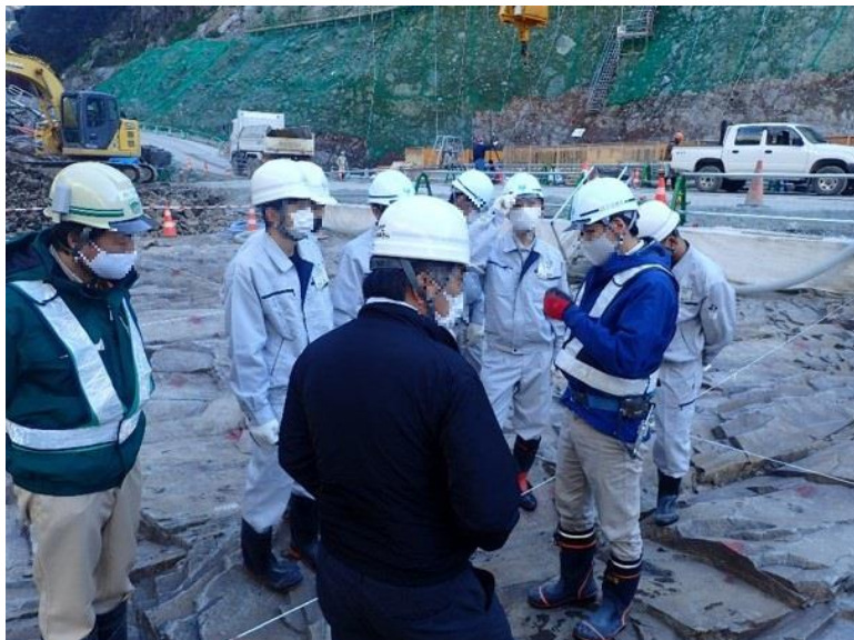
R2.12 高校生現地説明【6名】