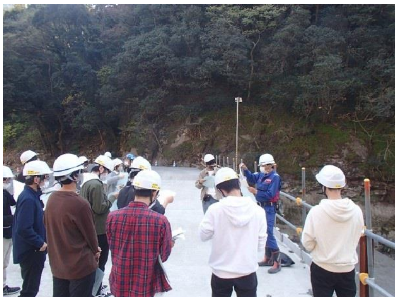
R2.11 大学生現地説明【16名】