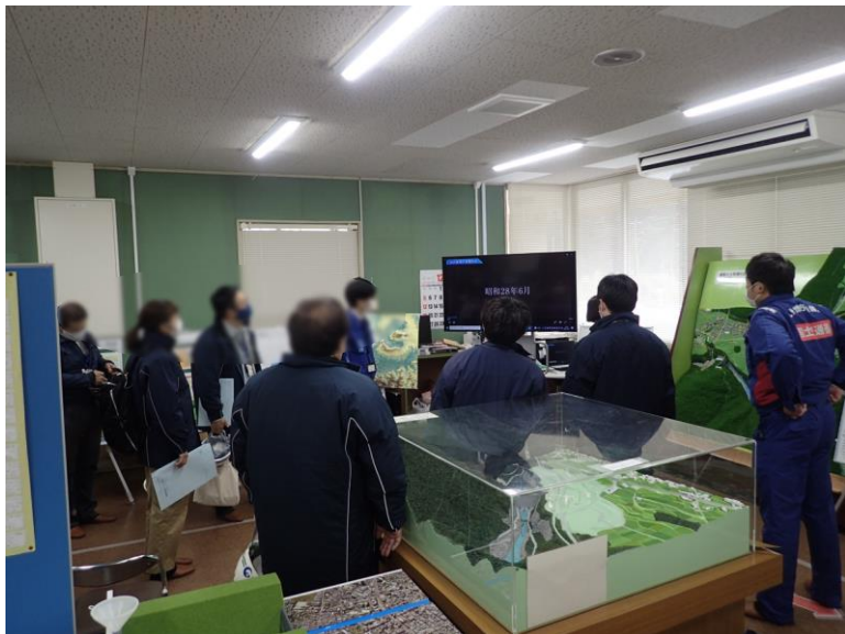
R3.12 大津町職員現地説明【12名】