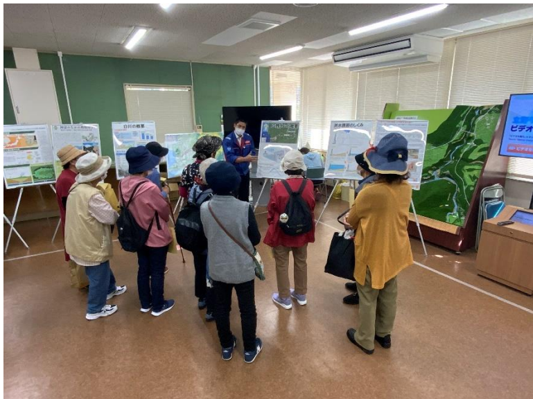
R4.10 熊本市力合地区住民現地説明【12名】