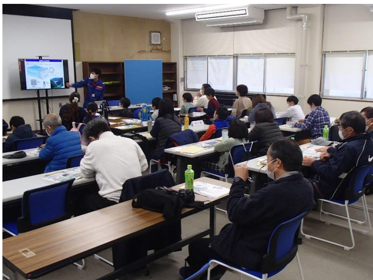
R4.11 白川上下流交流会【26名】