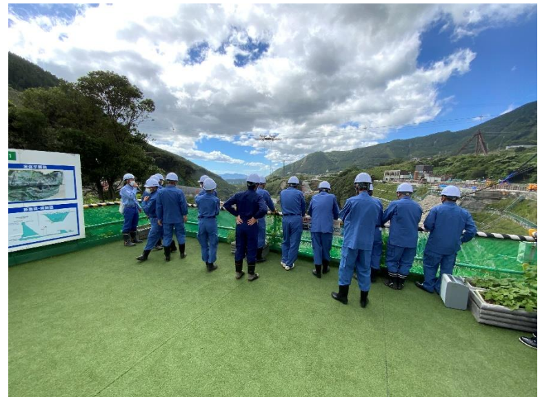
R4.9 南阿蘇村議会議員現地説明【19名】