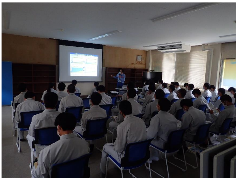
R4.5 高校生現地説明【42名】