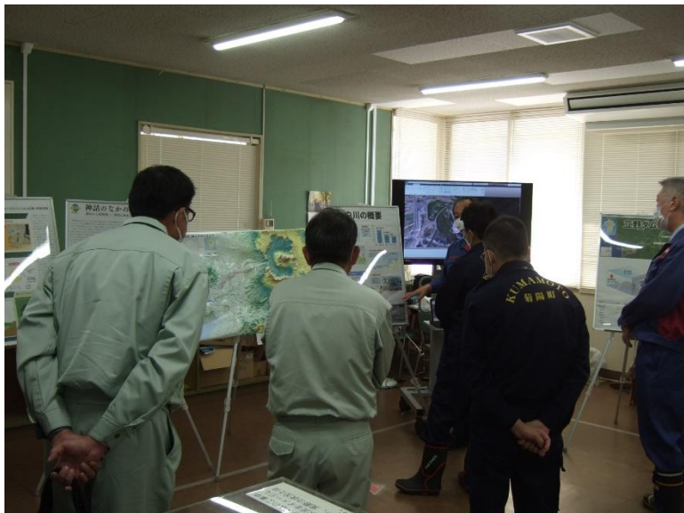
R4.11 菊陽町長・職員現地説明【4名】