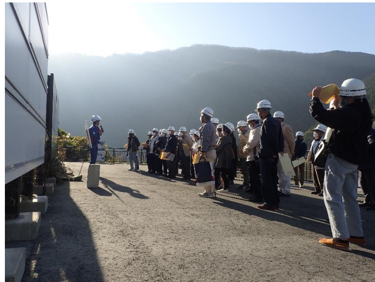
R4.11 熊本市住民現地説明【35名】