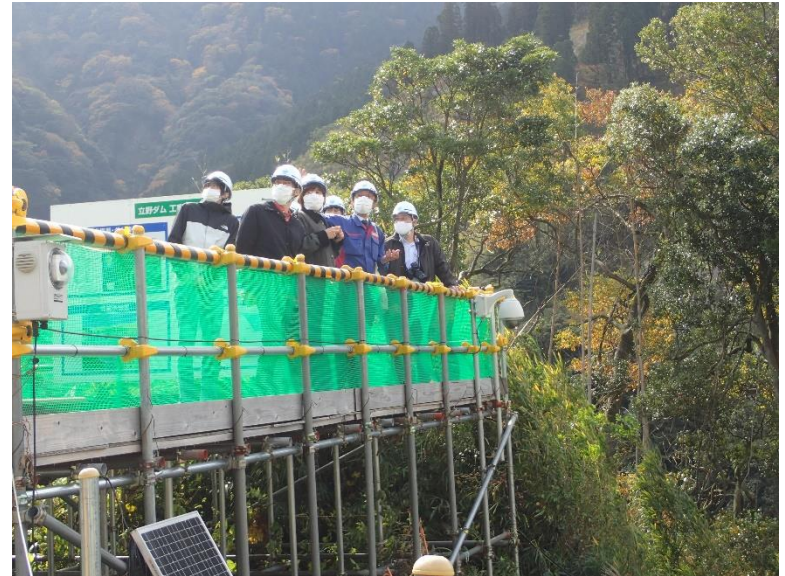
R3.11 大学関係者現地説明【6名】