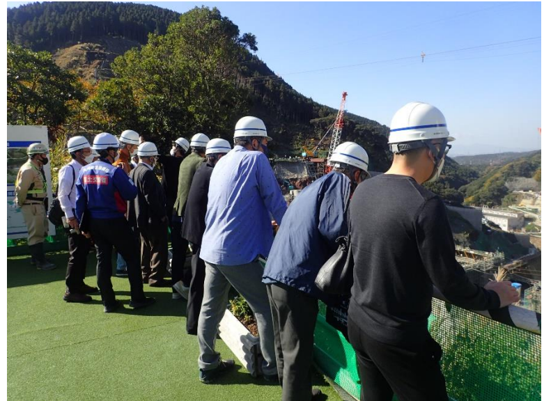
R4.11 一般住民現地説明【11名】