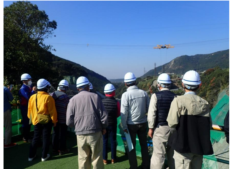
R3.11 一般住民現地説明【17名】