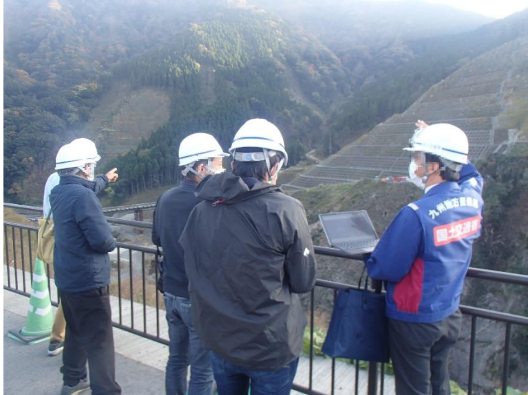
R3.11 一般住民現地説明【5名】