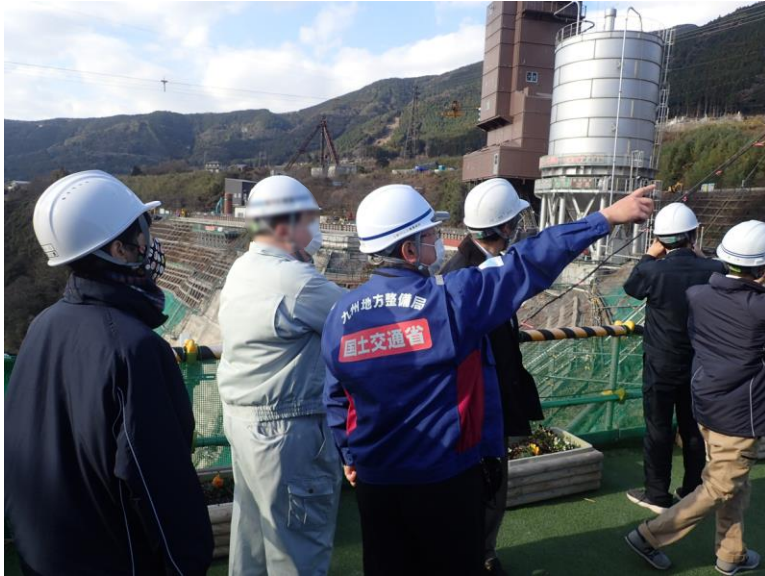
R3.12 大津町職員現地説明【5名】