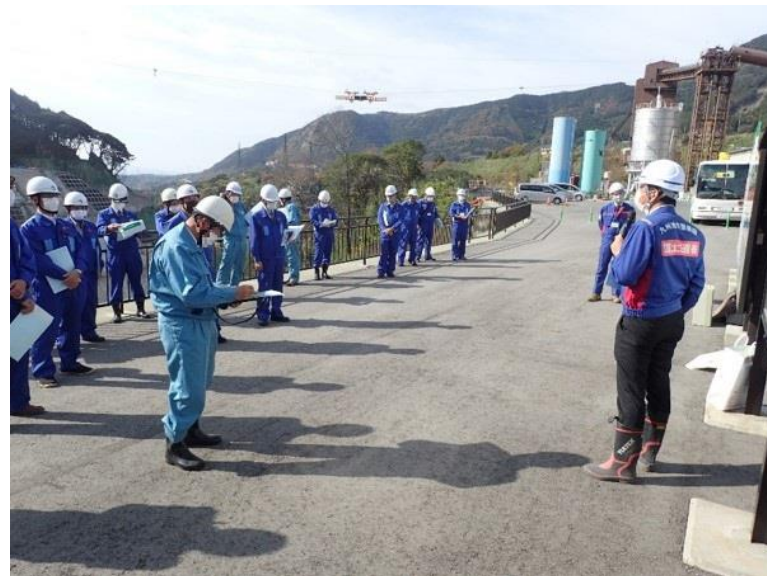
R2.11 大津町議会議員現地説明【20名】