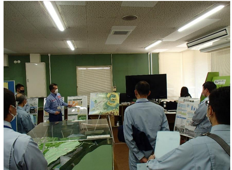
R3.10 行政機関現地説明【18名】