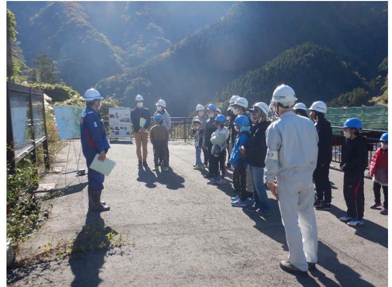
R4.11 土木の日バスツアー【64名】