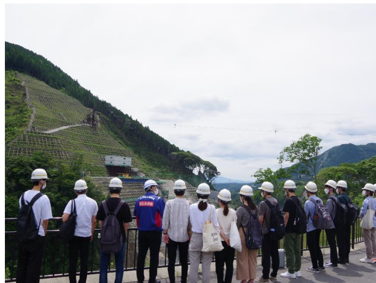
R4.6 大学生現地説明【14名】