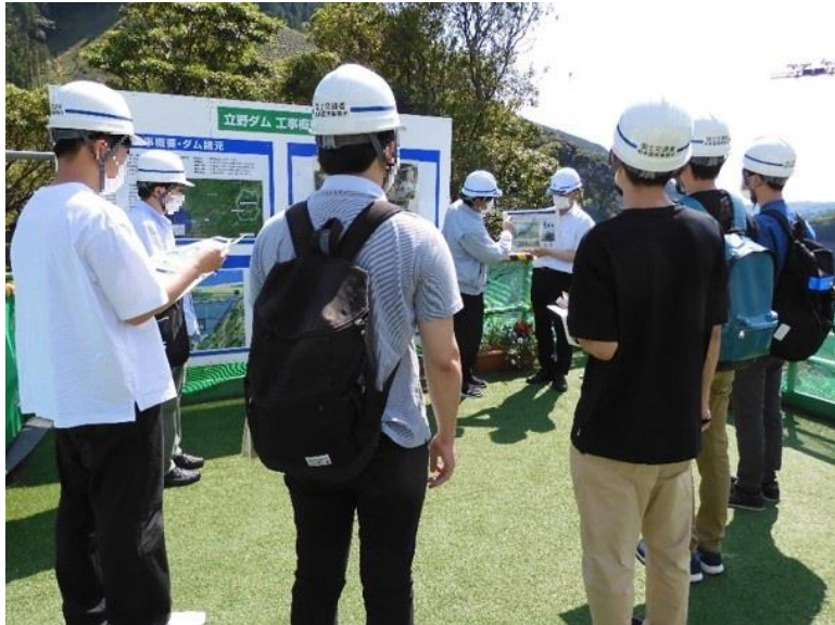
R3.6 大学生現地説明【7名】