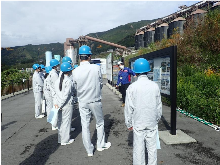
R3.11 高校生現地説明【8名】