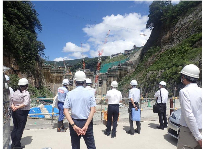
R4.7 熊本県職員現地説明【9名】