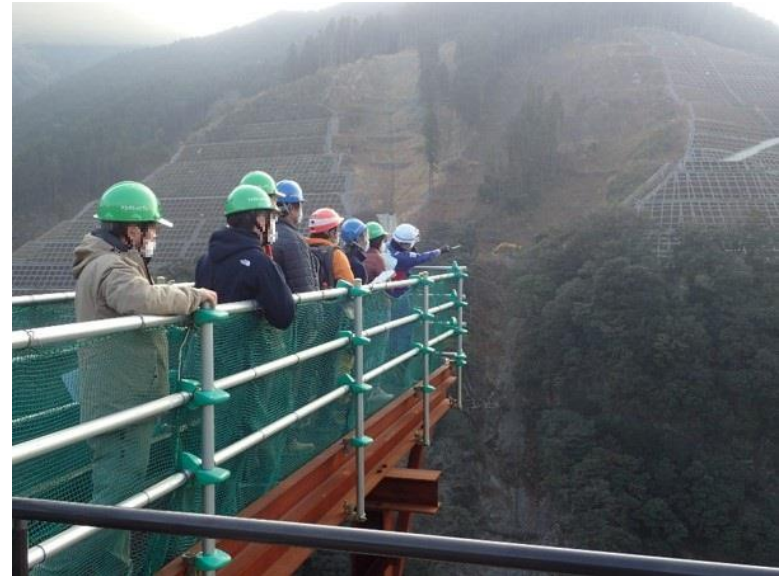
R2. 12 一般住民現地説明【9名】