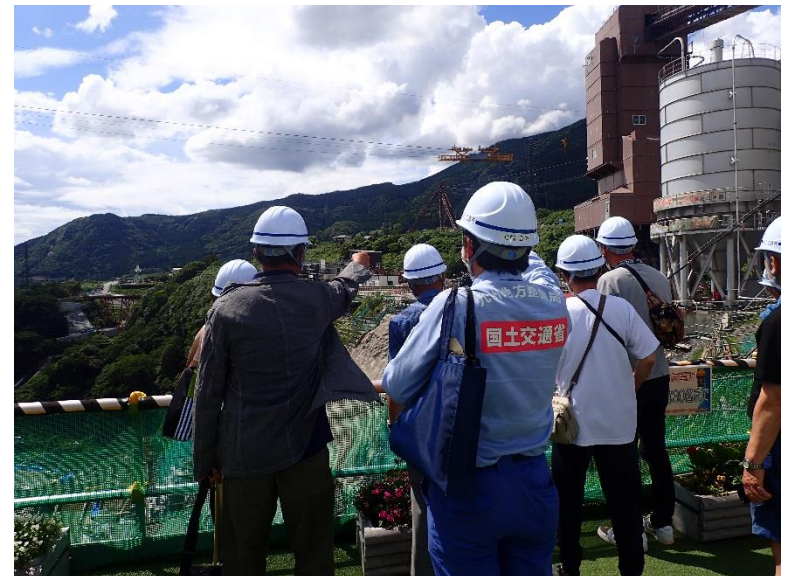
R4.6 熊本市住民現地説明【11名】