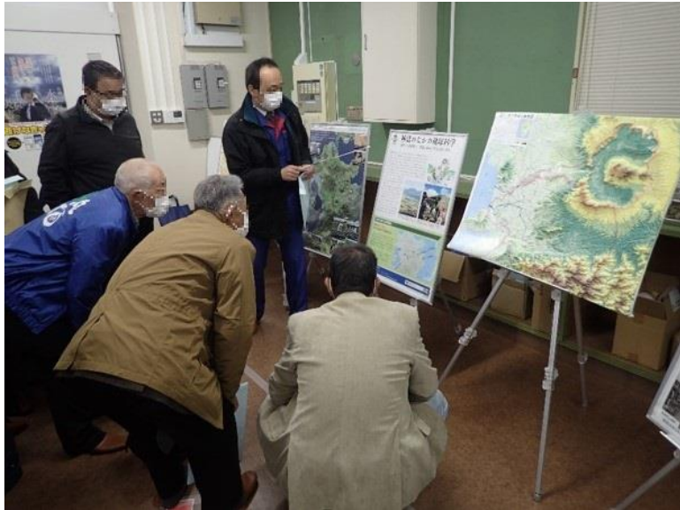
R3. 2 流域外自治体住民現地説明【10名】