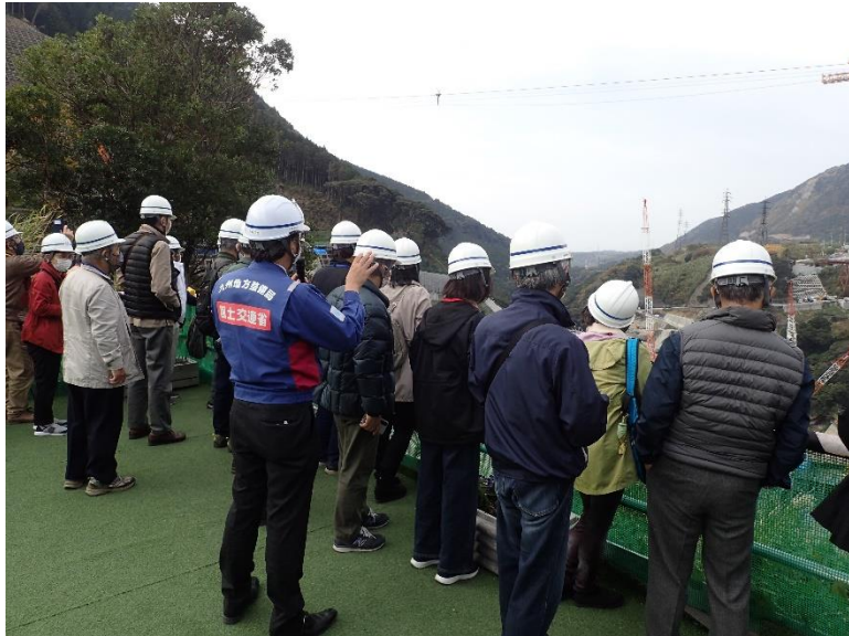
R4.11 熊本市住民現地説明【21名】