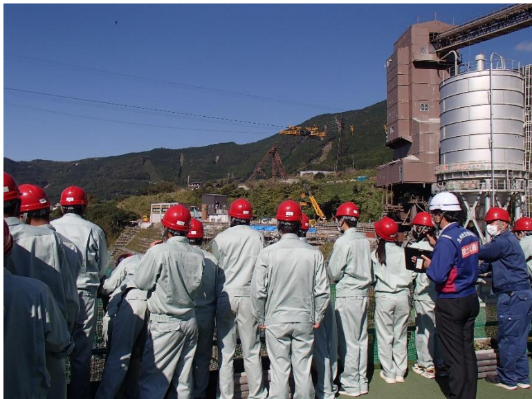
R4.10 高校生現地説明【24名】