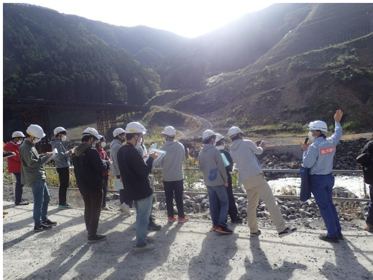
R3.10 大学関係者現地説明【18名】