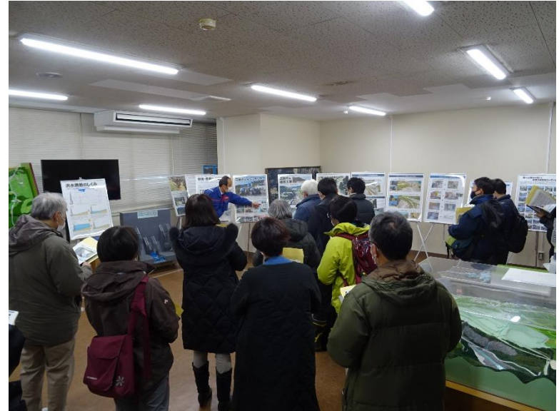
R4.12 熊本県流水型ダムに係る環境影響評価審査会現地説明【18名】