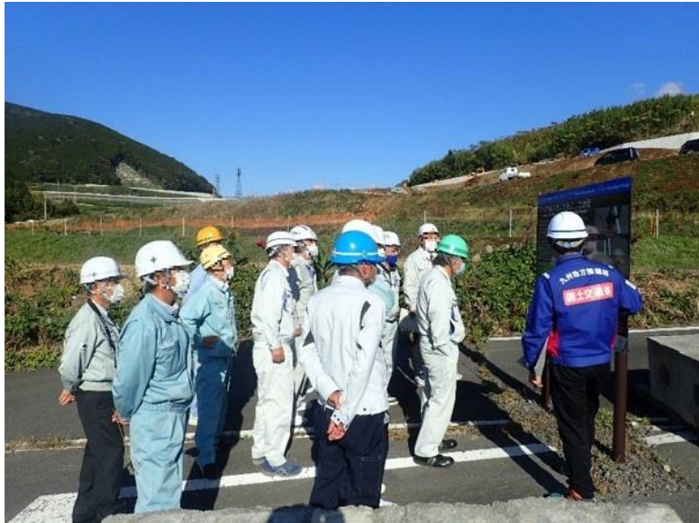
R2.11 土木施工管理技士会現地説明【14名】