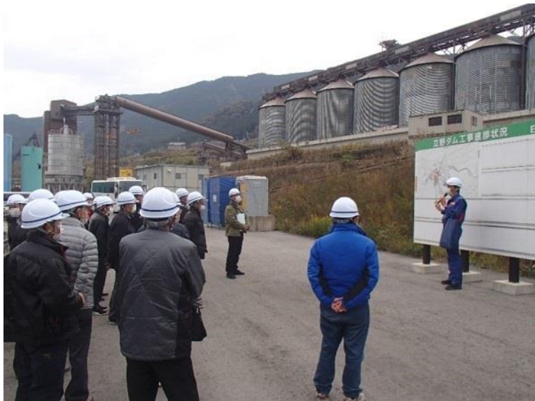
R2. 12 流域外自治体町内会長等現地説明【23名】