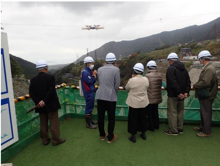
R3.11 行政機関現地説明【11名】