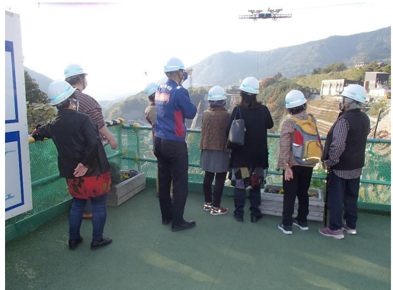
R4.11 熊本市住民現地説明【9名】