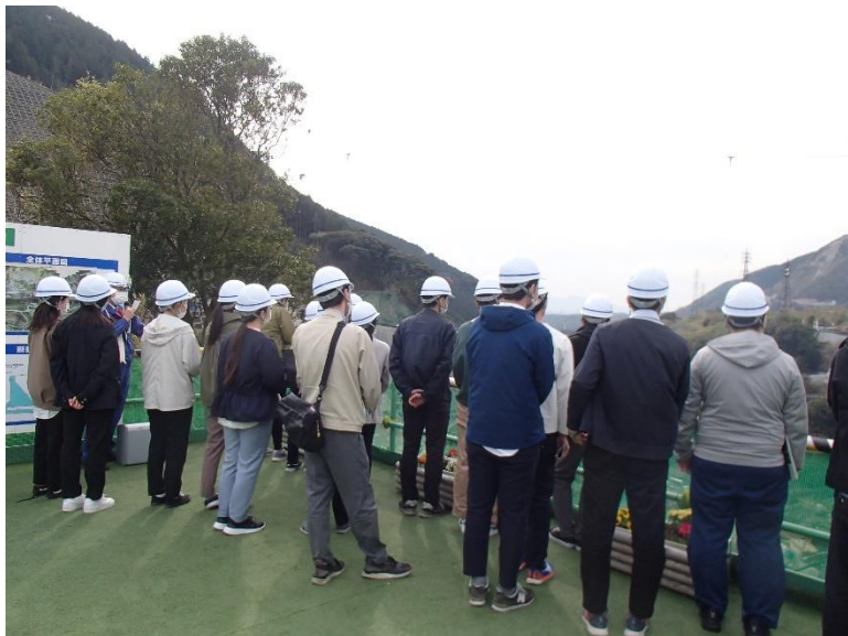
R4.4 熊本県職員現地説明【166名】