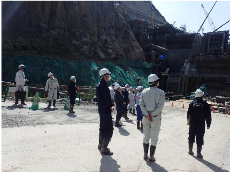
R4.4 菊陽町長、議会議員等現地説明【10名】