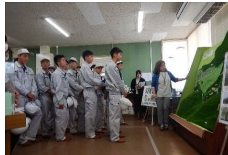
あそ立野ダム広報室見学