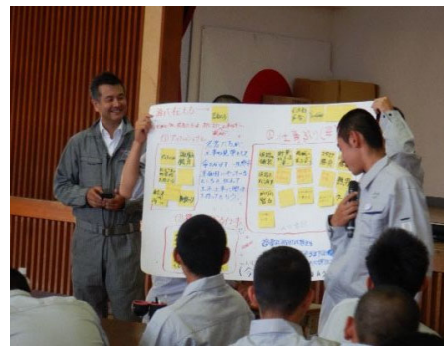
デミーとマツさんから「土木の価値」をテーマに講義。その後、土木広報のあり方について高校生らがグループ討議・発表を行いました。