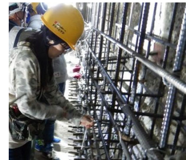
土木の作業を体験 (鉄筋組み立て体験)