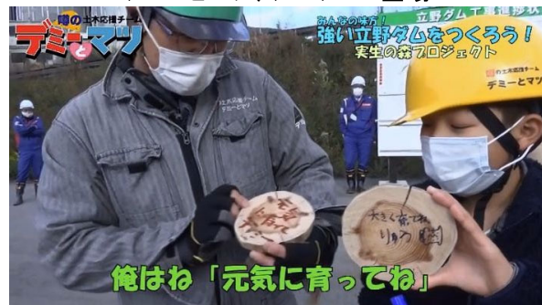
苗木にメッセージを込めて