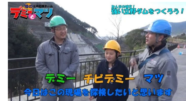
デミーとマツ、チビデミー登場