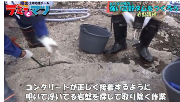
ダムの作り方をレクチャー