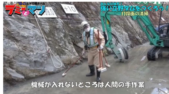
珍しい機械や手作業で行っているところを紹介