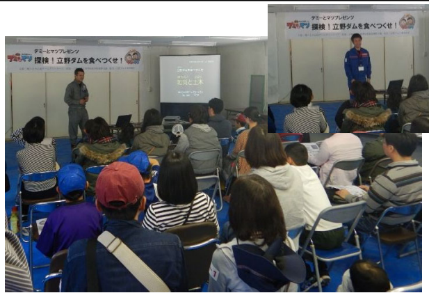
学ぶ(土木や立野ダムについての説明)