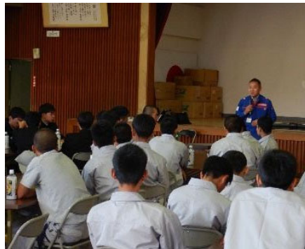
地元の語り部、建設業協会青年部、立野ダム工事事務所長から建設業に関する講話