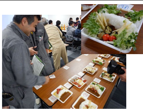
食べる(ダムカレーコンテスト)