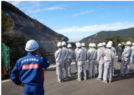
立野ダム本体工事現場見学