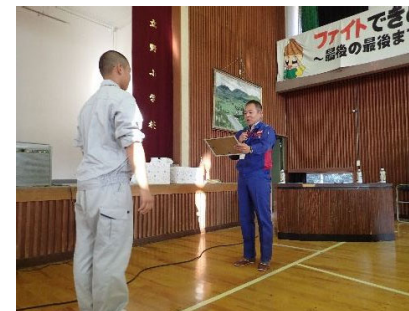
学習したダムの知識でダムカレーを製作。優れた技術は表彰されました。

アンケートでは、「土木がかっこいい・役に立つイメージだと分かった」「自分も仕事してみたいと思った」という回答がありました。