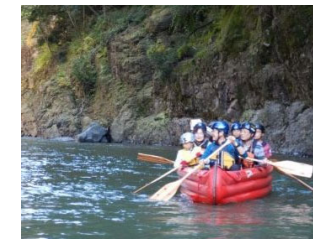
立野峡谷の自然を体感