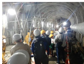
リムトンネル見学