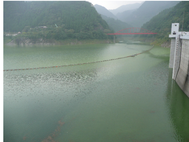
『ダム堤体右岸より望む』