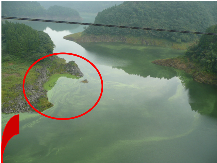
『池の山橋より下流を望む』