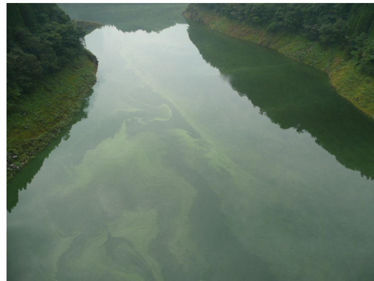
『池の山橋より上流を望む』