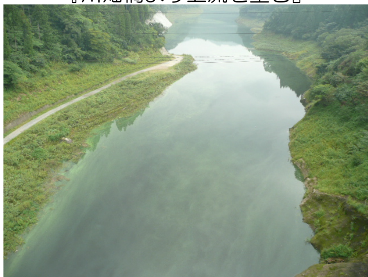
『川畑橋より下流を望む』