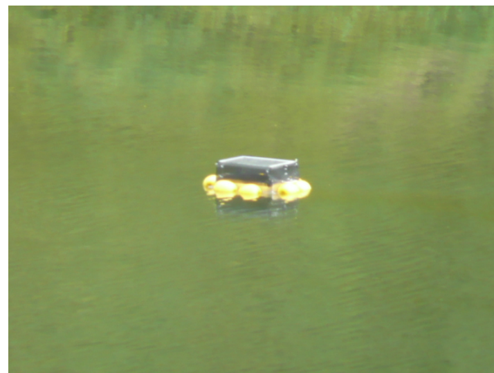
『簡易攪拌装置の状況』