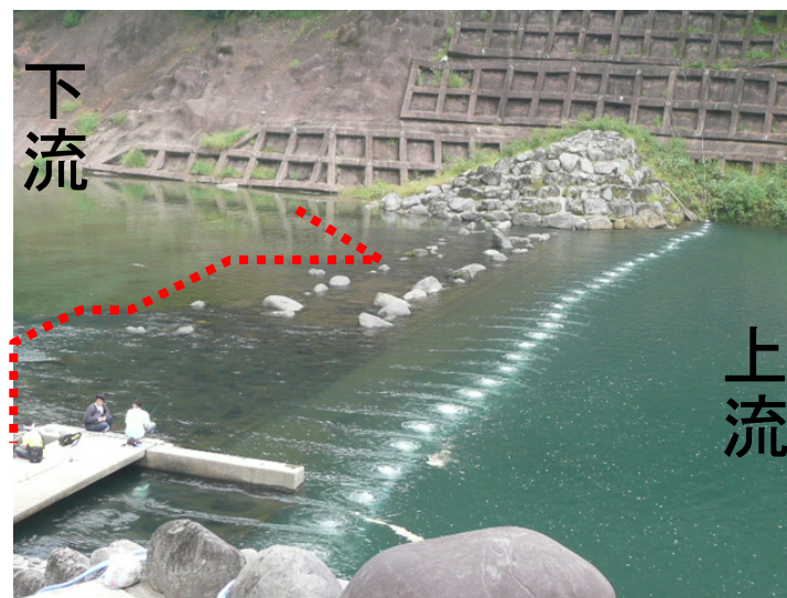
『津江堰に設置したエアカーテンの状況』