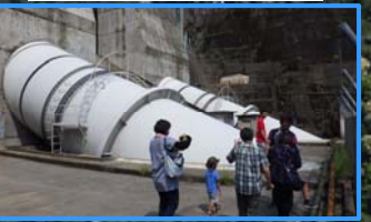
こんな間近で見れます！