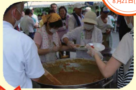
※過去に実施した宮人川ビオトープイベント時の昼食会の様子