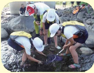
※H29水環境改善キャンペーンin山崎小学校の様子