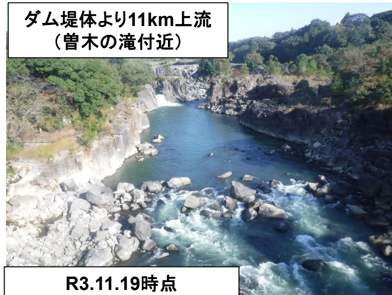
ダム堤体より11km上流 (曾木の滝付近)