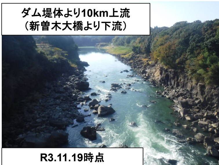
ダム堤体より10km上流 (新曾木大橋より下流)