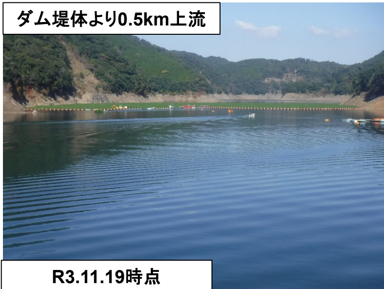
ダム堤体より0.5km上流