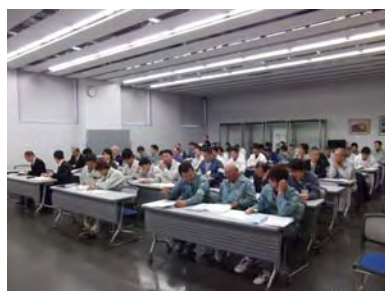
熱心に聞き入る安対連会員