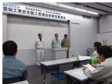
「砂防関係現場代理人の会」事務局より挨拶