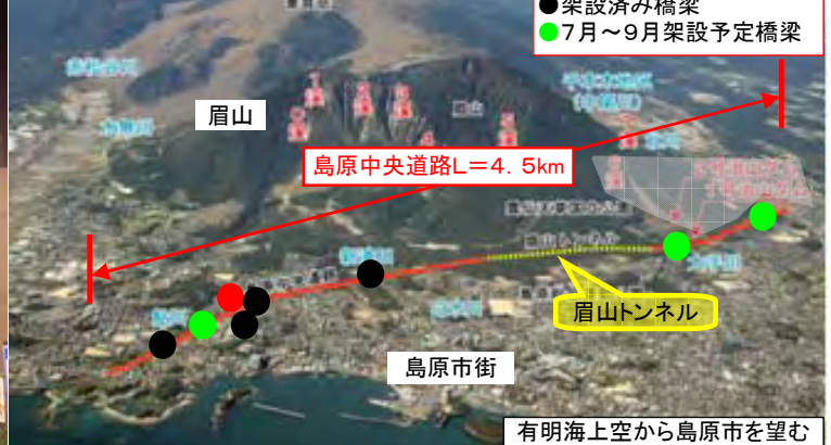
有明海上空から島原市を望む