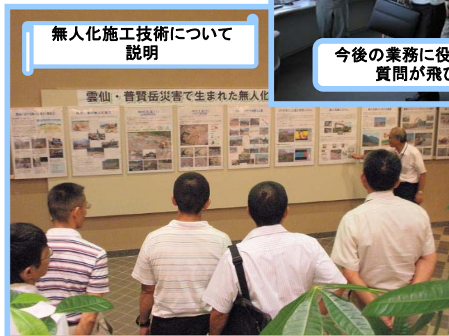
無人化施工技術について説明