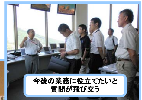
今後の業務に役立てたいと質問が飛び交う