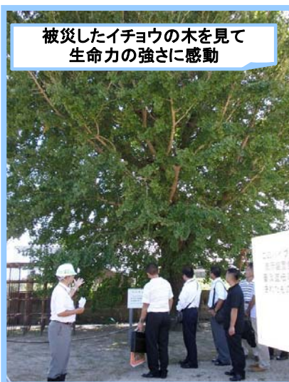
被災したイチョウの木を見て生命力の強さに感動