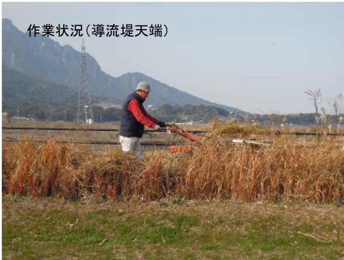
作業状況(導流堤天端)