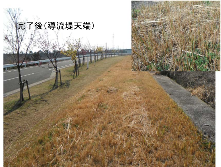
完了後(導流堤天端)