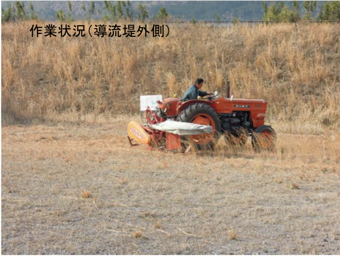
作業状況(導流堤外側)