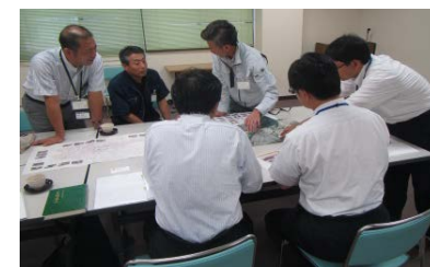
渇水について語る地元関係者