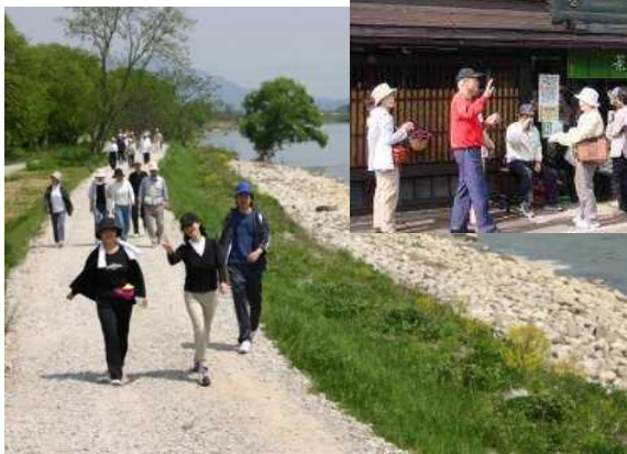
管理用通路をフットパスとして活用 (最上川)