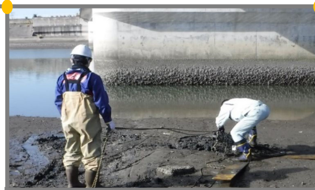
中津出張所スタッフによる 不法投棄自転車の引き上げ作業