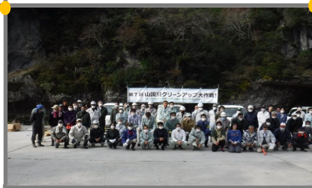
河川協力団体主催による 河川清掃