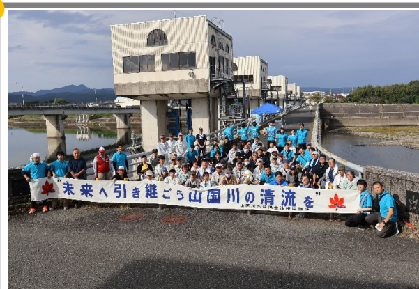
「山国川の日」一斉清掃