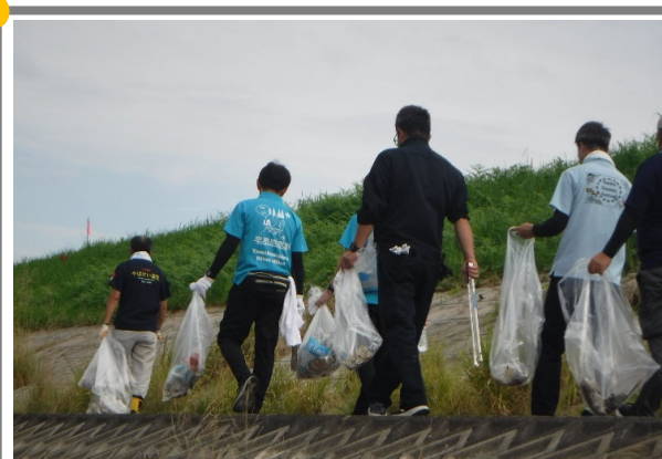
ボランティアの方と清掃作業