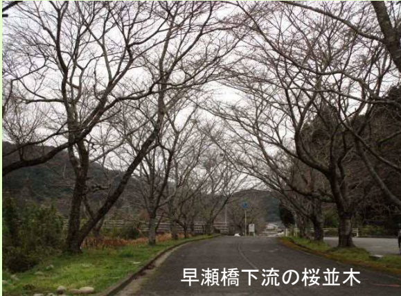
早瀬橋下流の桜並木