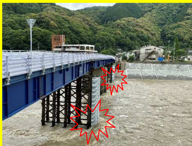
仮橋に河川流入物等が接触