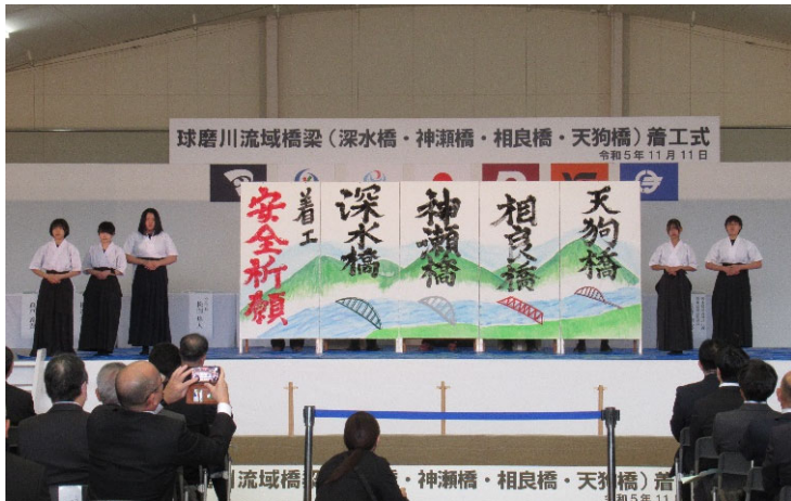
▲ 書道パフォーマンス後の様子

11月11日(土)に球磨川流域桥梁(深水橋・神瀬橋・相良橋・天狗橋)着工式を行いました。