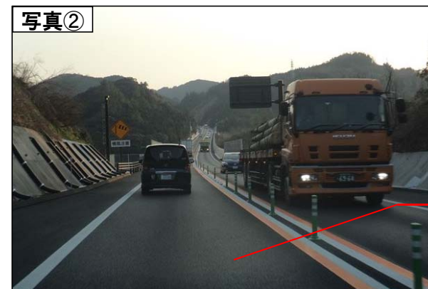
南九州西回り自動車道