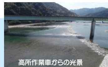
高所作業車からの光景