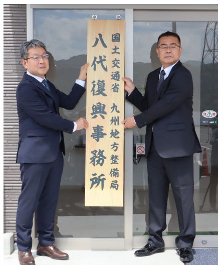
◇九州地方整備局長と八代復興事務所長による看板設置