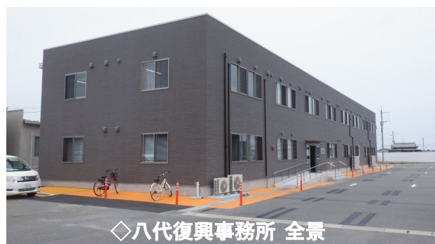
◇八代復興事務所 全景