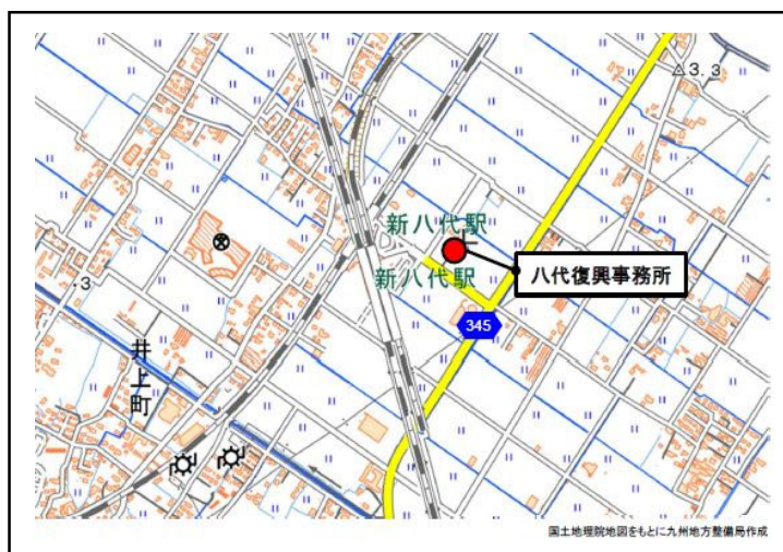
◇八代復興事務所の所在地