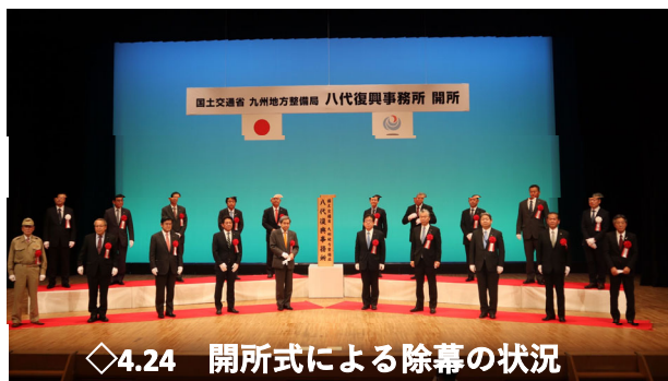
◇4.24 開所式による除幕の状況

また、道路事業については、球磨川を渡河していた橋梁10橋を含む球磨川沿い両岸道路約100km(国道219号、主要地方道人吉水俣線等)を権限代行による災害復旧を行います。