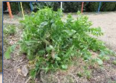
3ヶ月で立派な大根が収穫できた。