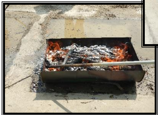
④ 炎が小さくなり炭化が完了した状態