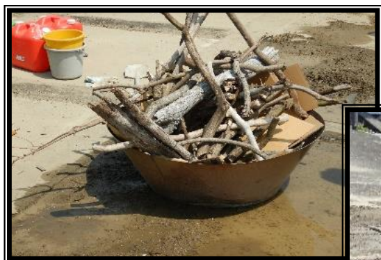
① 剪定くずに段ボールを入れて着火