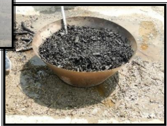
⑤ 水をかける。おおよそ30分くらいで完成