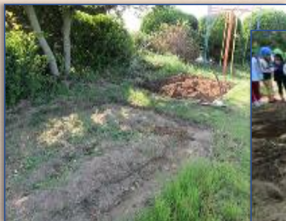
荒れた園庭の芝をはがして耕した。

7月保育園庭の芝をはがして耕し、草ロール2個、米ぬか15キロを土に混ぜ、途中2回耕しました。10月に、大根、玉ねぎ、ジャガイモ、二十日大根の植付をし、3ヶ月で立派な大根収穫ができました。