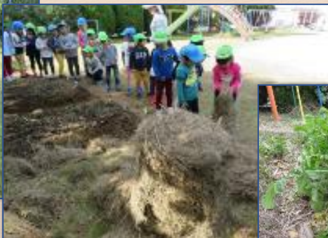
草ロール2個、米ぬか15キロを 土に混ぜた。途中2回耕した。