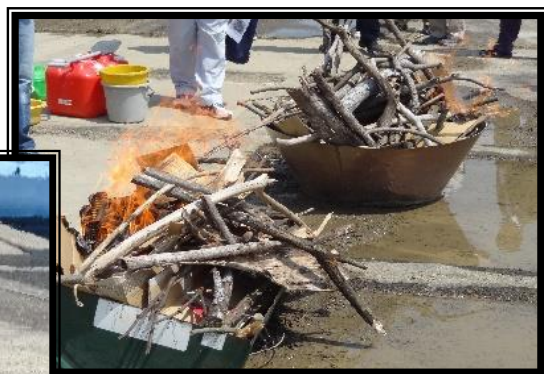
② 全体に剪定くずを入れる