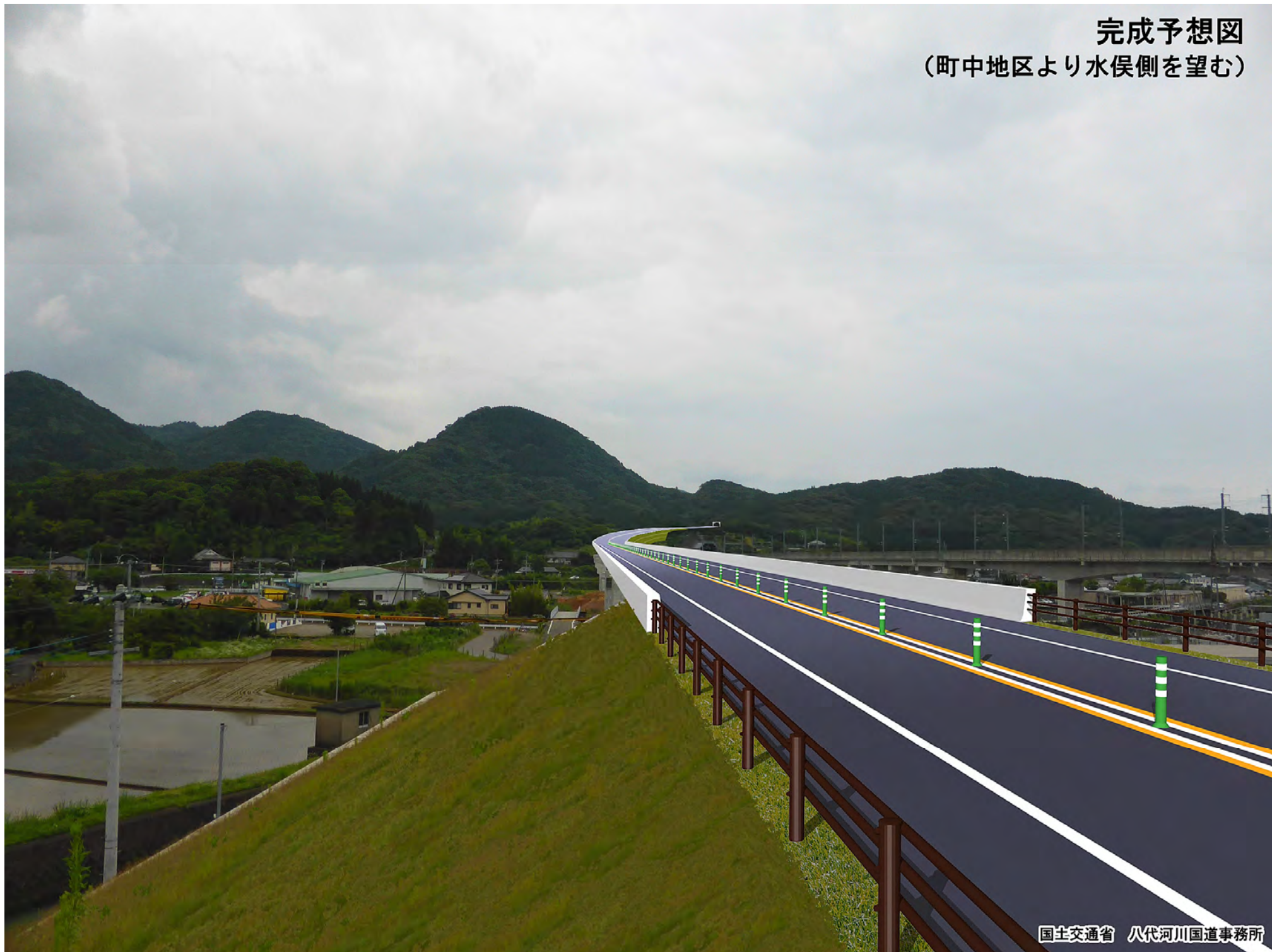
完成予想図 (町中地区より水俣側を望む)