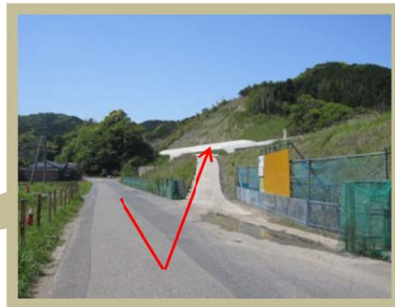
▲車での入場ルート