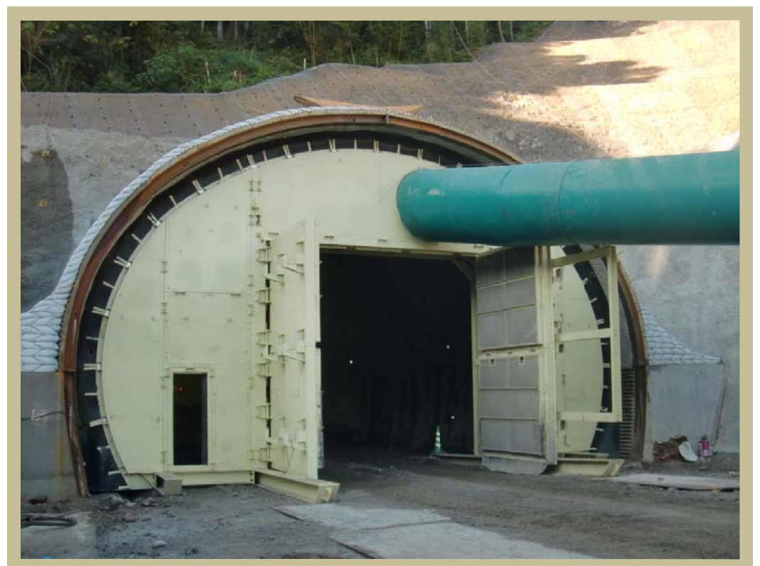
▲トンネル坑口防音扉設置状況

扉の下部には、ソリが付いており、掘削の進行に合わせて、トンネル内部に移動し、次に2枚目の扉を設置します。2枚目の扉を設置することで、発破時の騒音が基準値以下になり、いよいよ本格的な発破作業の開始です。