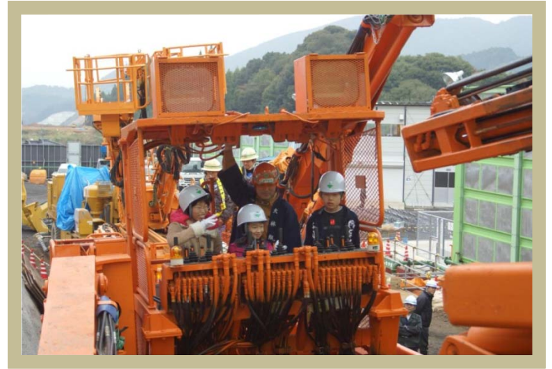
▲津奈木トンネル見学会の様子

開催日：10月28日(日) 10:00~11:00 (雨天決行) 参加費：無料 定員：なし 服装：自由 (長靴をお勧めします)