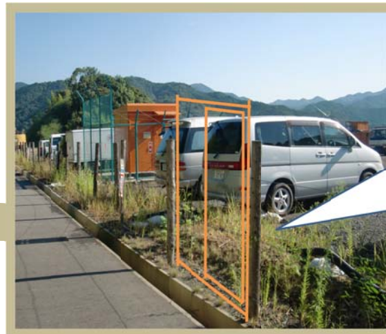
▲徒歩での入場ルート

前回、大勢の方が徒歩にて来場されましたので、徒歩での入場ルートを設置しましたのでご利用できます。普段は、施錠しておりますので使用できません。