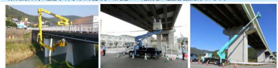
橋梁点検車による点検

・特殊点検車両や船舶等で、ふだんは見えない所も近づいて技術者が近接目視点検しています。