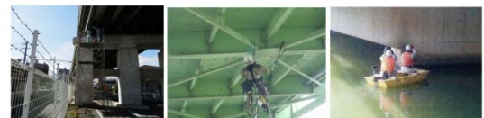
足場設置による点検