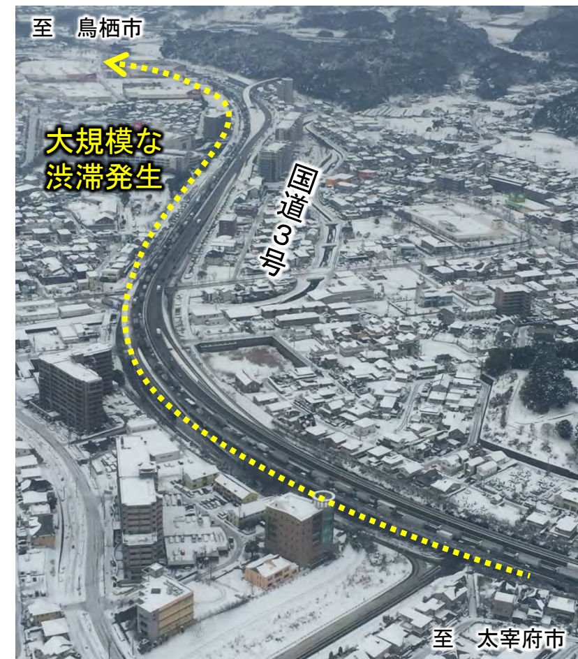
▲国道3号の渋滞状況(福岡県筑紫野市上空)