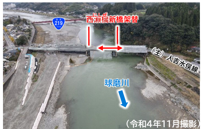
西瀬橋の仮橋撤去前の状況