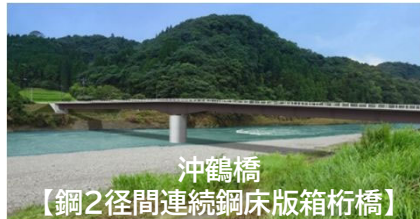
沖鶴橋 【鋼2径間連続鋼床版箱桁橋】