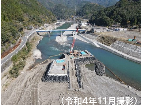
坂本橋の工事状況