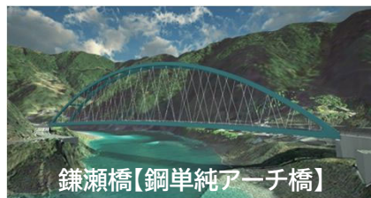
鎌瀬橋【鋼単純アーチ橋】