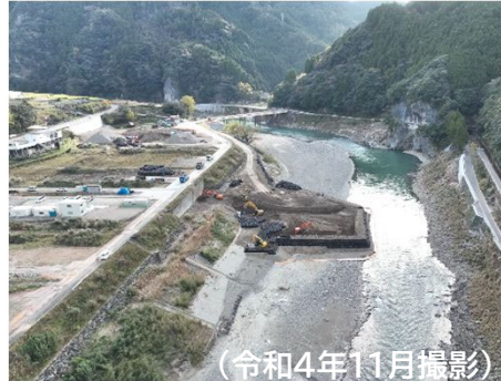
大瀬橋の工事状況