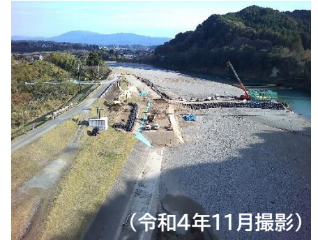
沖鶴橋の工事状況