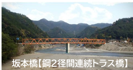
坂本橋【鋼2径間連続トラス橋】