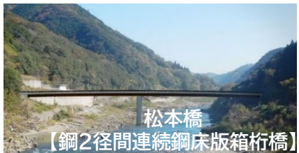
松本橋 【鋼2径間連続鋼床版箱桁橋】