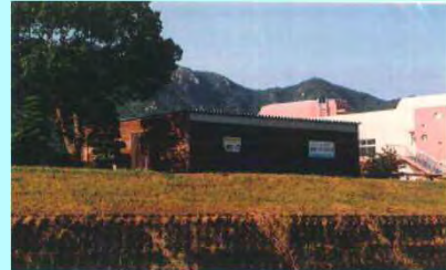
市民団体による活動拠点の整備事例（佐波川）

※ 河川管理者から河川管理施設の維持、除草等の委託を受けることも可能となります。委託先については、公募等の適正な手続きを経て選定を行う予定です。