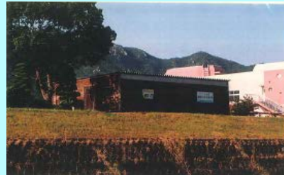
市民団体による活動拠点の整備事例（佐波川）

※ 河川管理者から河川管理施設の維持、除草等の委託を受けることも可能となります。委託先については、公募等の適正な手続きを経て選定を行う予定です。