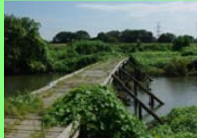
ビオトープの整備