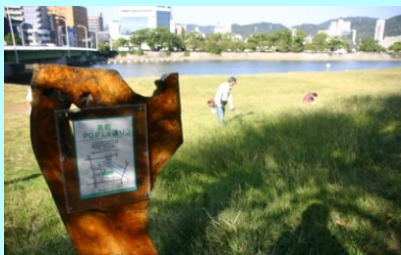
市民団体による看板設置事例（太田川）