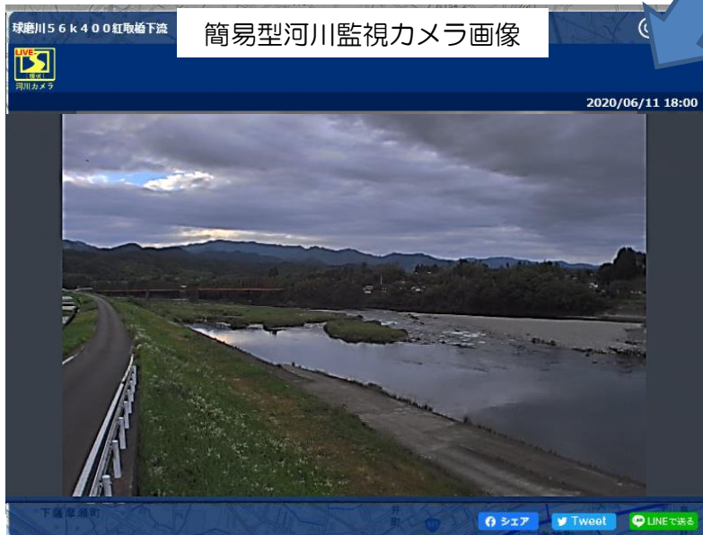
簡易型河川監視カメラ画像