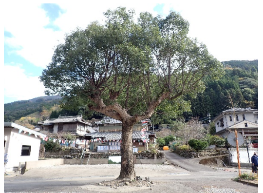
移植前のクスノキ