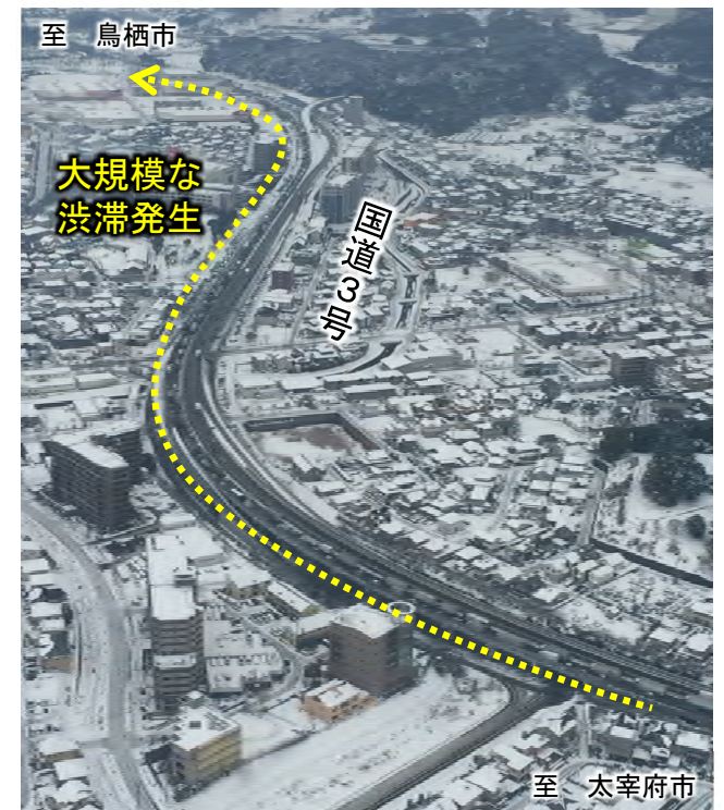
▲国道3号の渋滞状況 (福岡県筑紫野市上空)