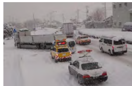
▲立ち往生車両の発生状況 (鳥栖市)