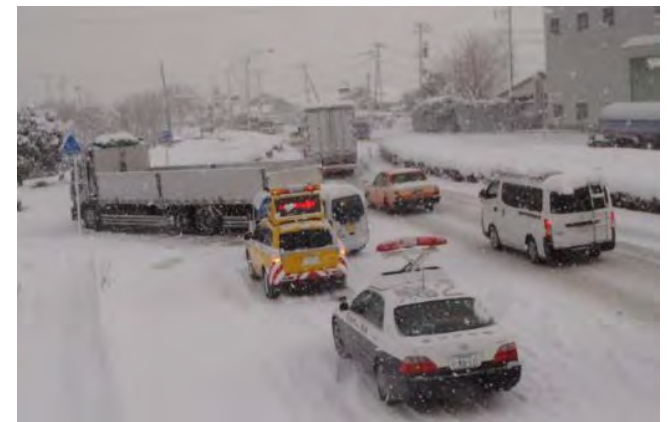
▲立ち往生車両の発生状況(鳥栖市)