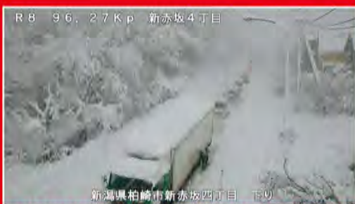
R8 96.27Kp 新赤坂4丁目