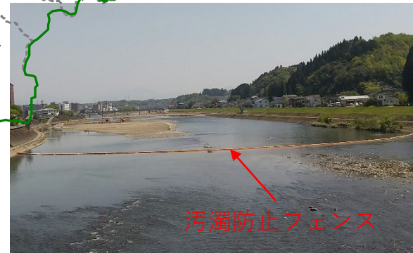
汚濁防止フェンス

動植物の生息・生育環境に配慮し下流への濁水流出を抑える汚濁防止フェンスや人吉層の露出に留意して、洪水が円滑に流下できるように掘削を実施中。