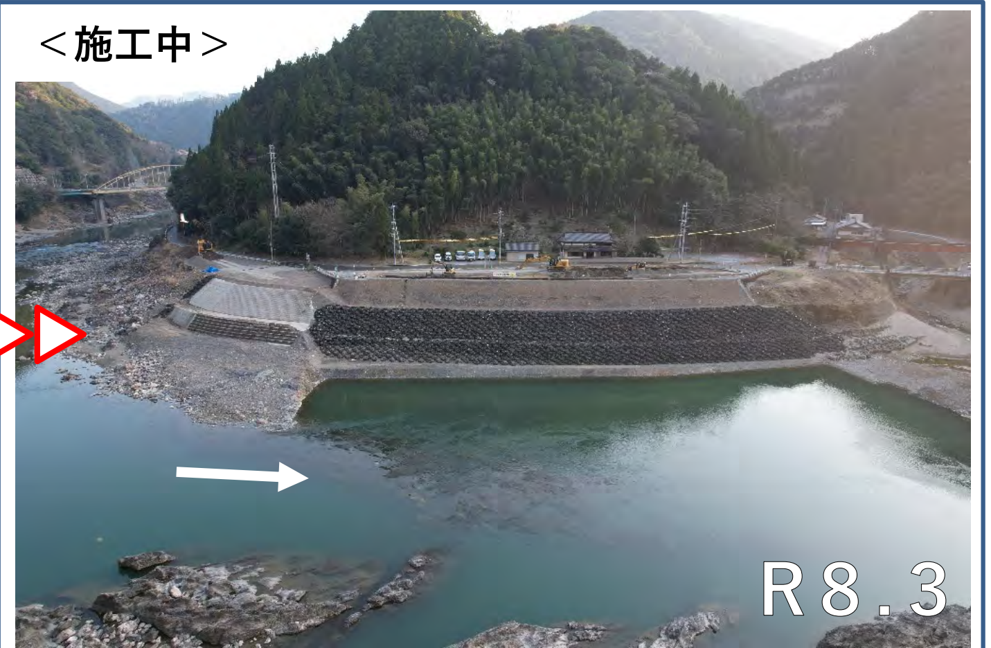
< 施工中 >