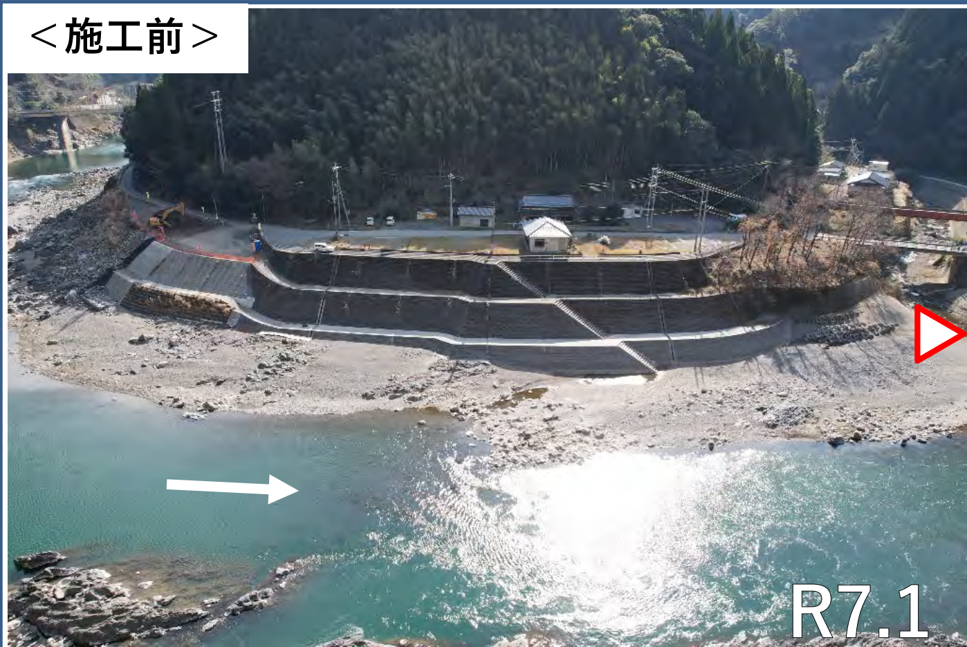
< 施工前 >