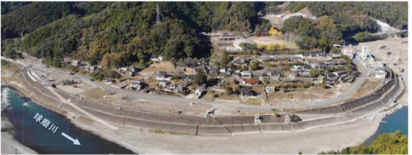
施工状況（令和5年12月末時点）