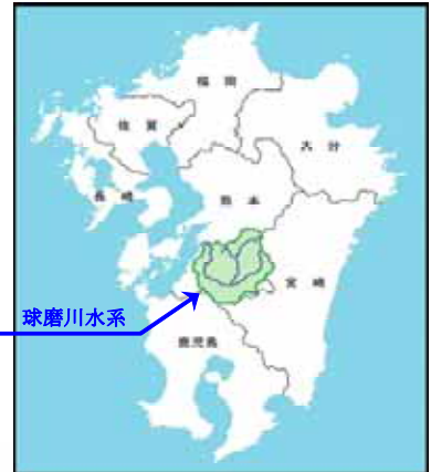
球磨川水系位置図