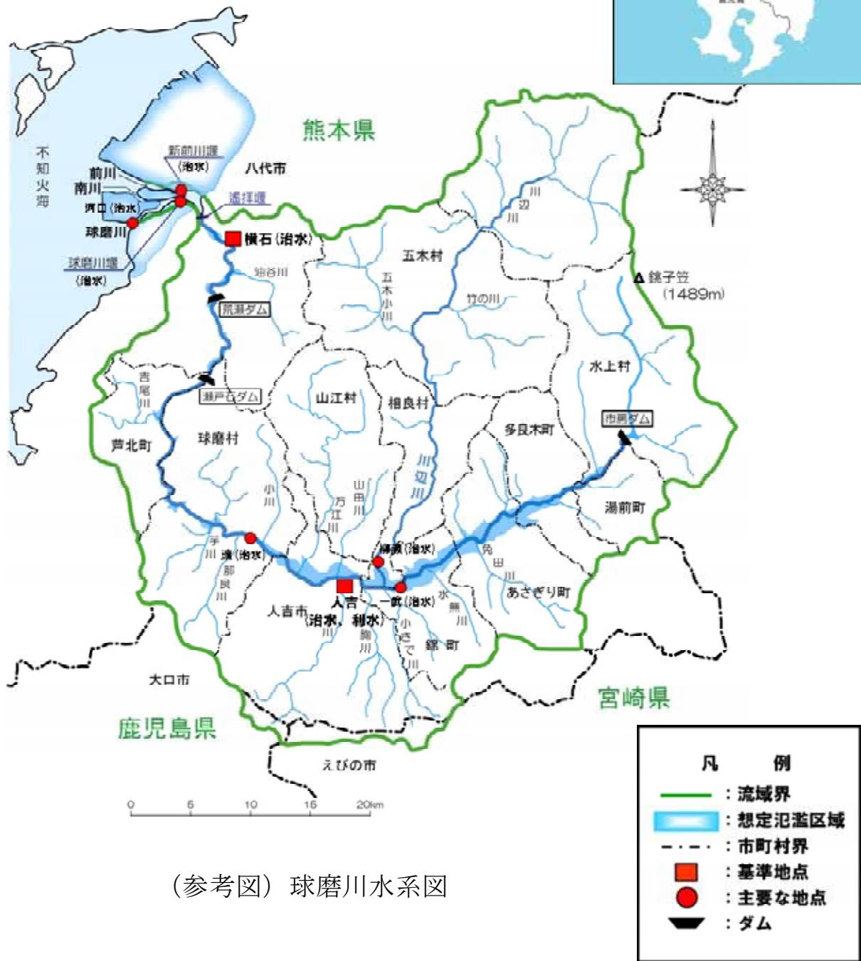
(参考図) 球磨川水系図