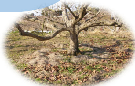
果樹園・茶畑の敷草