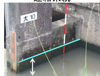
クリーク先行排水後の水位低下状況