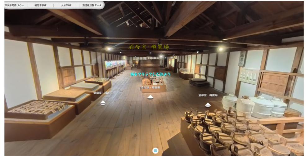
【帆足本家酒造蔵内部 2階】 酒母室・樽置場