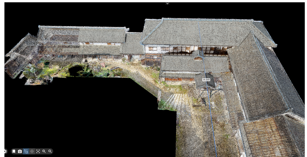
【帆足本家酒造蔵】 3D点群モデル