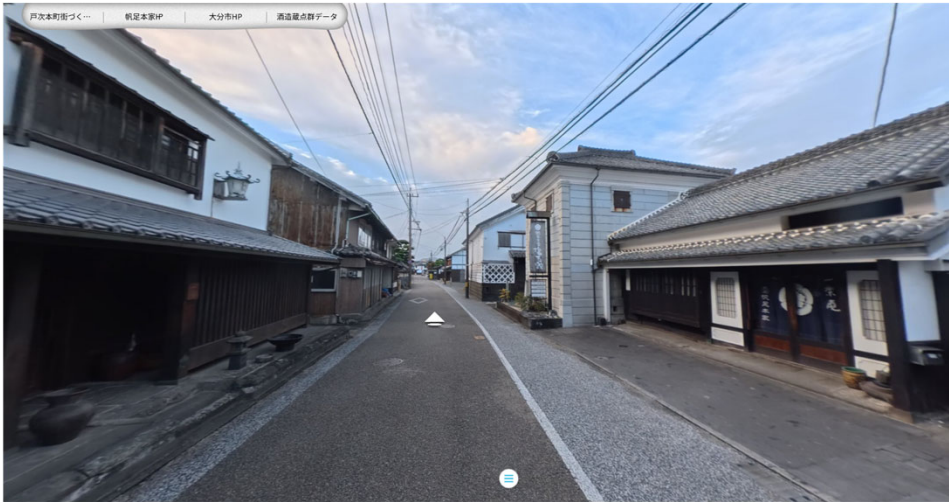
【戸次本町のまちなみ】

戸次本町のまちなみの魅力を、360度視点で体感できるバーチャルツアーです。周辺の建造物による街並みの一体感だけでなく、市指定有形文化財「帆足本家酒造蔵」の3D点群モデルや酒造蔵の建物内部も見ることができます。