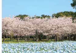
広大なネモフィラ畑など、魅力的な花修景の形成