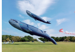
イベントの開催地として活用 写真は風揚げフェスティバル