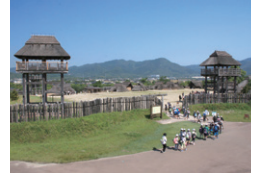
歴史体験・学習の場として活用