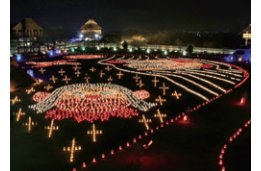
イベントの開催地として活用 写真は光の響