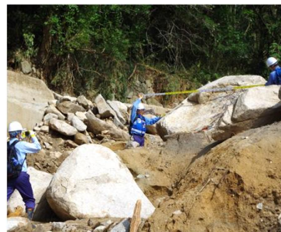
土砂災害被害状況の調査