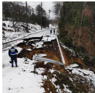
道路被害状況の調査