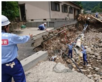
河川被害状況の調査