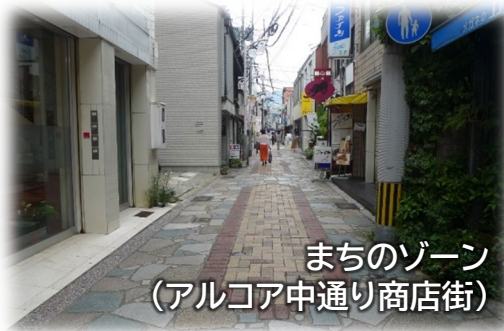
まちのゾーン (アルコア中通り商店街)

地域と連携しながら、歴史ある中島川・寺町エリアの風情を活かした景観再生の取り組みを進めていく。