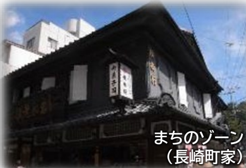
まちのゾーン (長崎町家)