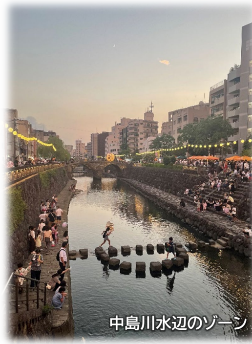
中島川水辺のゾーン