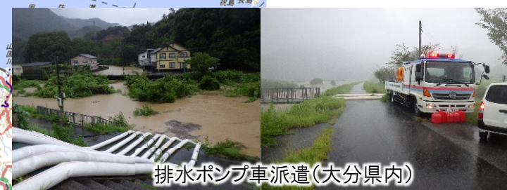
排水ポンプ車派遣(大分県内)