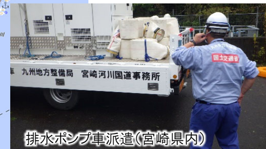
排水ポンプ車派遣(宮崎県内)