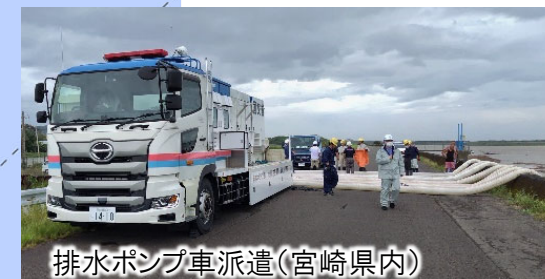
排水ポンプ車派遣(宮崎県内)