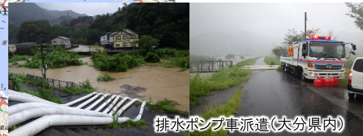
排水ポンプ車派遣(大分県内)