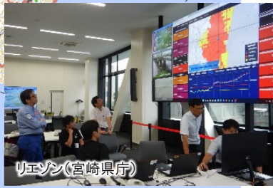
リエゾン(宮崎県庁)