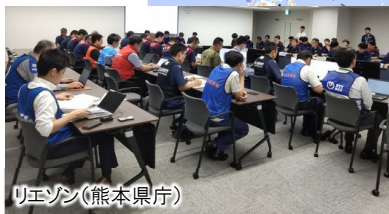
リエゾン(熊本県庁)