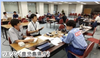
リエゾン(鹿児島県庁)