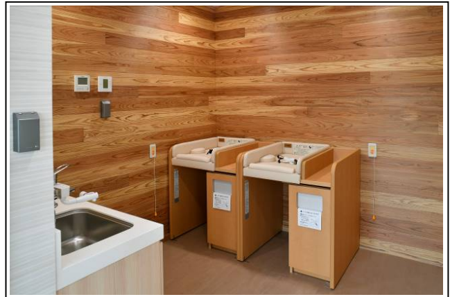
▲ベビーコーナー（24時間利用可能）