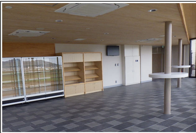
▲リニューアルした情報提供・休憩室 (24時間利用可能)